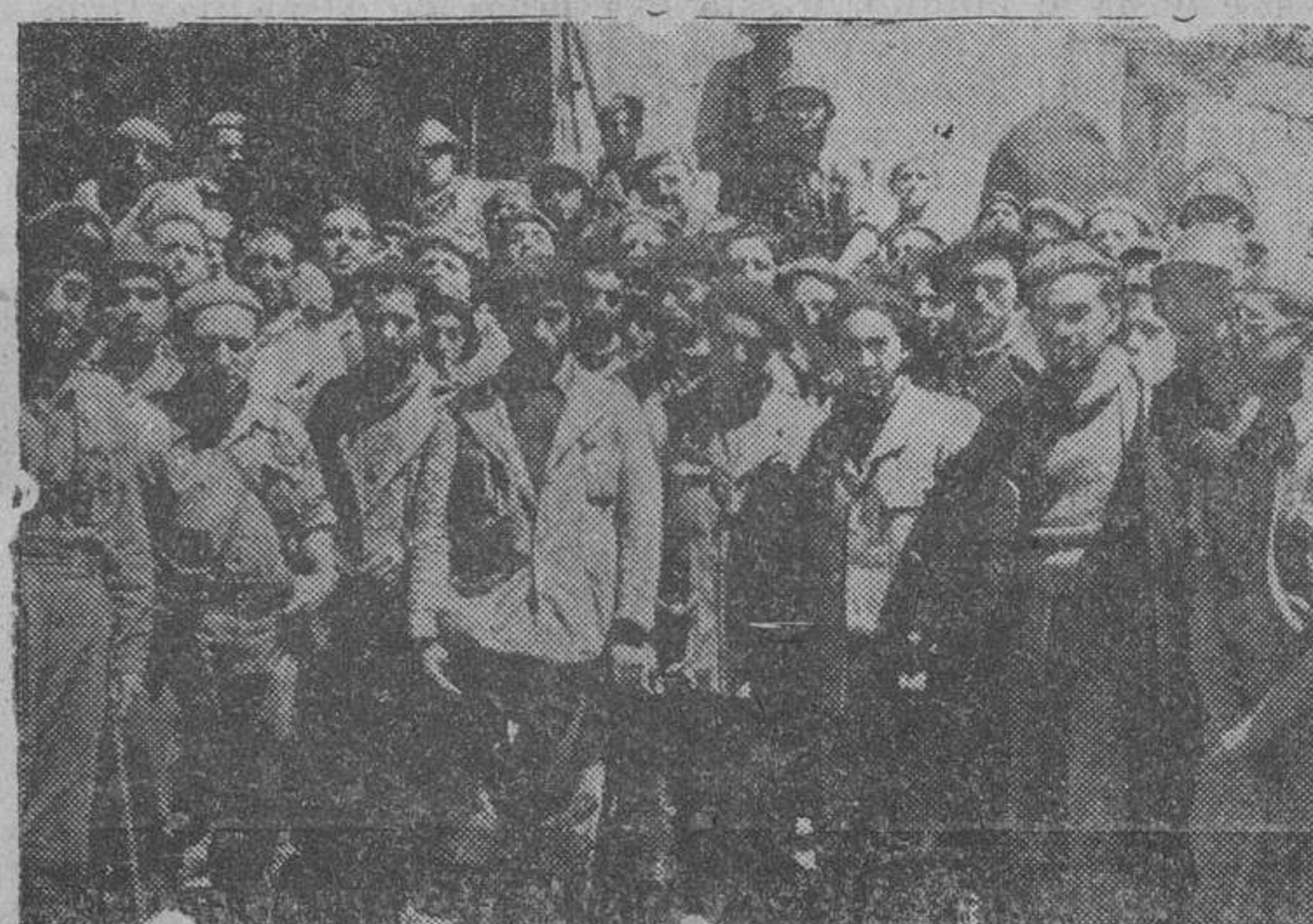
Algunos de nuestros oficiales y soldados con los prisioneros cogidos en Begoitia que no parecen muy descontentos con su suerte

Ejército del Norte, compuesto por los Cuerpos del Cantábrico, queda mandado por el general Dávila. El Ejército del Centro, compuesto por los Cuerpos de Ejército de Castilla y Aragón, queda mandado por el general Saliquet. El Ejército del Sur continuará en la misma forma que hasta ahora.