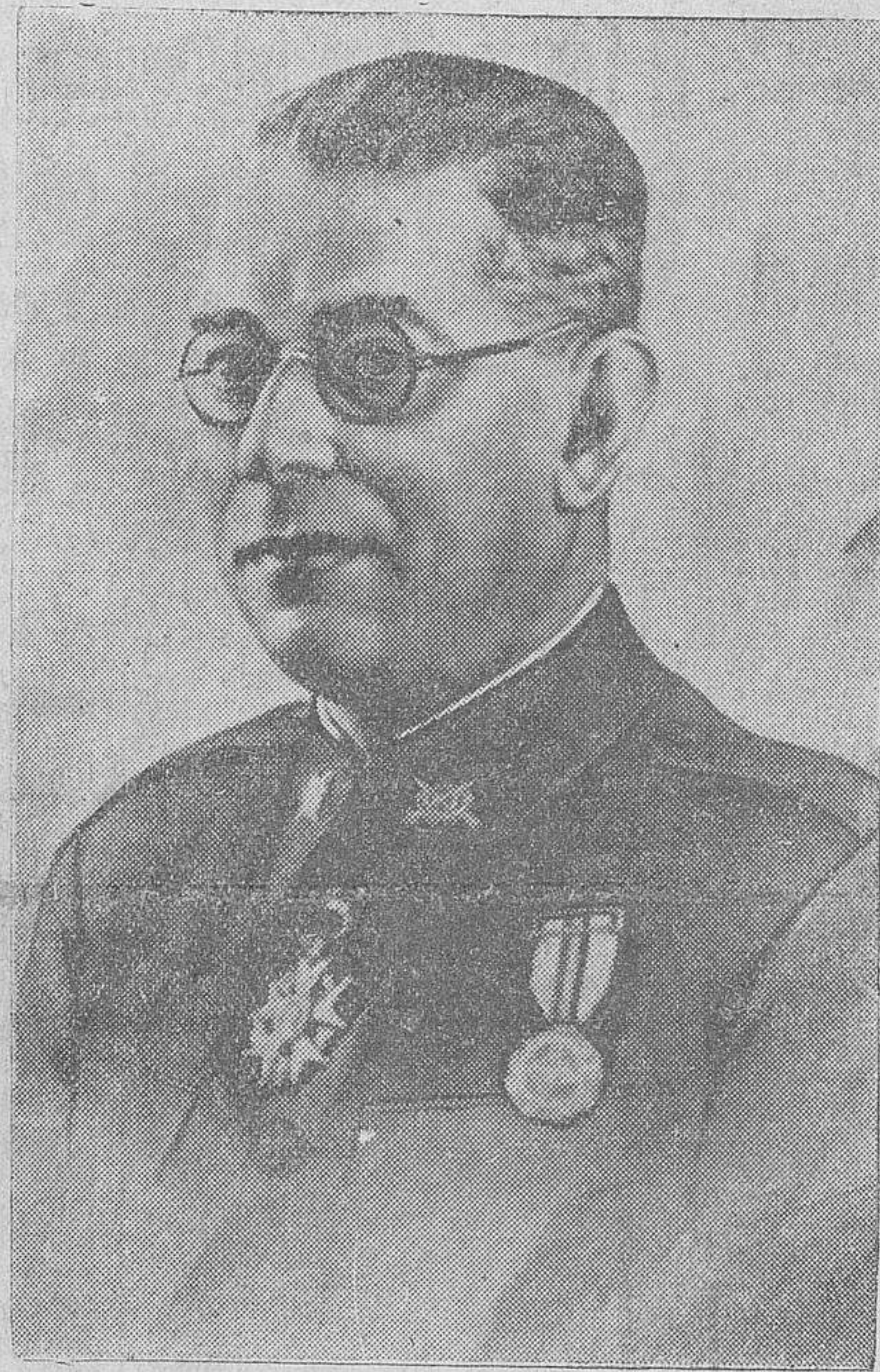
Don Emilio Mola Vidal

firma junto a la de un ser repulsivo, monárquico sin rey y cristiano sin Cristo a que antes he aludido, que fue uno de los más entusiastas jaleadores de los llamados tribunales populares, tribunales integrados por unos hombres que sin otro Código a que sujetarse que el de sus sangüinarios instintos, han llenado los cementerios