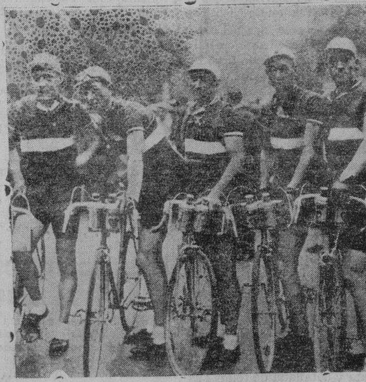
Los cinco ciclistas luxemburgueses, mitad magnífica del equipo que completan los españoles en la Vuelta a Francia