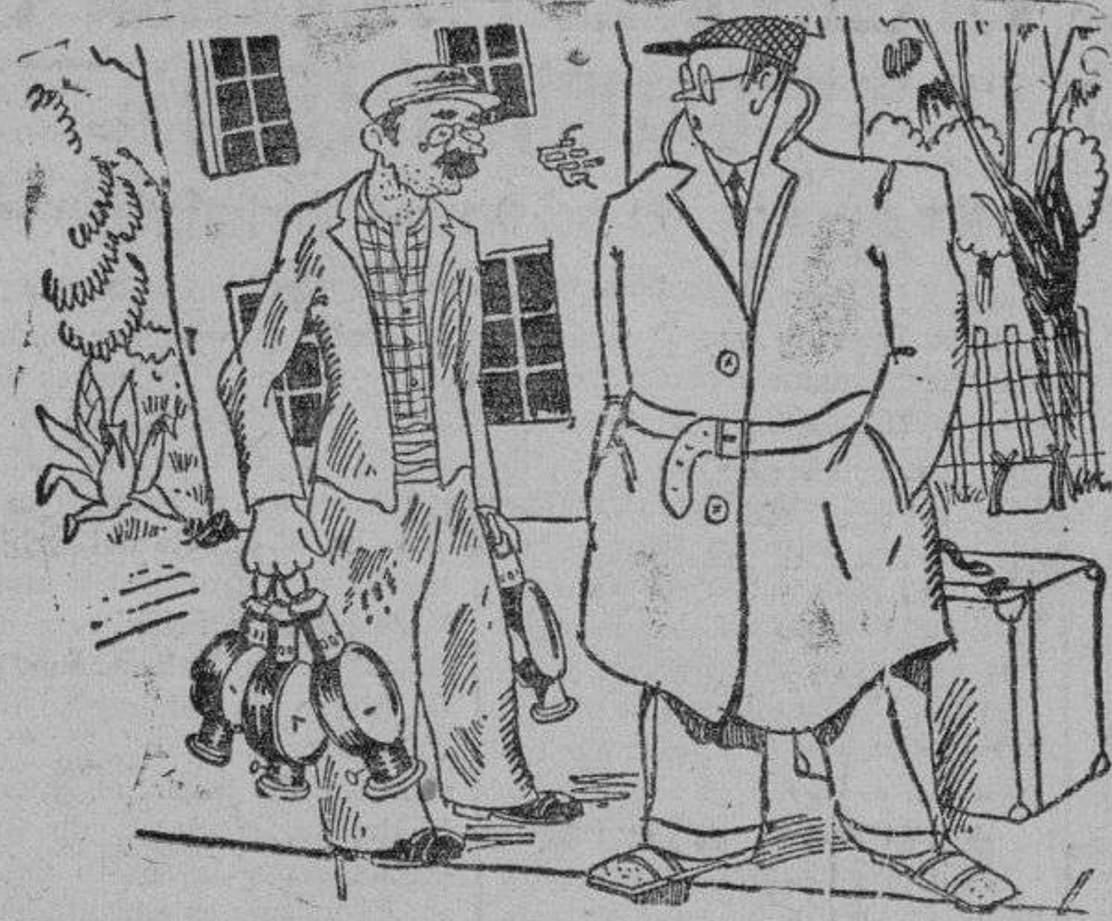
EL TREN QUE NO LLEGA

—Hay frecuencia de trenes en esta línea? —Sí, señor. Los tenemos cada treinta minutos. Después del de las 4,45 que ha perdido, vendrá el de las 4,75.