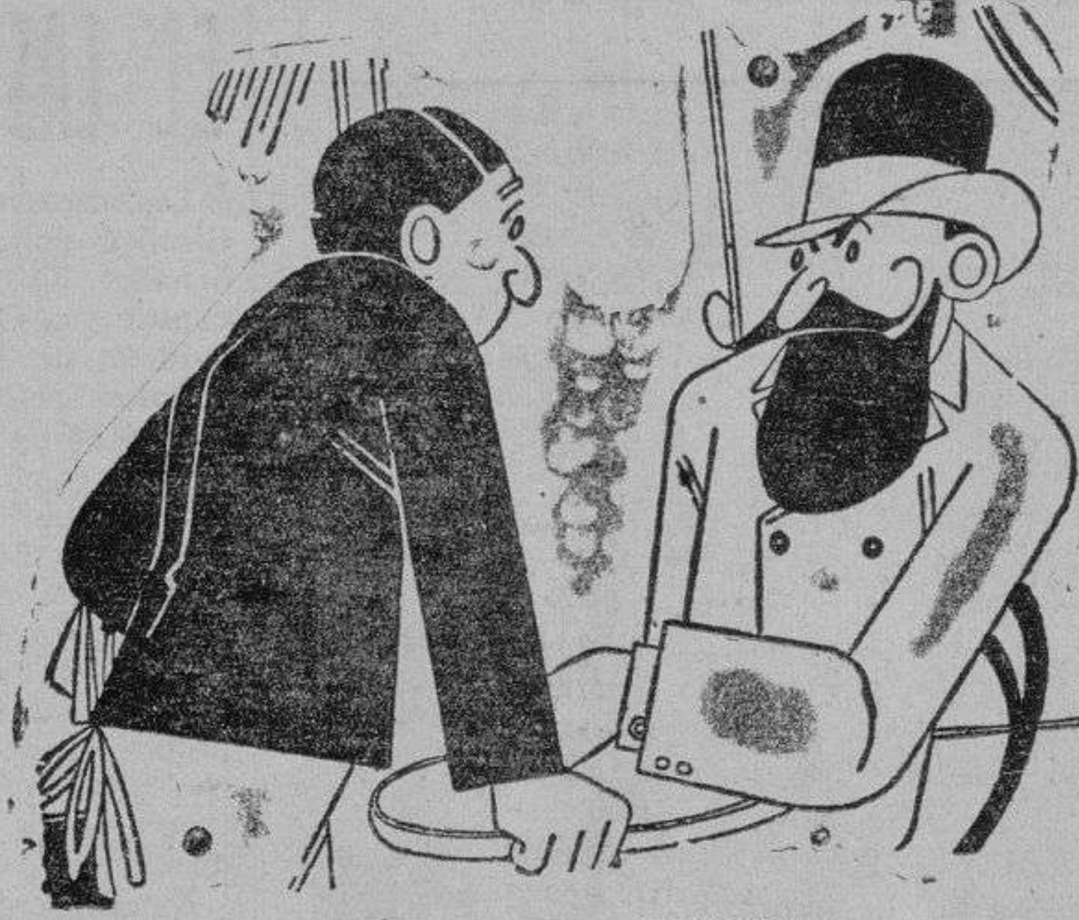
A TONO CON EL TIEMPO

—Oye, camarero, ¿tenéis café helado? —Sí, señor. —Pues calientame uno.