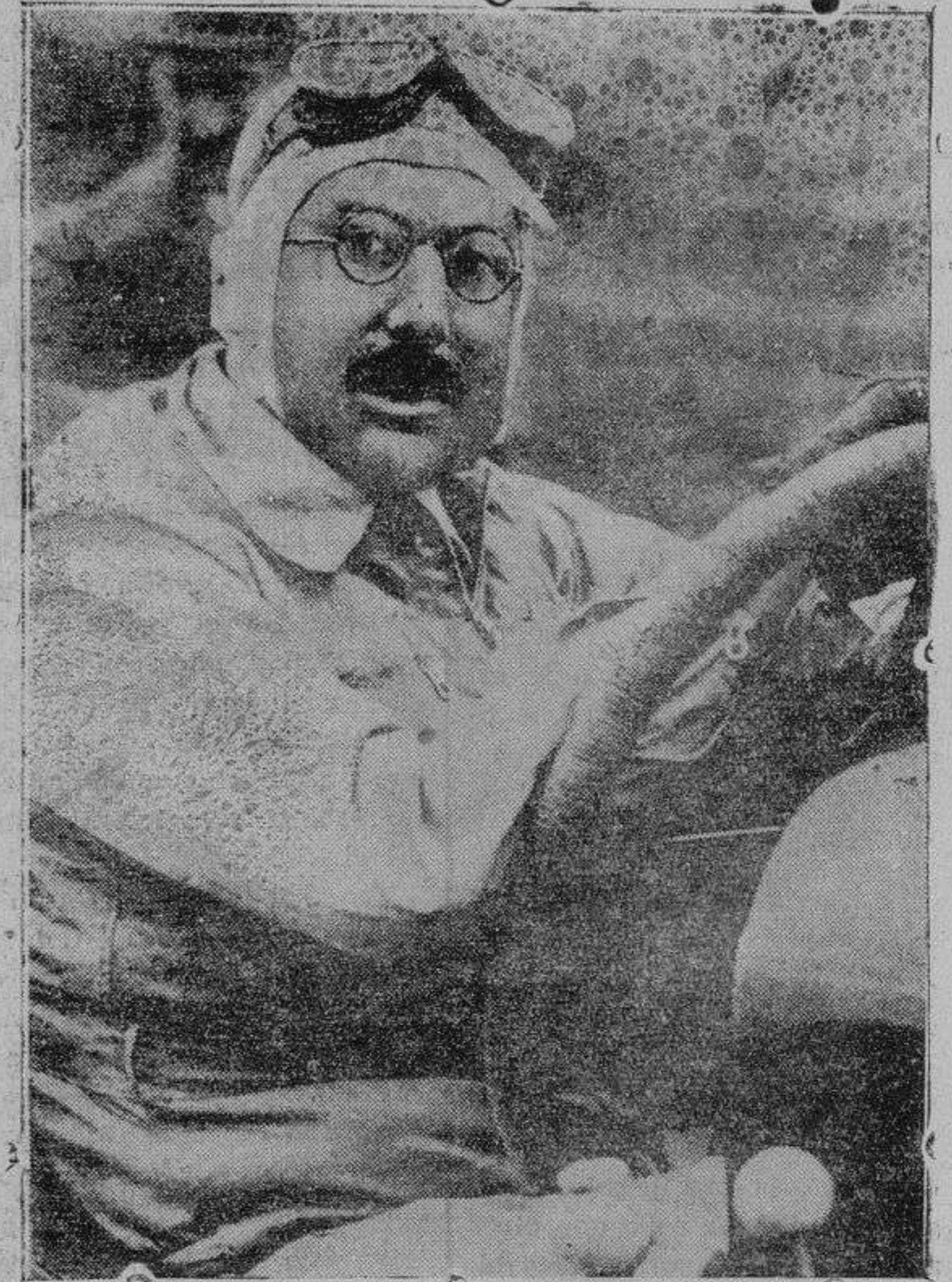
El corredor Eyston, que ha batido su propio record de la hora

Salts Beds.—En Bonneville, lugar prodigioso indudablemente cuando los recordmen insisten en visitarlo, pese a la distancia que les separa de todo centro civilizado y, desde luego, del continente europeo, Eyston sigue imperturbablemente su caza al record . El año pasado, el 15 de setiembre, estableció su última marca sobre