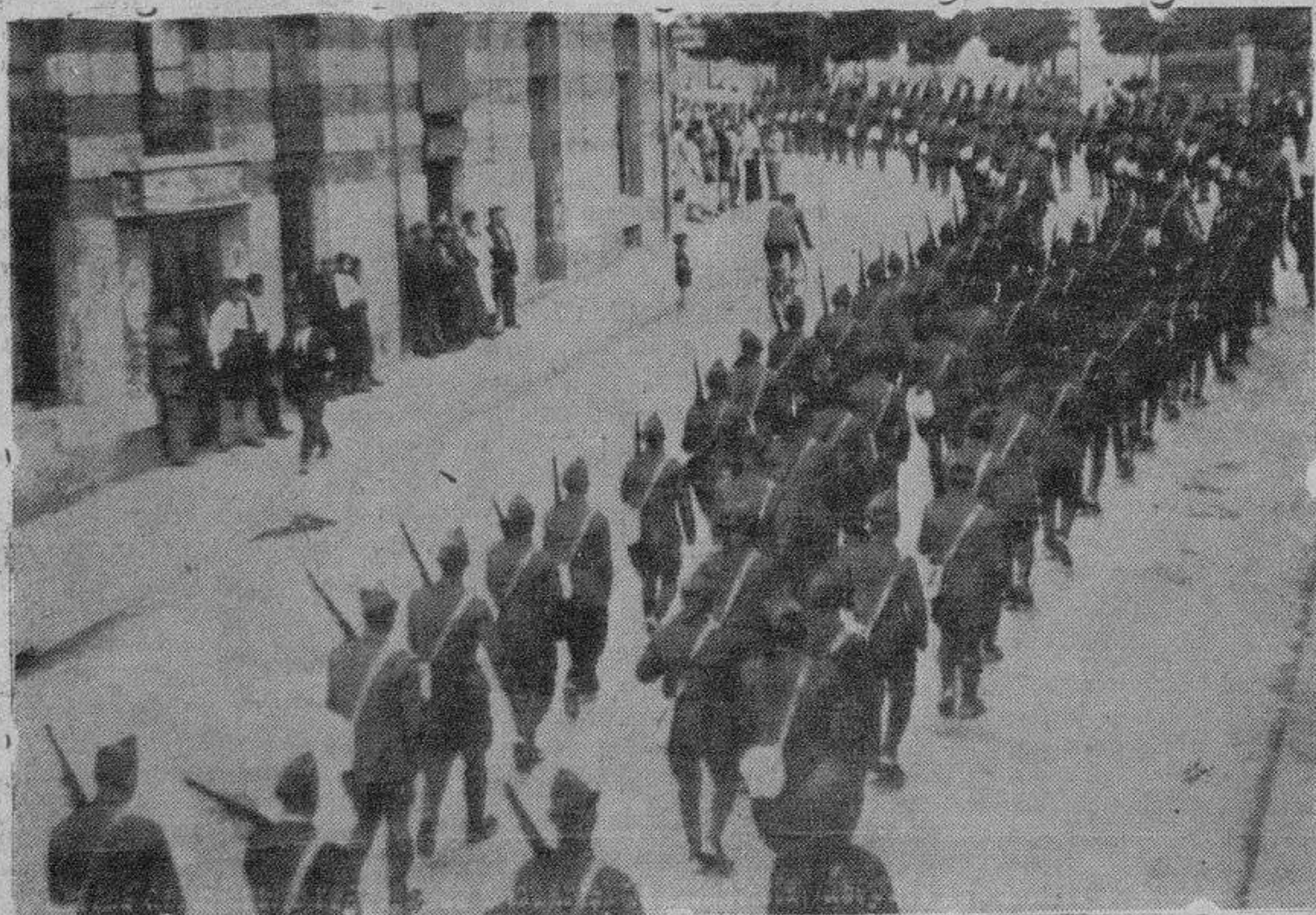
Fuerzas del Ejército regresando al cuartel de Infantería, después de realizar prácticas de tiro

“EL ADELANTO” ES EL PERIÓDICO DE MAYOR CIRCULACIÓN EN LA PROVINCIA