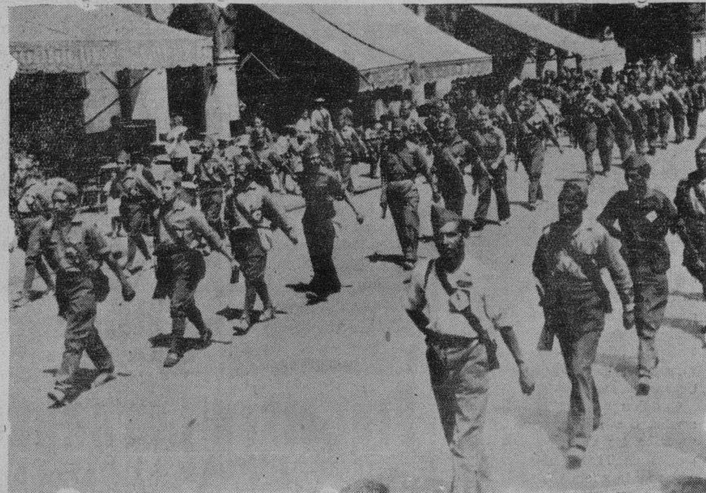
Las milicias de Acción Popular durante uno de sus desfiles por la ciudad