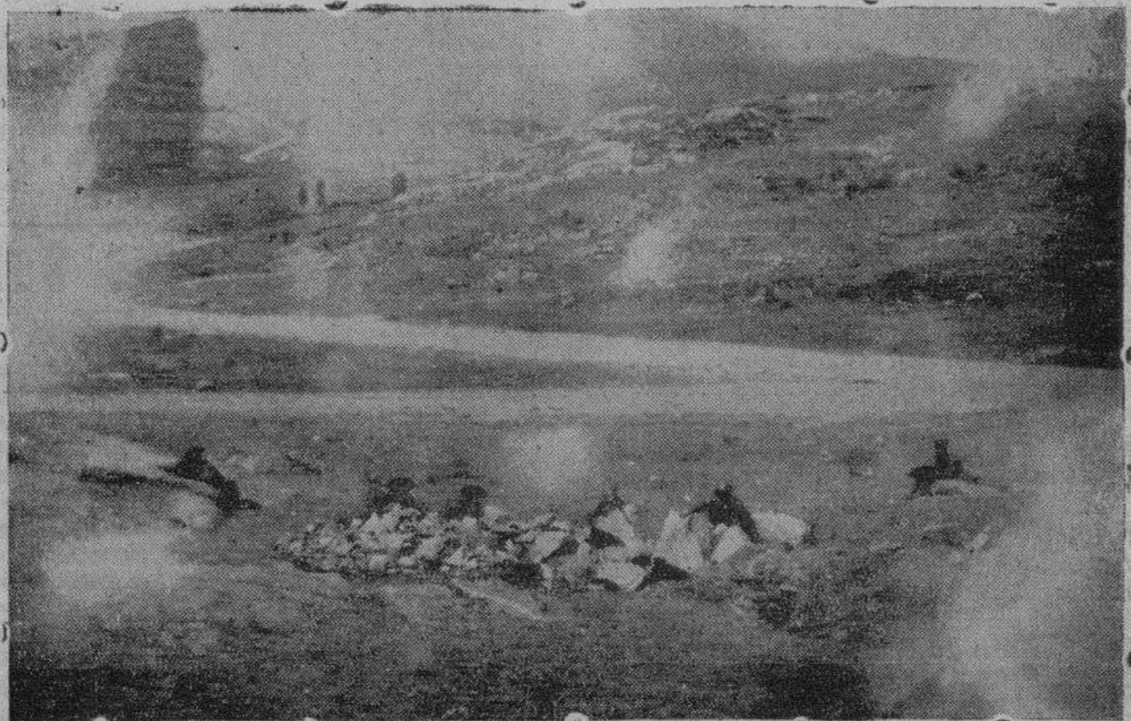
Fuerzas de la Guardia Civil y de Falange Española en un avance, en guerrilla, en el frente de Guadarrama.—Foto Corresponsal de guerra

El servicio correspondiente al día de hoy, 12 de Agosto, lo prestará la segunda compañía.