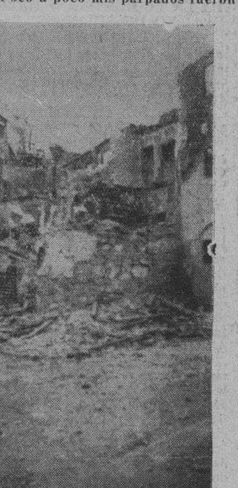
La parte central de Toledo ha pasado a ser esto: un montón de ruinas

que es la del nacimiento, la de la muerte, la de la reproducción e identificación con la tierra madre. Frente a mí, Toledo, prócer y señora con sus ruinas monumentales entronizada sobre sus siete colinas, que como Roma muestra su manto de reina y deja caer hasta los rodaderos las fimbrias de su veste imperial. Poco a poco mis párpados fueron