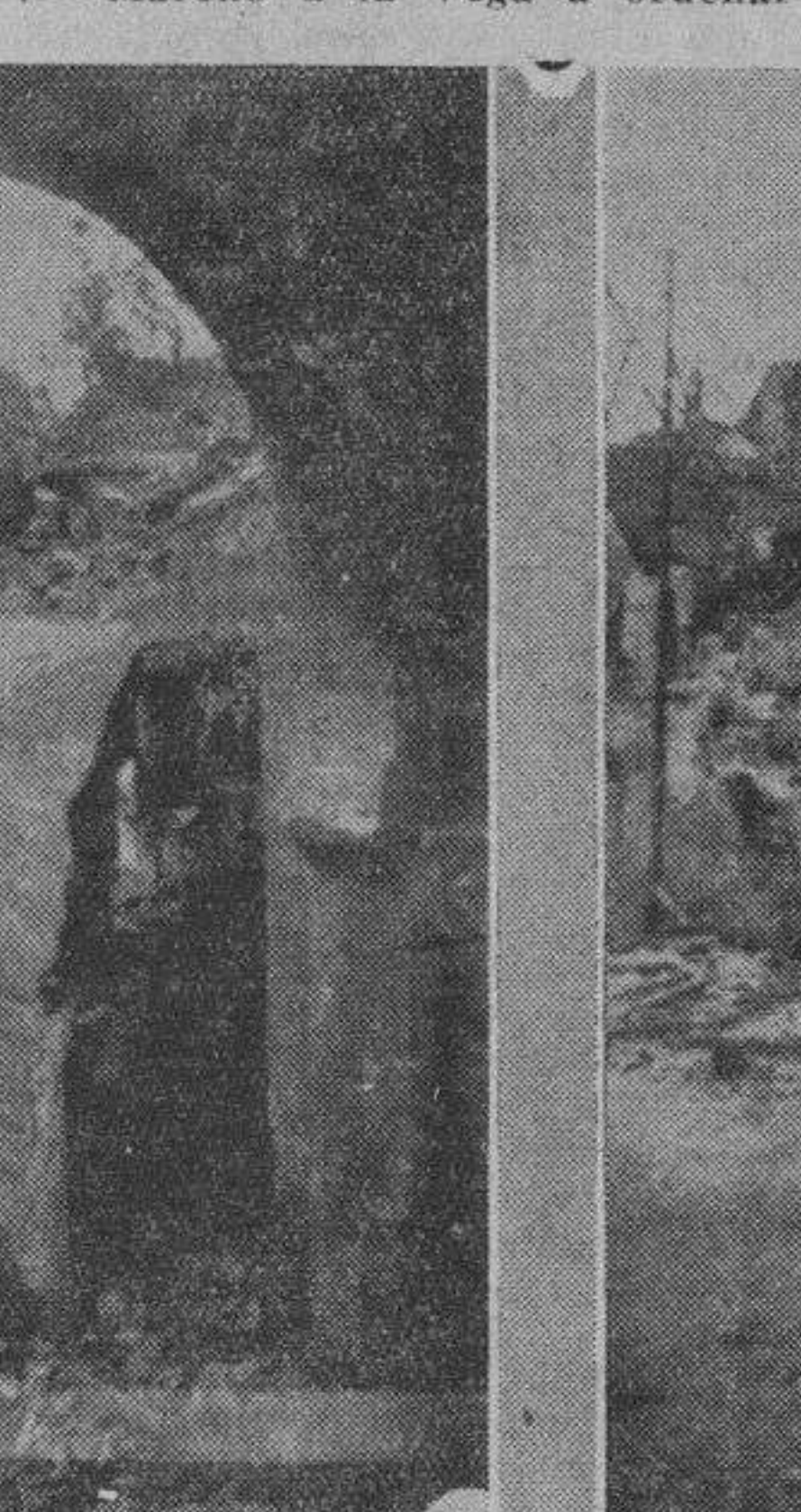
La parte central de Toledo ha pasado a ser esto: un montón de ruinas

¿Se han cometido muchos asesinatos? Mucho sí, principalmente con los religiosos. Cuando se fusilaba alguno de éstos, los que procedían a la conducción del sentenciado descargaban el peine de sus mosquetones sobre el infeliz, el cual caía con más de cien balas en su cuerpo.