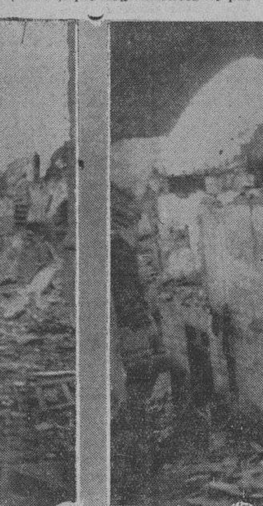
La «Posada de la Sangre», donde Cervantes escribió «La ilustre fregona»

¿Se han cometido muchos asesinatos? Mucho sí, principalmente con los religiosos. Cuando se fusilaba alguno de éstos, los que procedían a la conducción del sentenciado descargaban el peine de sus mosquetones sobre el infeliz, el cual caía con más de cien balas en su cuerpo.