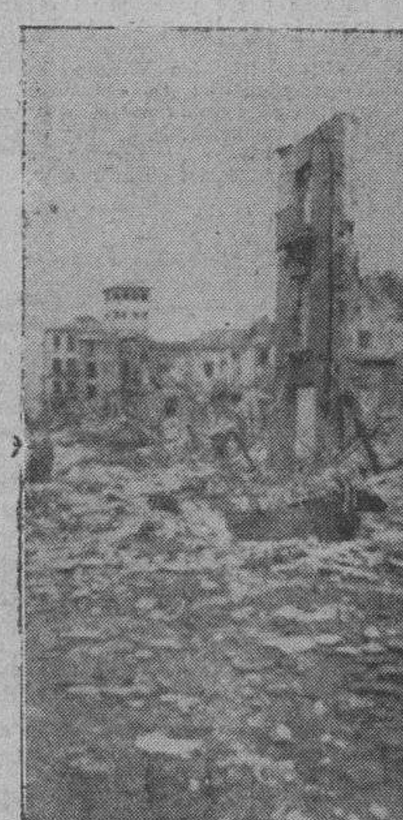
Lo que queda de la plaza de Zocodover, famoso centro de la vida toledana