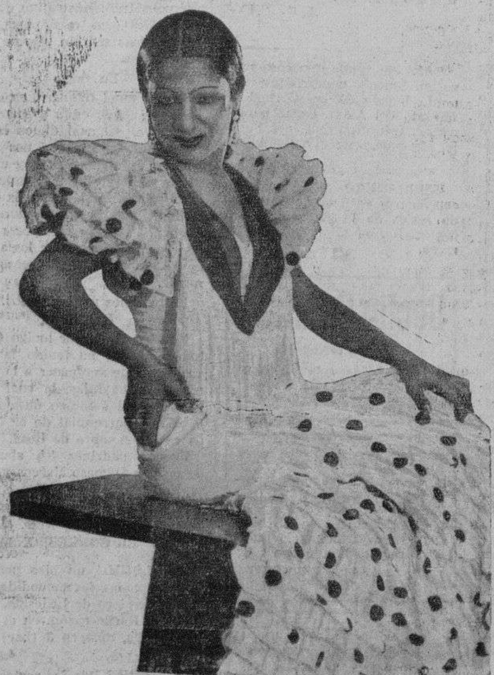
La genial estrella de variedades Carmen Amaya, que hoy debuta en el Coliseum