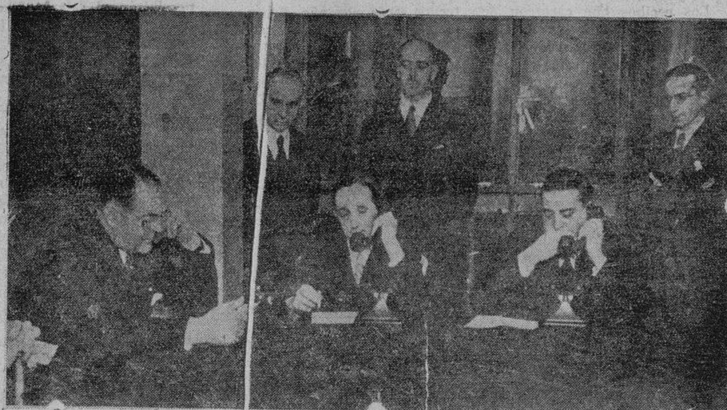
El embajador de los Estados Unidos en España, el Alcalde de Toledo y el director de la Compañía Telefónica Nacional, en el momento de establecerse la comunicación transoceánica con Toledo (Ohio)