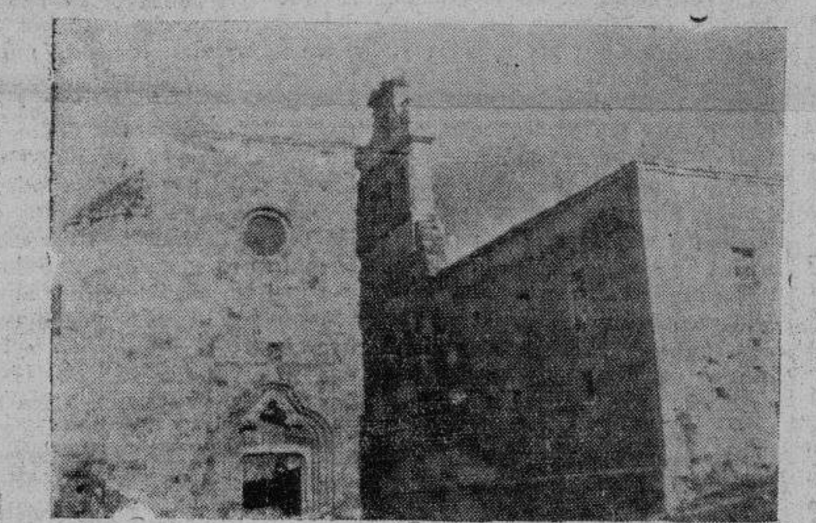
Espadaña del convento y arco gótico de la puerta de entrada

EL ADELANTO ES EL PERIODICO DE MAYOR CIRCULACION DE LA PROVINCIA