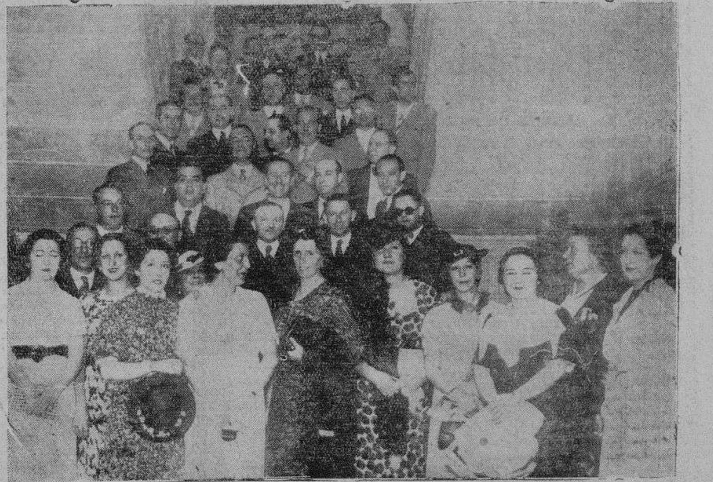
Los arquitectos de la región y sus señoras, con los concejales, en la escalera del Ayuntamiento