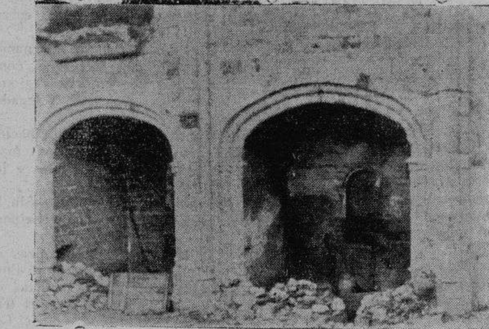
Entrada de la bóveda

Al palacio de este convento venían de los pueblos de Horcajeda, el Mirón, Barco y Piedrahíta, villas del señor de Valdecorneja, a jurar unas ordenanzas, para sus riegos, y para el cuidado de sus montes, con penas tales que el que talara un