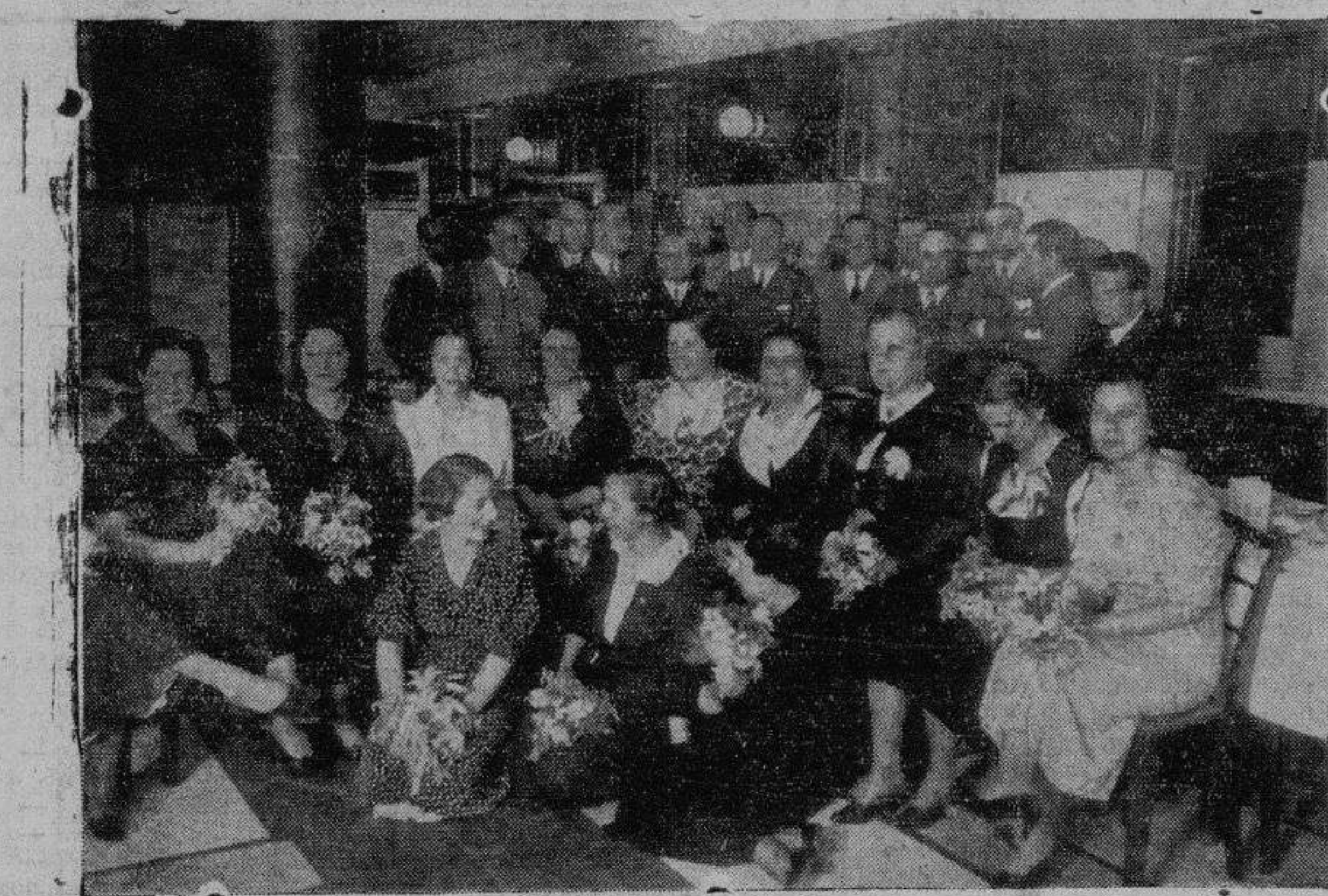
Asistentes al banquete de los arquitectos, celebrado el jueves por la noche

ES EL PERIODO DE MAYOR CIRCULACION DE LA PROVINCIA