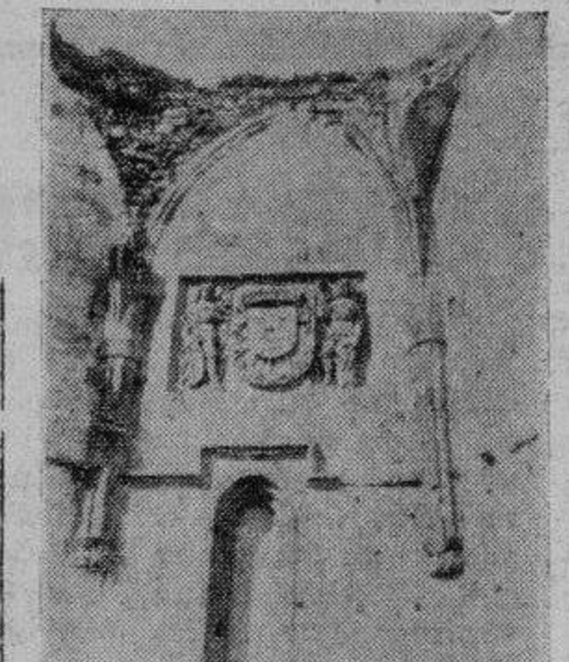
Armas del Duque, con las banderas de sus batallas plantas olorosas y medicinales. Hoy es casa de labor lo que fue plantel de cenobitas.

Los monjes Jerónimos eran amigos de los árboles, todavía queda en su huerta regaliz y