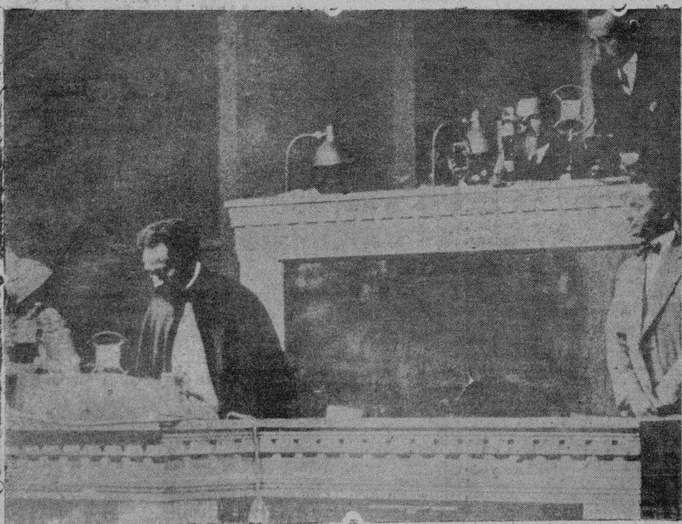
He aquí el momento histórico en que el emperador de Etiopía pronunció su discurso ante el Consejo de la Sociedad de Naciones, en defensa de sus derechos