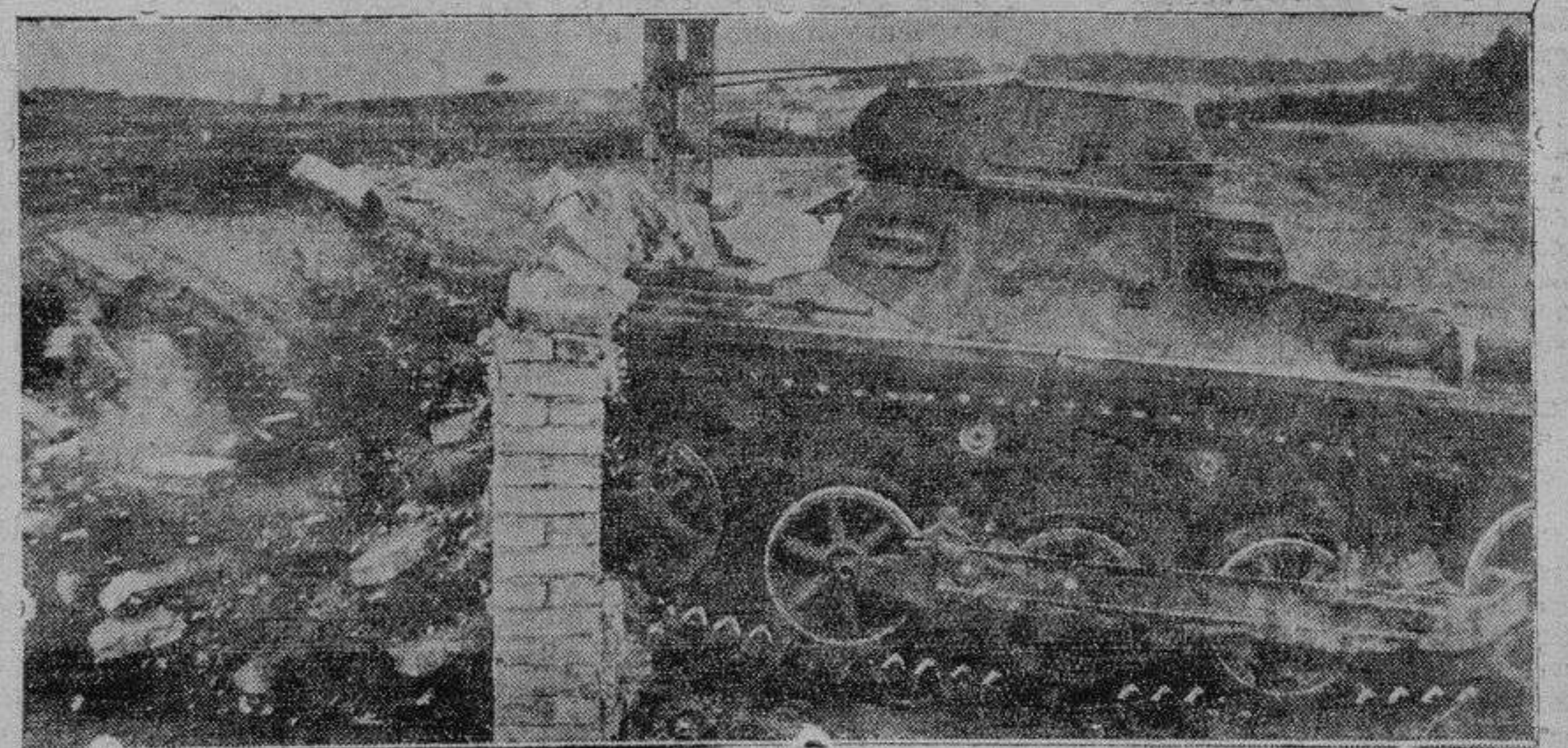
En Berlín se ha celebrado un festival deportivo militar, en el que se realizaron algunas pruebas de material. Una de ellas, la que aparece en la fotografía, consistió en que un tanque derribara, en su marcha, un muro