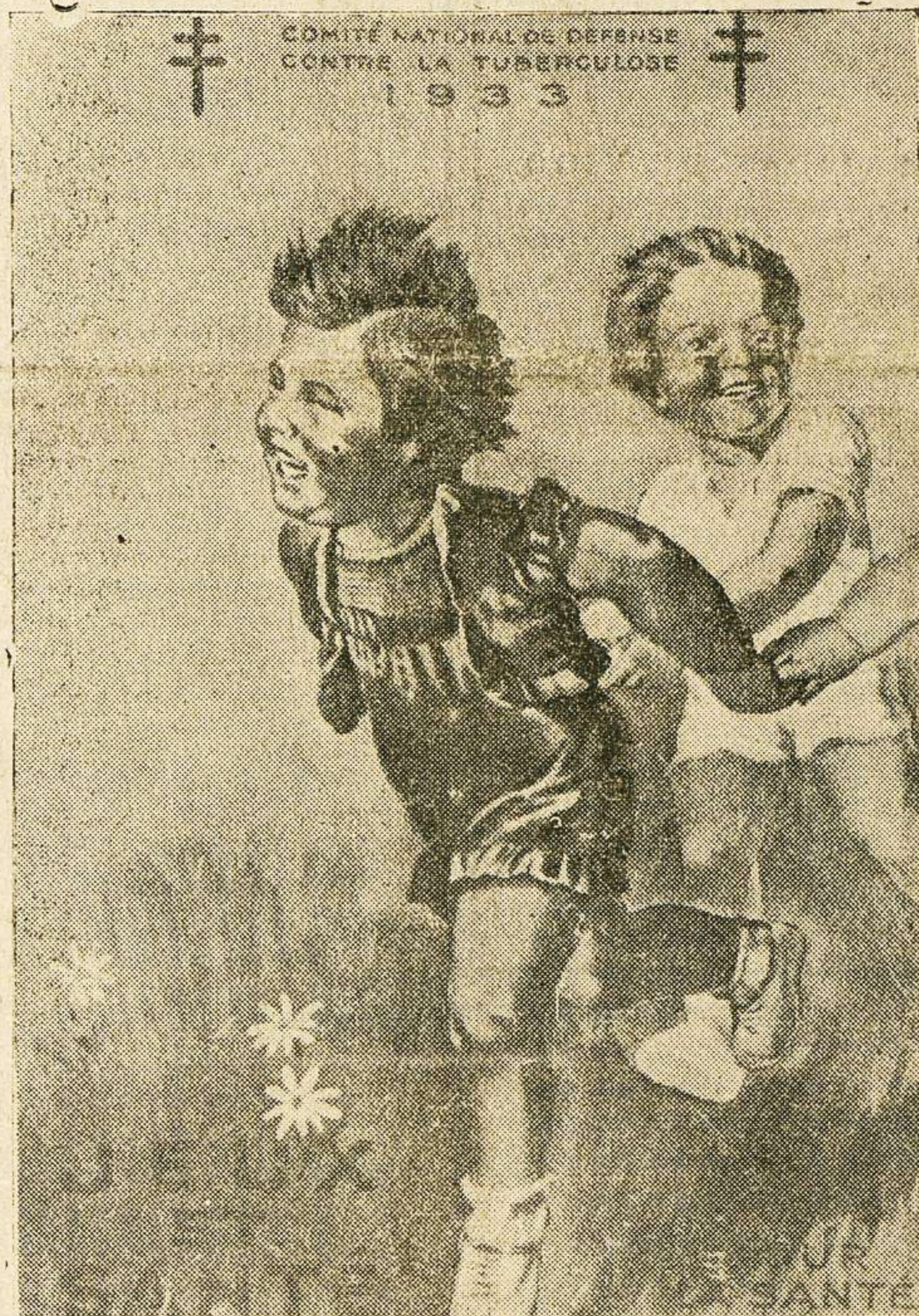
El nuevo sello antituberculoso francés, que acaba de ser puesto a la venta. Representa cómo deben ser nuestros hijos