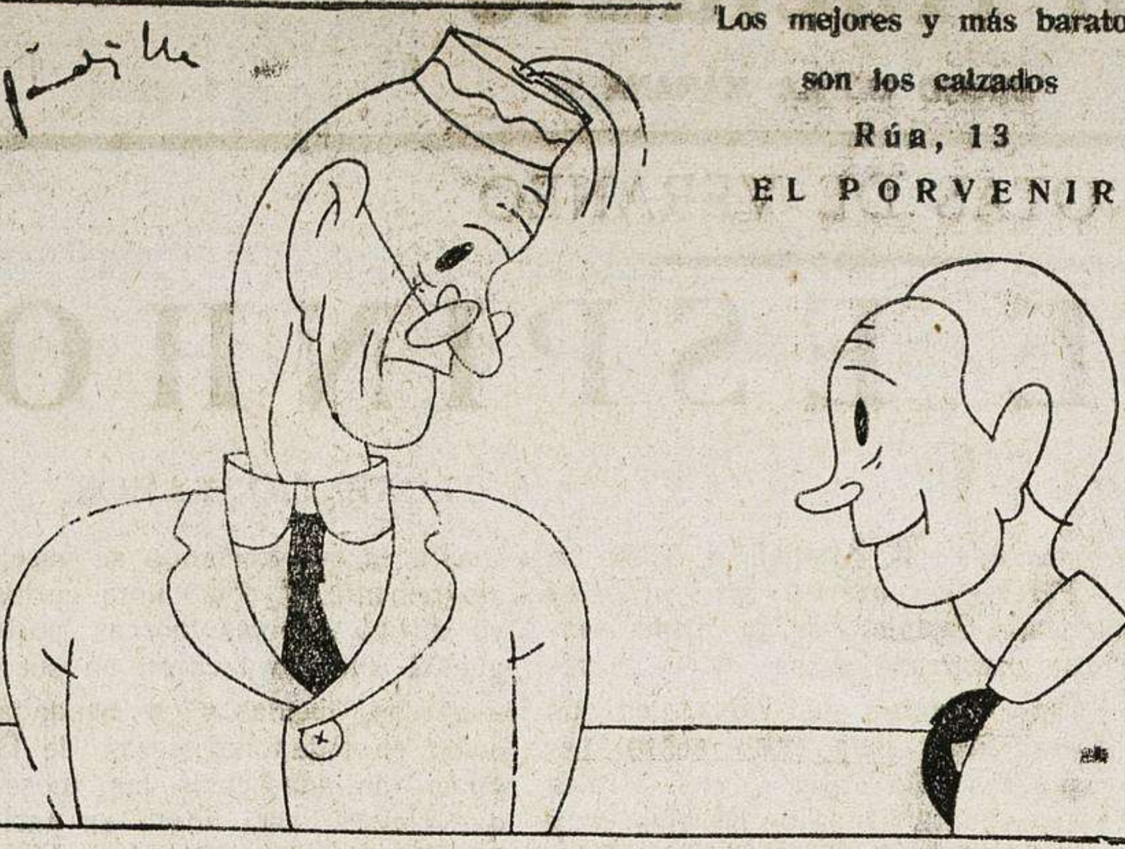
Los mejores y más baratos son los calzados Rúa, 13 EL PORVENIR