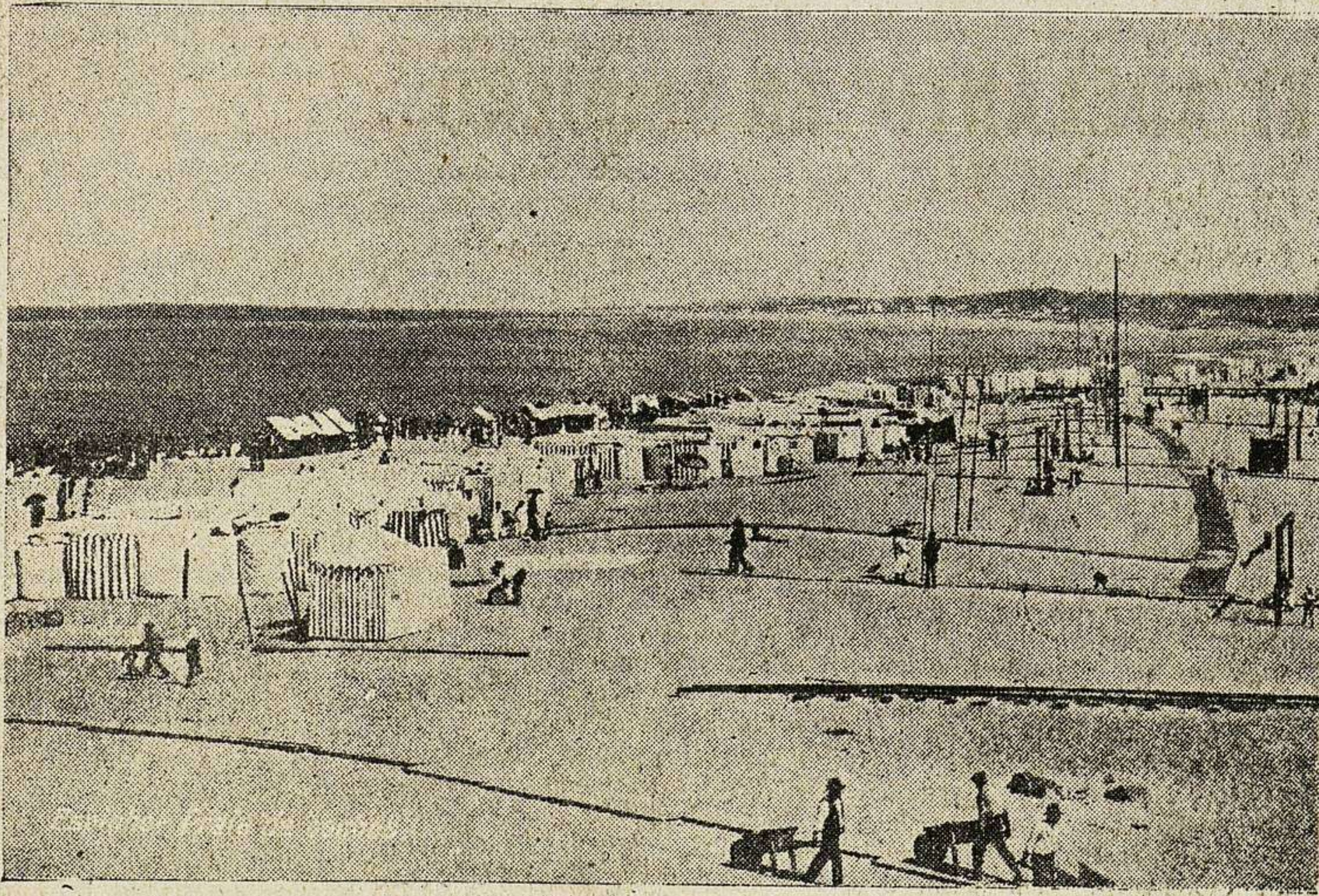
La Playa de Espinho.

charracos que vuelan o se pasean alegremente. Y como nota curiosa yo afirmo que las moscas portuguesas que me tocaron en suerte — gordas, lucidas y en bandadas, como en todas las casas de Espinho — no son como las moscas que conocí hasta ahora en naciones diversas. Las por mí conocidas