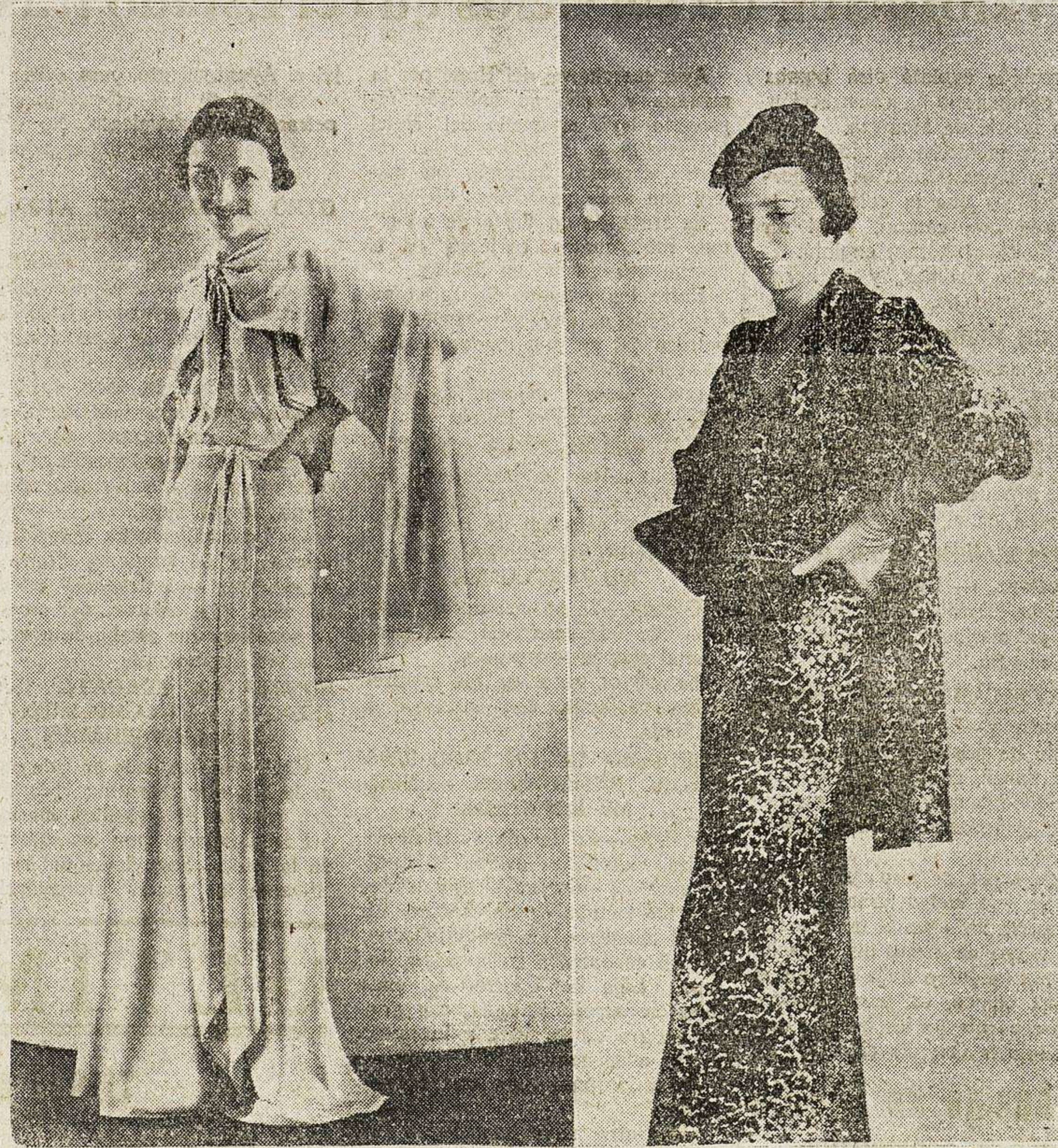
En la foto de la izquierda, una elegante deshábille en rosalba raso, de falda muy larga y muy ajustada; pequeña capa—en forma por la espalda—, suelta, que se coloca por la cabeza. En la foto de la derecha, conjunto estampado, negro y blanco; la cintura está doblada, de satén cereza; el vestido, es en biés; las mangas, anchas y muy cortas; la levita, larga y derecha, es muy sencilla. El sombrero es original de María Guy.—(Modelos de Lucien Lelong, 16, Avenue Matignon, París, Francia.)

Una exhibición de modelos de un modisto de importancia, aquí, en París, es algo muy interesante para cualquiera, a poco observador que sea. Y si la exhibición es una de las primeras que se hacen para próxima temporada, más aún, ya que es invitado a ella el público más selecto, o al menos el más interesante para el creador