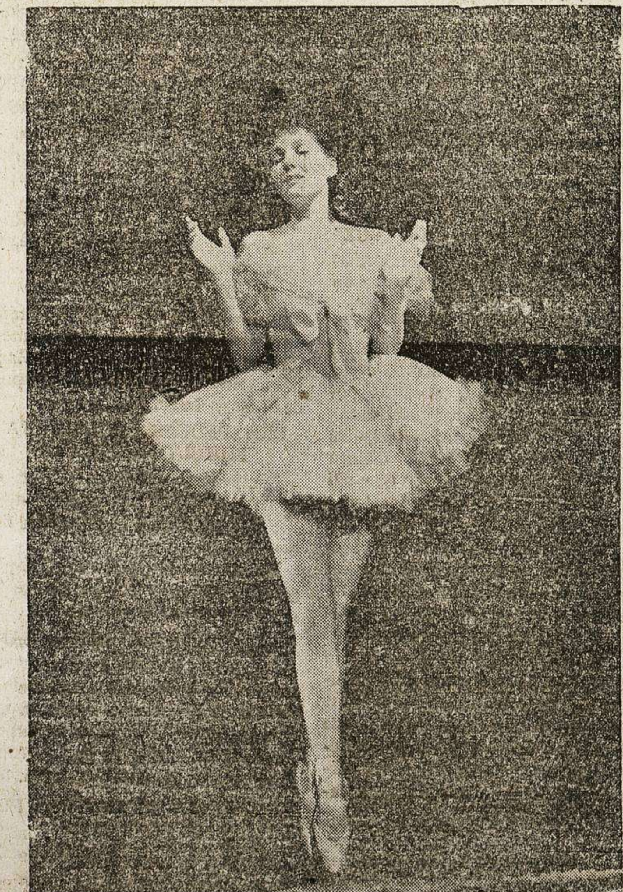
Jean Parker, está filmando actualmente una gran película, para la Metro Goldwyn, en la que hace gala de su arte como bailarina. He aquí a la artista ensayando un número de baile.

¡GRAN OPORTUNIDAD! Magnífica máquina escribir, mejor marca alemana, modelo ultramoderno, completamente nueva, desmontable, carros intercambiables, su valor 2.300 pesetas, vendo por 1.100. Cintas, papel carbón, etc., a precios interesantes. ¡Para comprar barato! Casa Montero, Rúa, número 26. PRENSA CUEVAS Madrid, 1933.