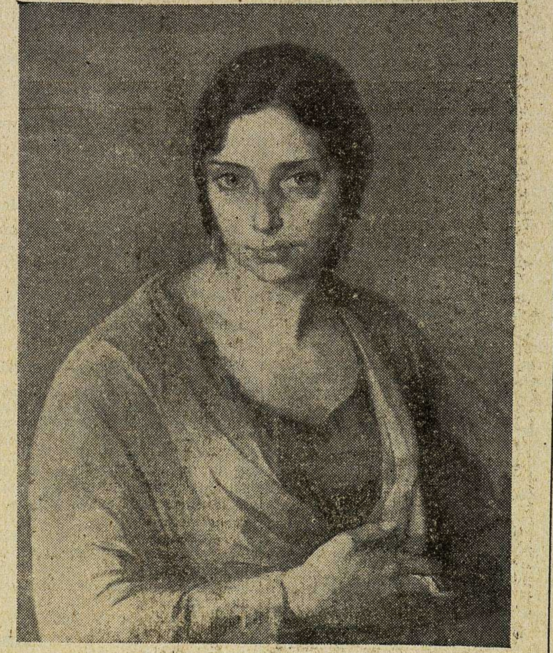
Uno de los cuadros del gran pintor Julio Moisés.

Del número, no muy crecido, de jóvenes maestros en el arte de la pintura que lograron sólido prestigio imponiendo en su obra inconfundible recia personalidad, destacamos al ilustre pintor don Julio Moisés, con quien hemos tenido una charla para nuestros lectores. Su obra es sobradamente cono-