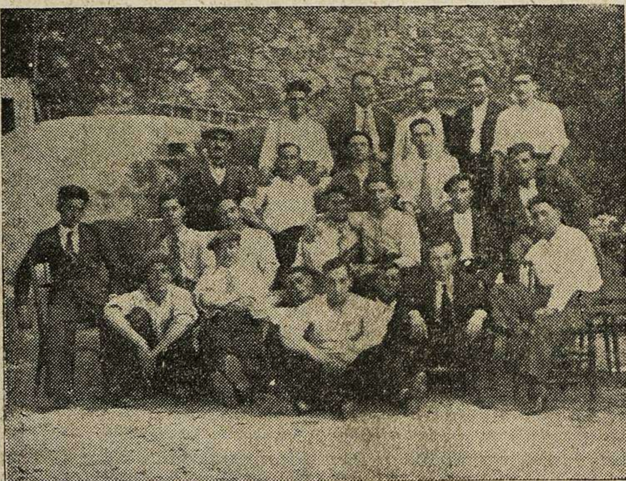
Un grupo de conductores que la celebran.