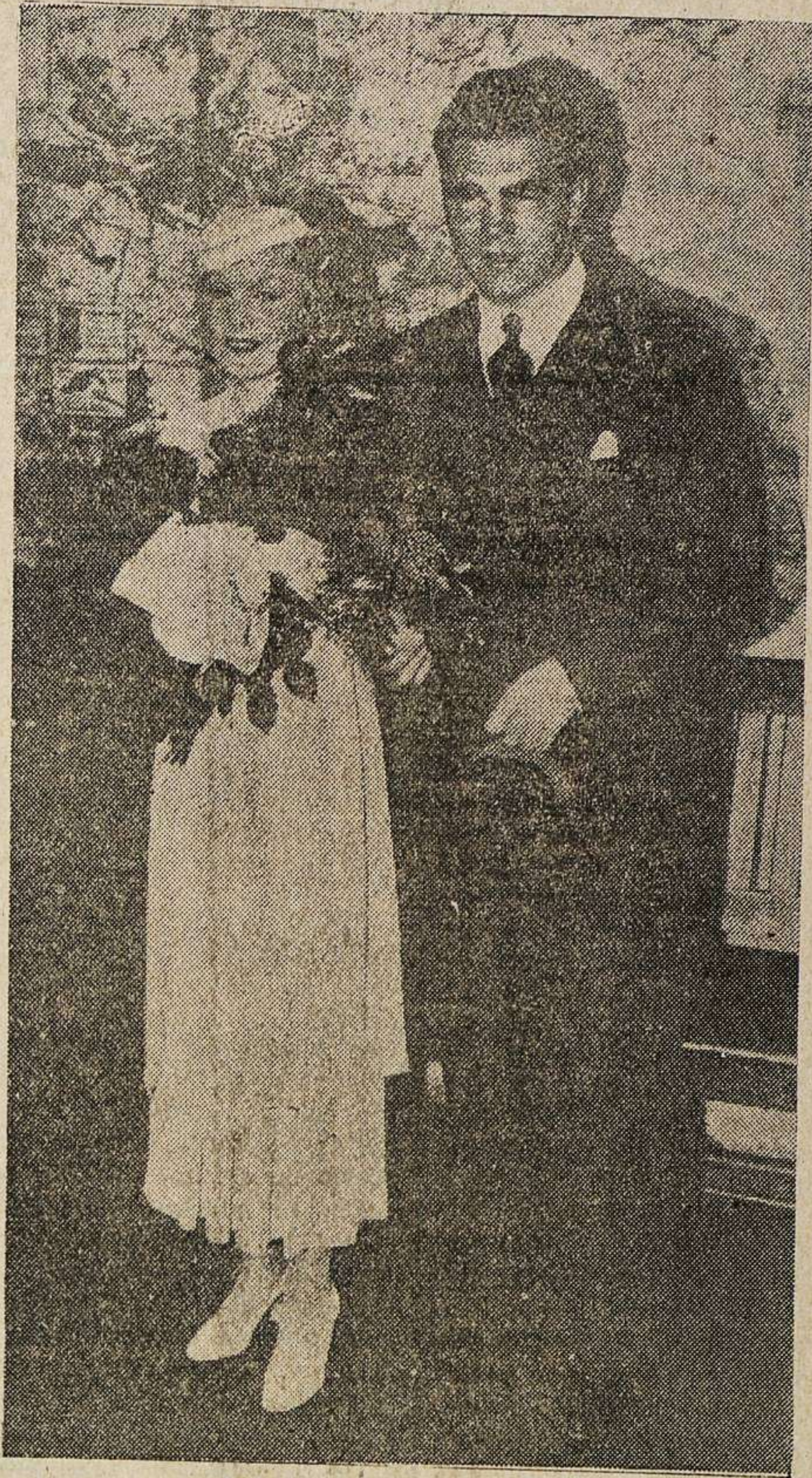
He aquí al ex campeón mundial de boxeo Max Schemelling, que acaba de contraer matrimonio con la estrella de cine Anny Ondra