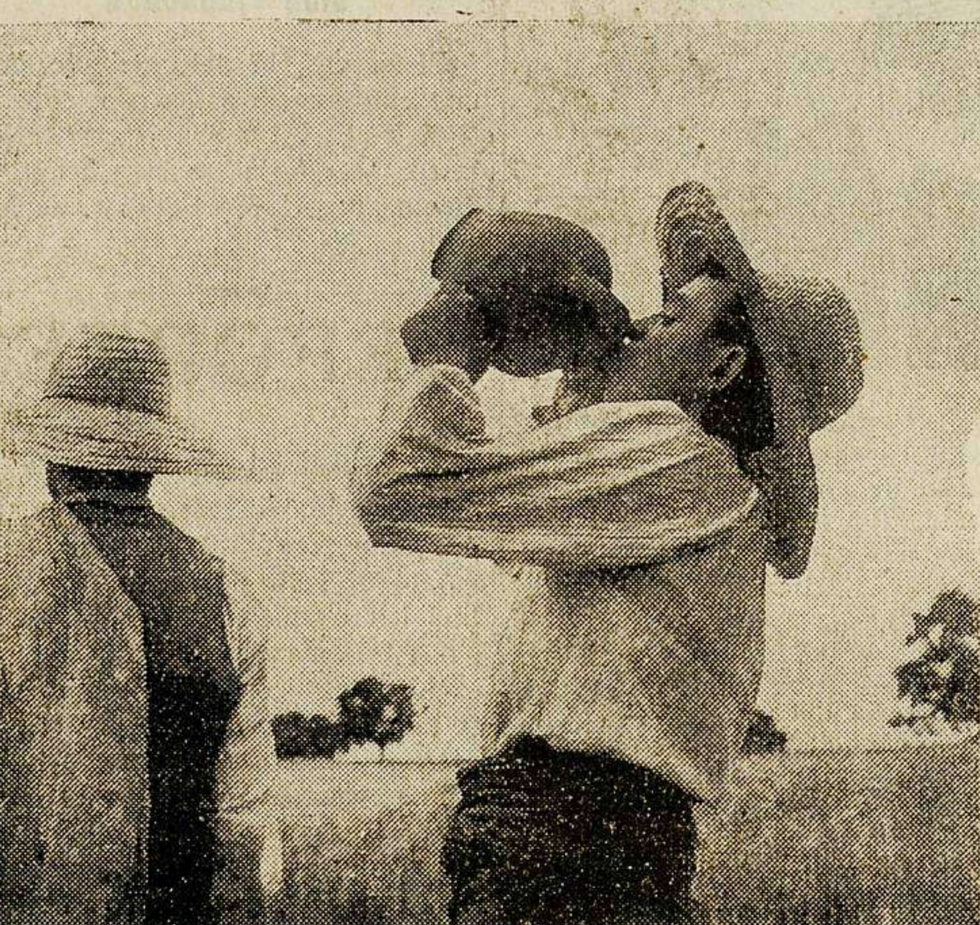
que creen que la fotografía es una diversión de muchachos o de turistas; el monumento que ha sido reproducido por millares en las tarjetas postales que venden en los estancos, o el grupito familiar "vacaciones sin Kodak son vacaciones perdidas", según un reclamo conocido—que sirva de recuerdo de una excursión, de un momento de expansión o de júbilo. Una máquina es el regalo del padre al aprobarse el segundo año del bachillerato. Ni cuando estas cartulinas, según hemos oído decir en tono de elogio a un visitante. Son algo más y un poquito menos: son vida palpitante, aún a de las piedras que posan inconcientemente ante el objetivo. Y más todavía las de personas, plantas y animales reproducidos con especial cuidado, con una clara intención de captar, no ya figuras como en los "cuadros", sino psicología, movimiento y vida, como en el cine. Hay un grupo de fotografías de

Se descubre en esta exposición una tendencia laudable. No son ya los monumentos, ni aun los paisajes, ni las personas siquiera. Son las cosas. Cosas humildes y sencillas, aparentemente insignificantes; pero que el objetivo revela con un interés extraordinario y desconocido. Es el espíritu de las pequeñas cosas; los matices teatrales y fotográficos posibles el que se nos descubre. Las actitu-