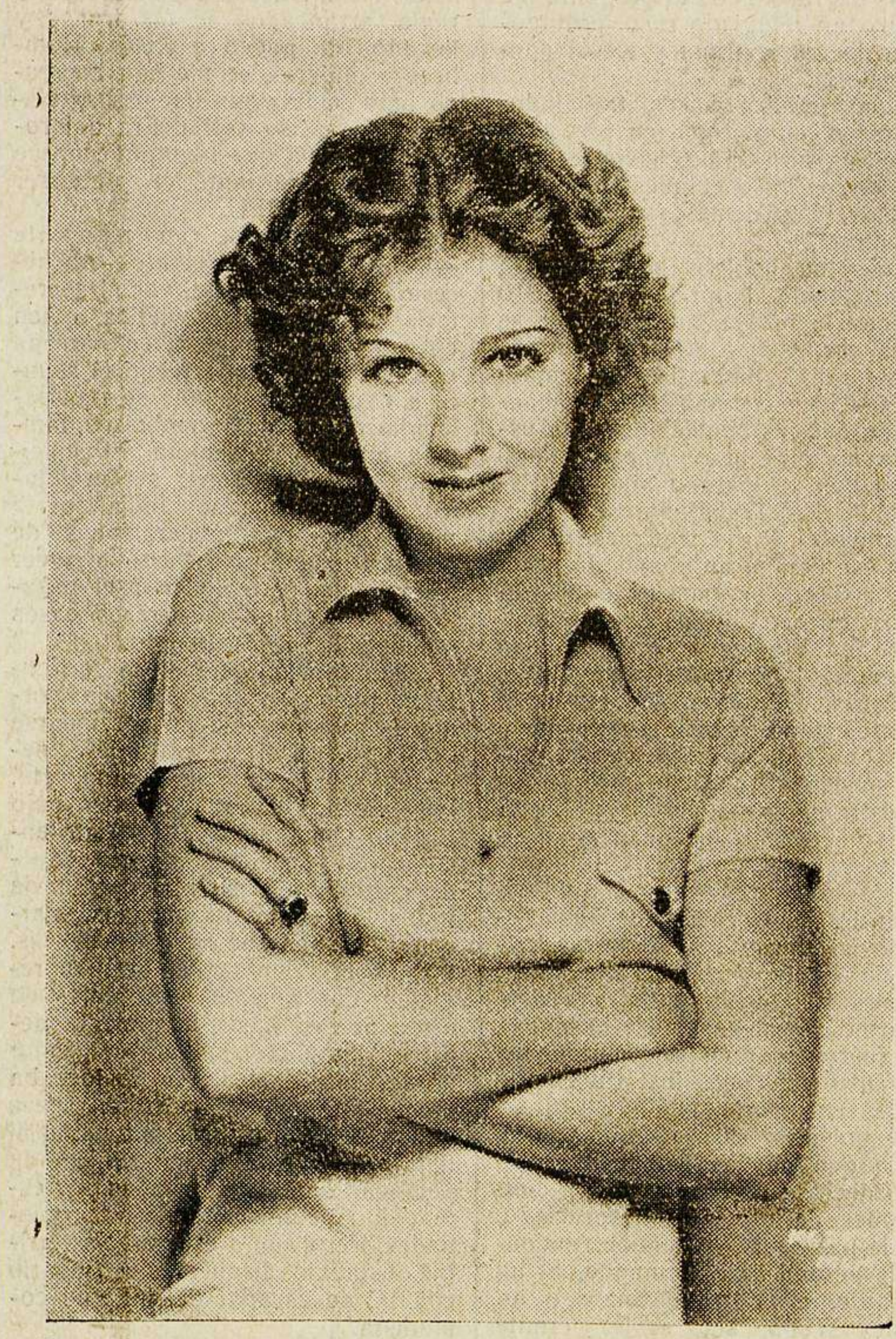
Jean Parker, adorable ingenua de la Metro-Goldwyn Mayer