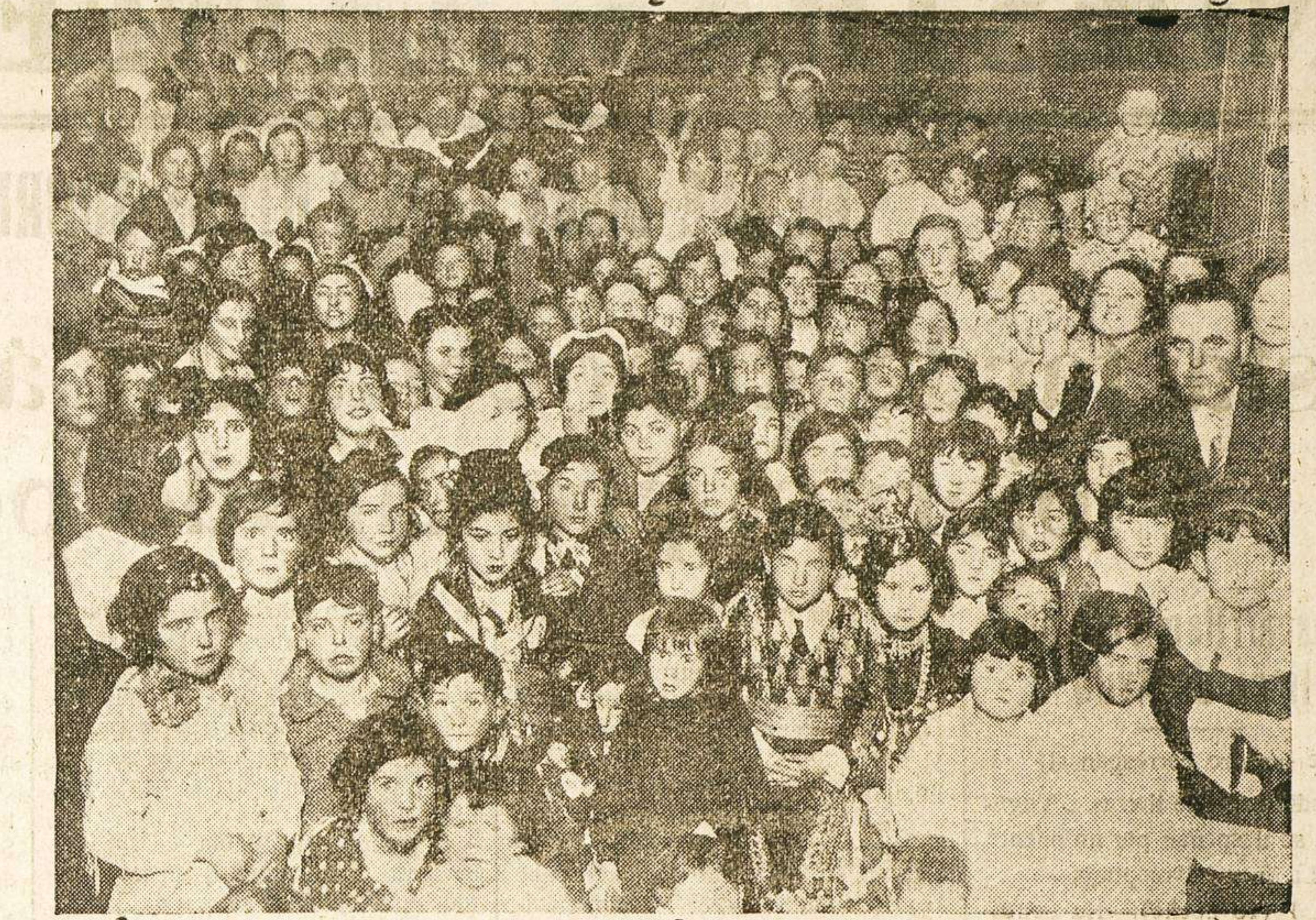
Grupo de asistentes al baile infantil celebrado estos Carnavales en el Casino Romántico.

Parte integrante de la higiene tropical, junto a la lucha contra los bacilos, es la destrucción de los insectos comunicadores: mosquitos, garrapatas, moscas, piojos, pulgas, etcétera.