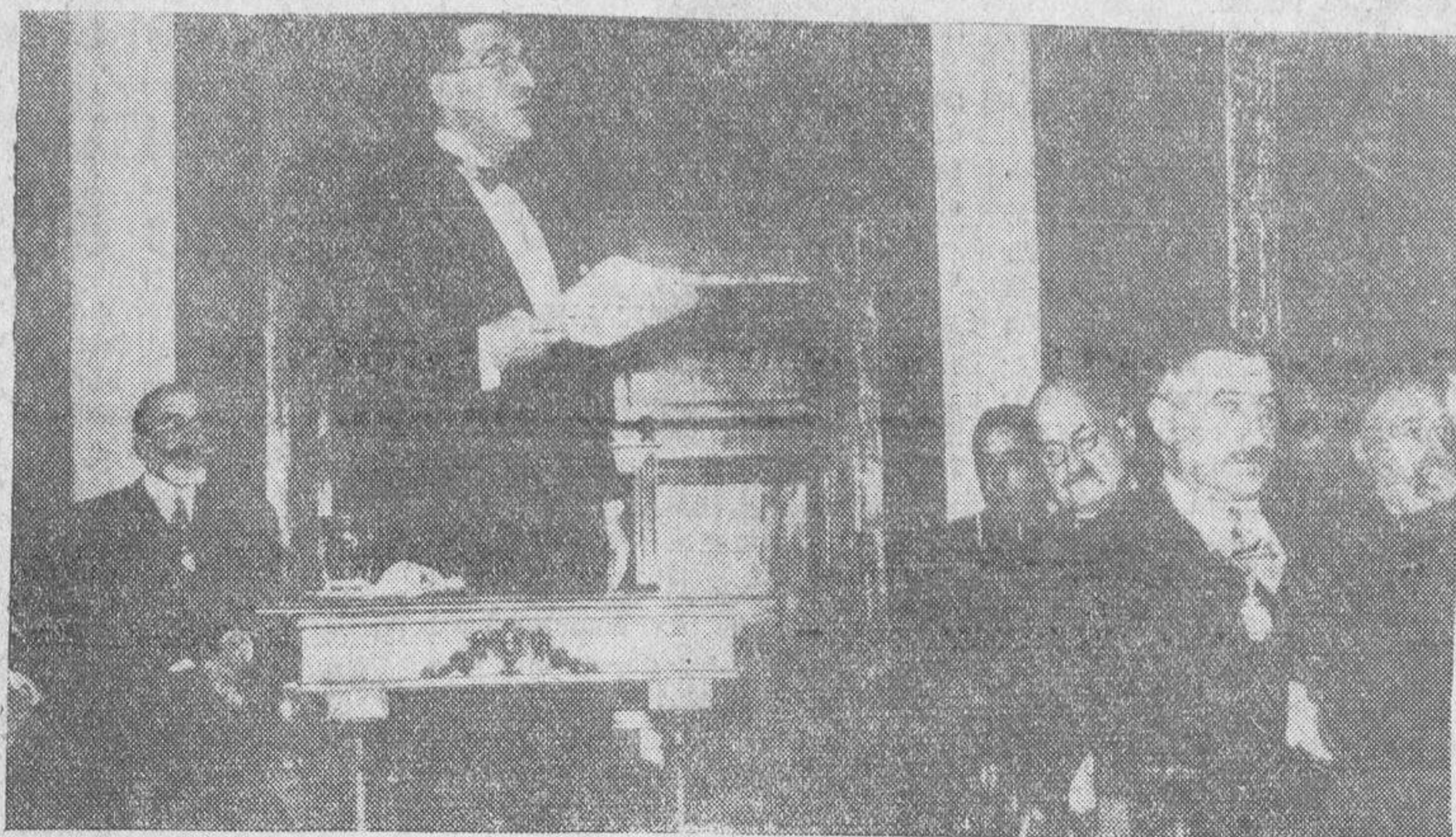
El doctor don Gregorio Marañón leyendo su discurso de ingreso en la Academia de la Historia en la solemne sesión que ésta celebró el domingo pasado

idealismo comete ese hombre, por haber roto una disciplina contraria a su modo de ver, unos problemas que nunca han dejado de preocuparle? Separarse de una táctica no es abjurar una doctrina sino abrir nuevos cauces a su realización?