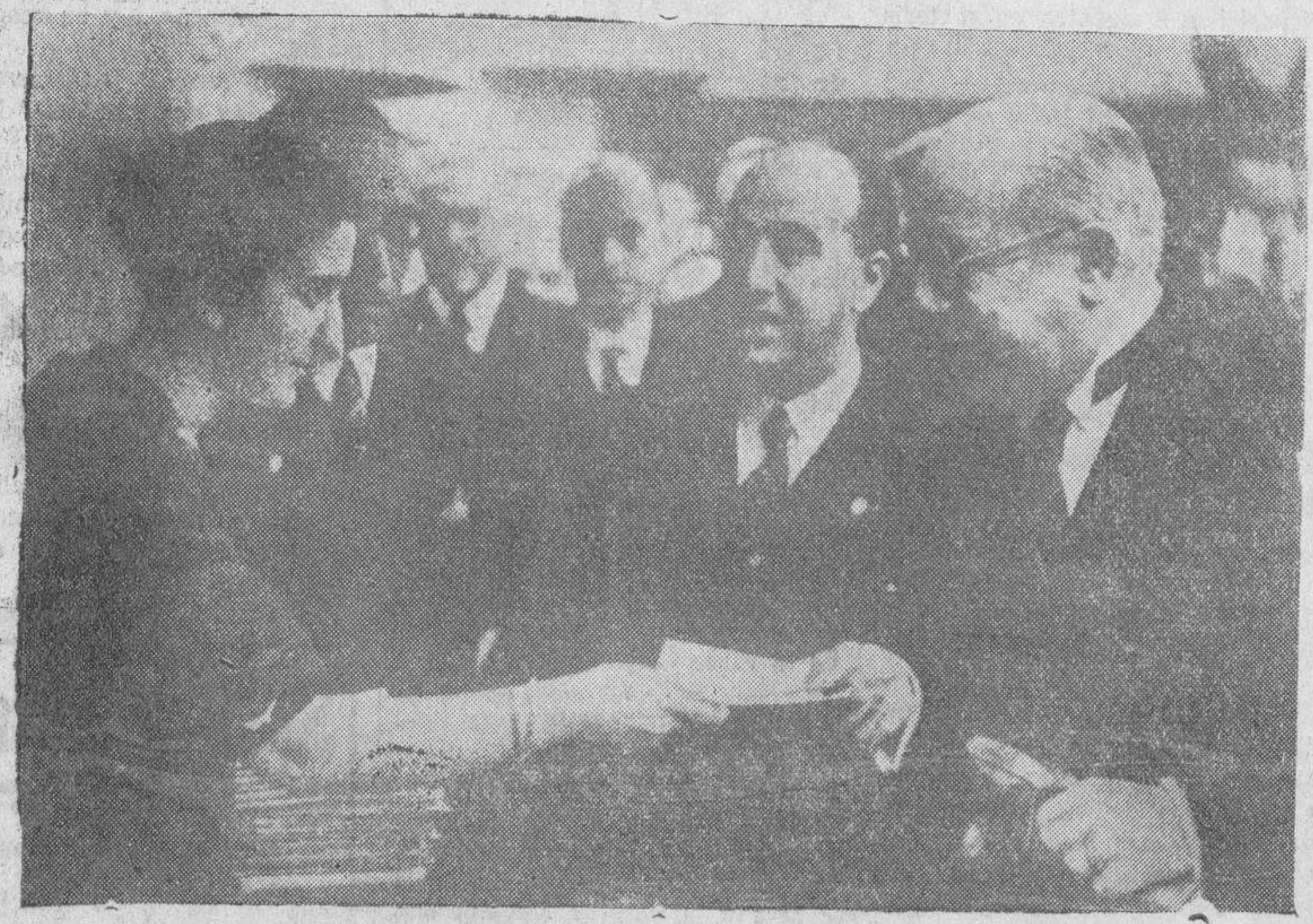
El domingo último se inauguró en Madrid la Feria del Libro. Al acto asistió S. E. el Presidente de la República, que aparece en la fotografía recibiendo de una señorita el catálogo de un «stand»