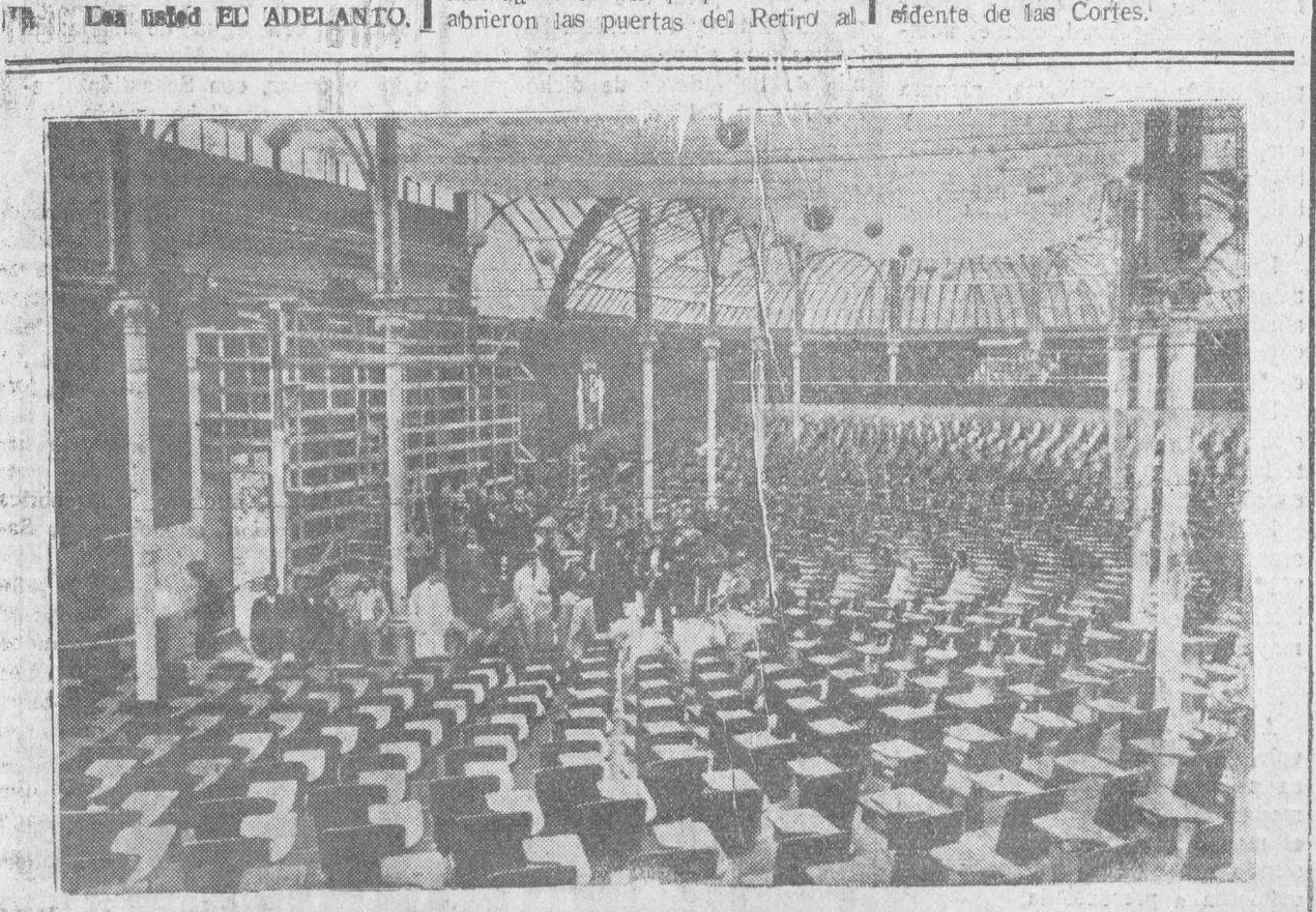
Vista general del salón del Palacio de Cristal, de Madrid, donde hoy tendrá lugar la reunión de diputados y compromisarios para la elección de Presidente de la República