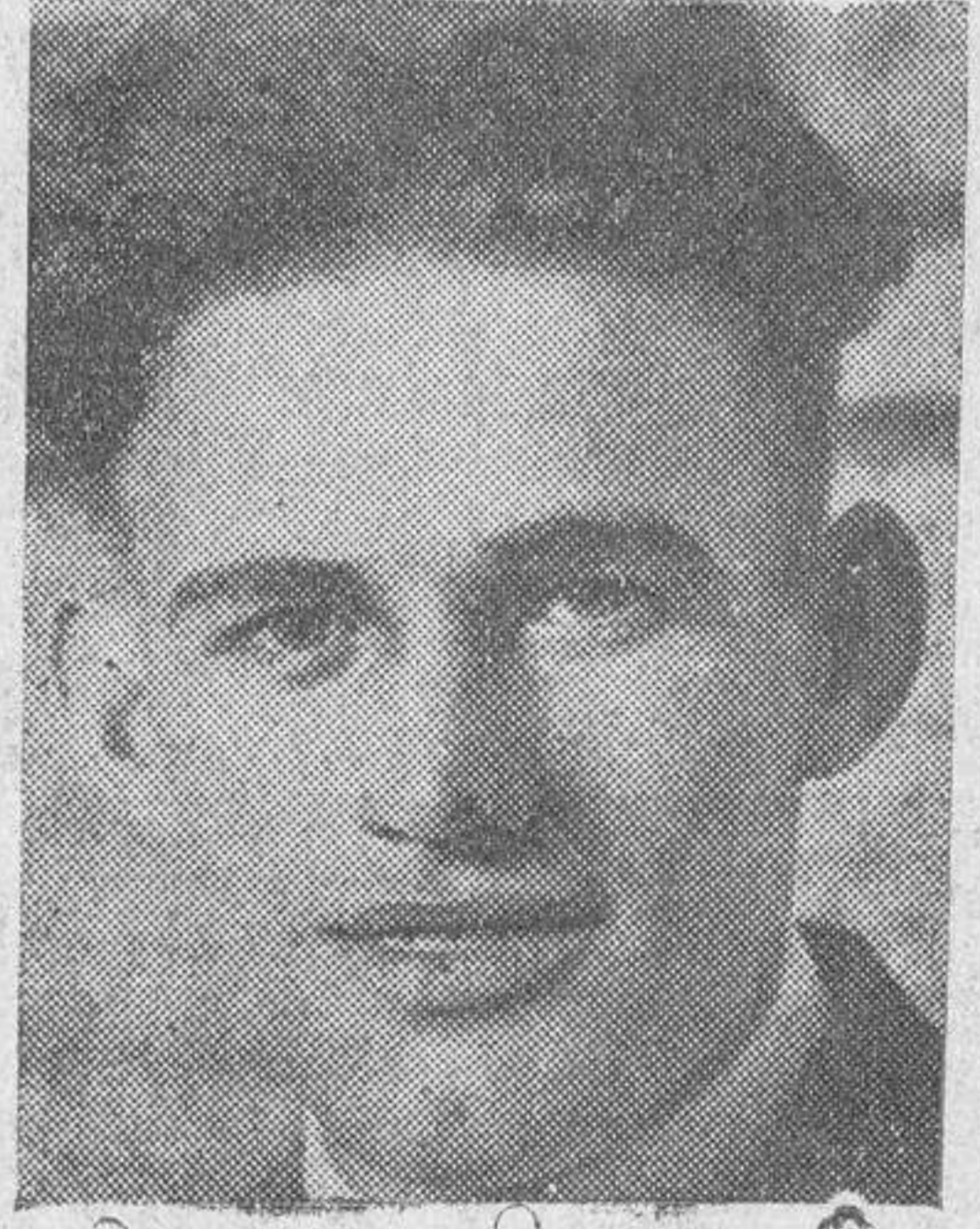
El belga Gustavo Deloor, ganador de la I Vuelta a España, que va camino de serlo en la que corre actualmente

Poco después de emprendida la marcha, el gallego Sánchez se re-