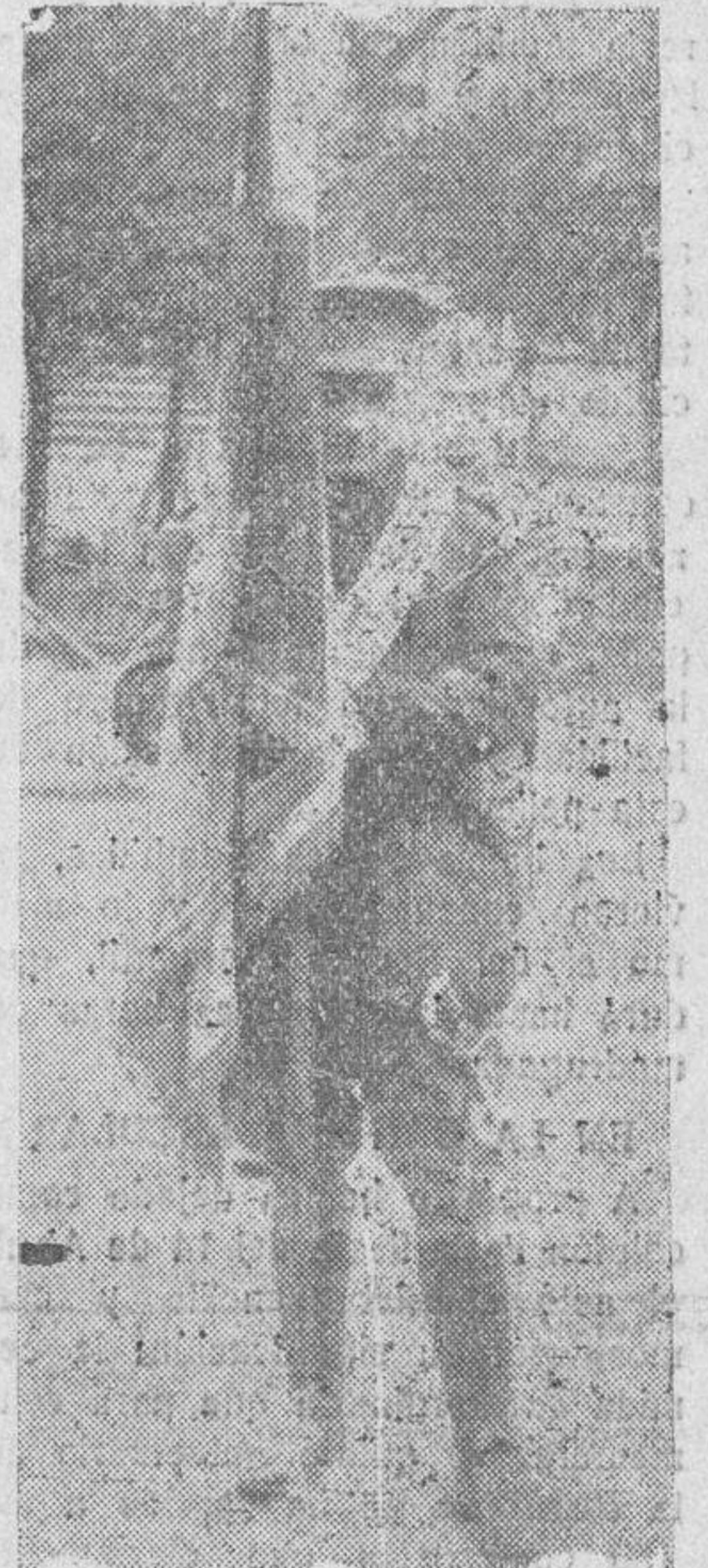
La bandera del Regimiento de Infantería de esta plaza