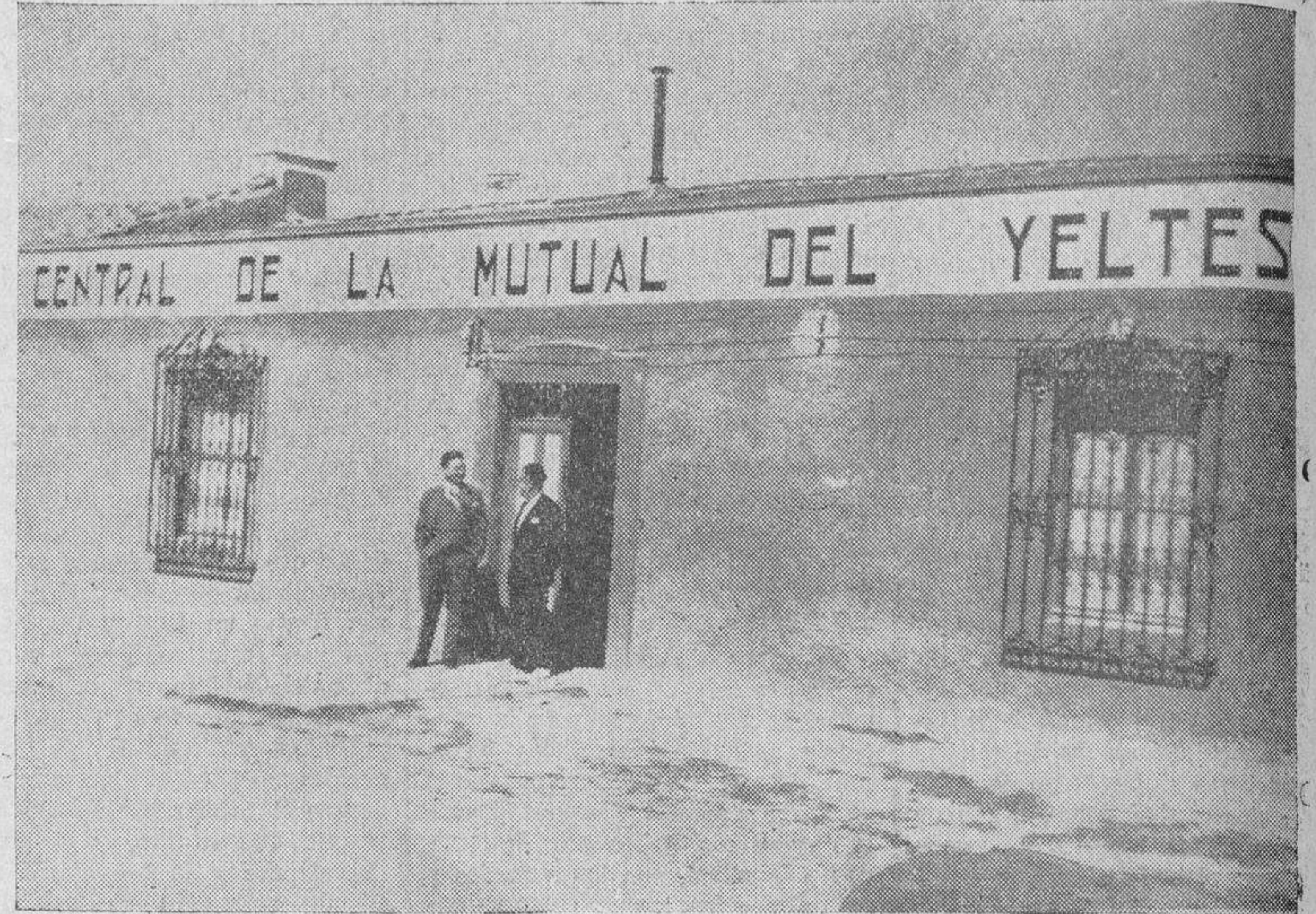
El edificio de la Central Mutual del Yeltes, a que aludió el señor Prada en su conferencia

Pasó luego a tratar de las enfermedades mentales y de la inspección médico-escolar y de los servicios prestados por los distritos, centros, e igualmente los trabajos efectuados para corregirlos, deteniéndose especialmente en la