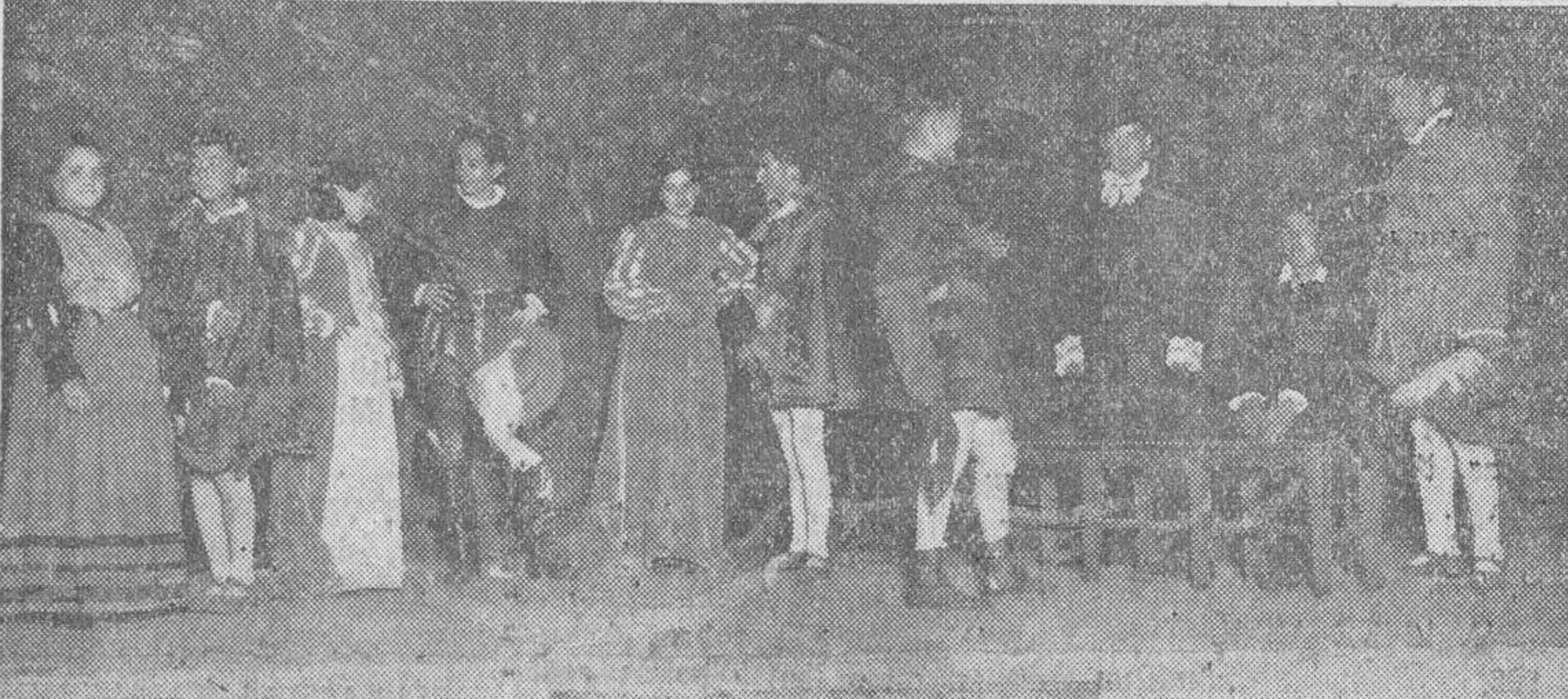
Arriba: Los intérpretes del «Romance de la loba Parda». — Abajo: Un momento de «El juez de los divorcios»

El teatro estaba totalmente ocupado. En palcos y plateas vimos al gobernador civil, señor Cepas López; nutridas representaciones del Ayuntamiento, Diputación provincial, Ejército, Universidad, Instituto, Normal de Maestros, Escuela de Comercio, Escuela de Trabajo y partidos políticos.