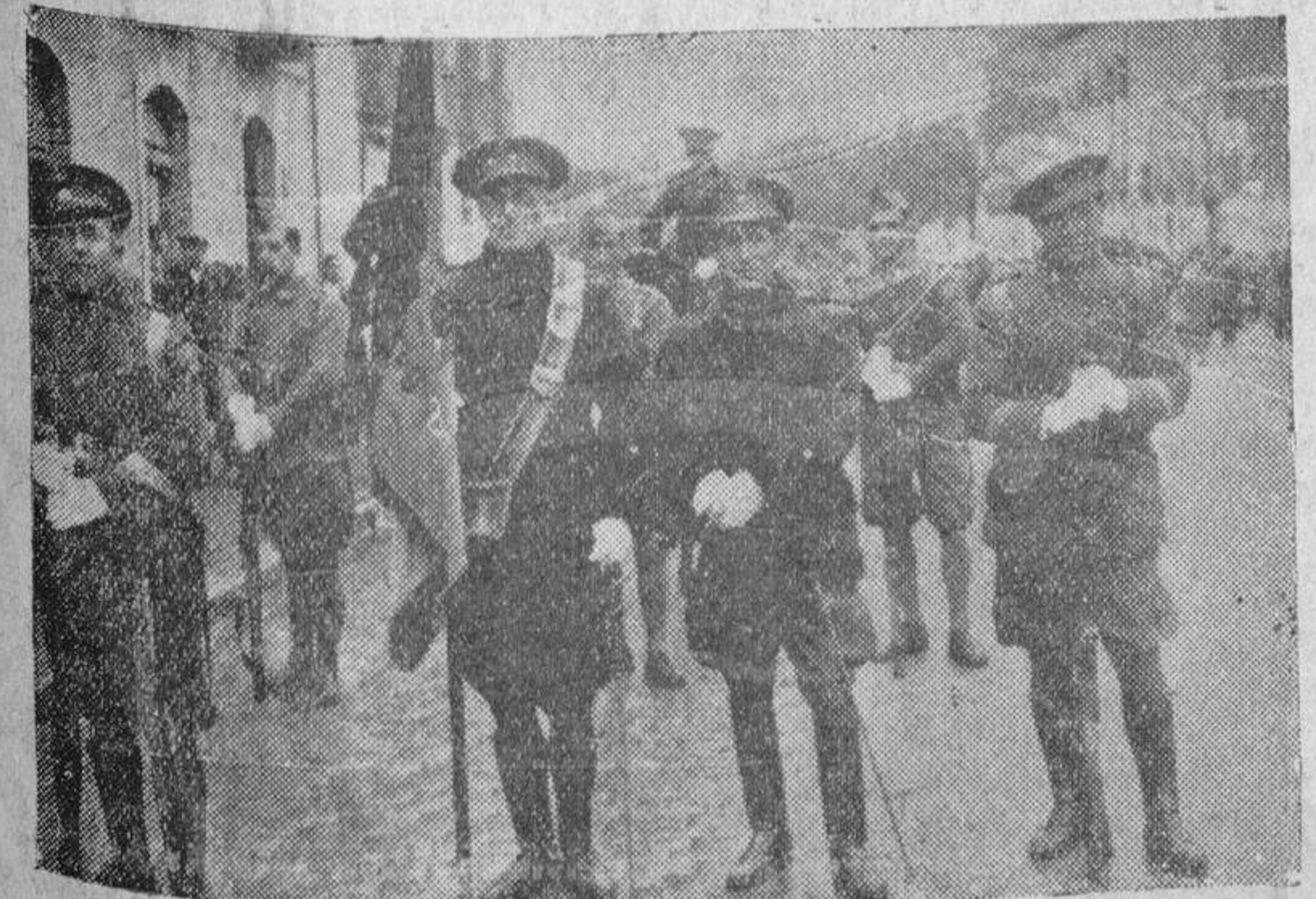
La bandera del regimiento de Ingenieros, de Salamanca

Toda la correspondencia de EL ADELANTO, se dirigirá al Apartado de Correos núm. 10