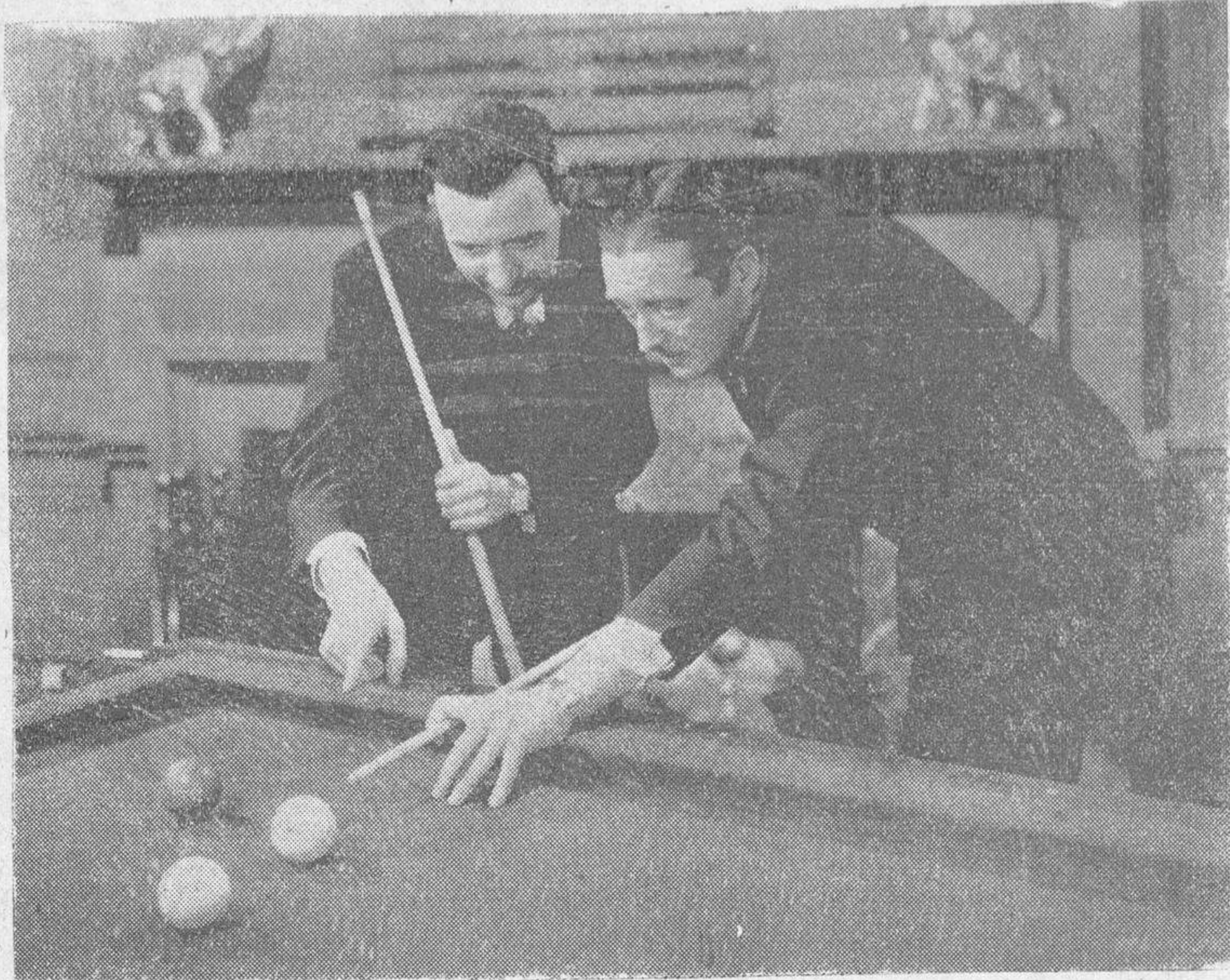
Edmund Lowe recibe lecciones de billar de Gus Copuls, campeón mundial de tres bandas, para una escena de su próximo film

"Una noche en la ópera" es el último film interpretado por los hermanos Marx para la Metro Goldwyn Mayer.