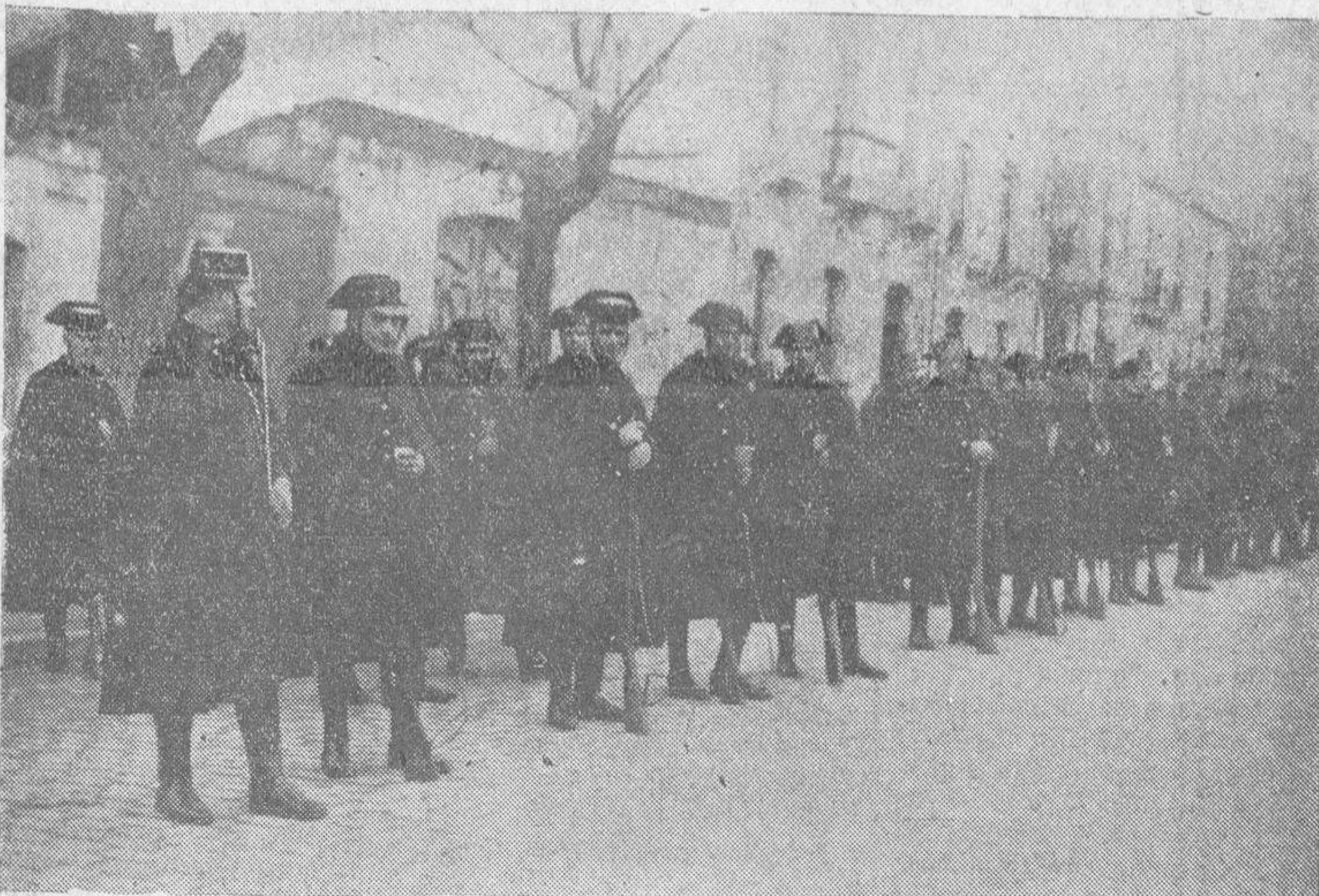
La Guardia Civil formando en la Plaza de la República, antes de la distribución, para señalar los lugares que han de ocupar hoy, para el mantenimiento del orden público