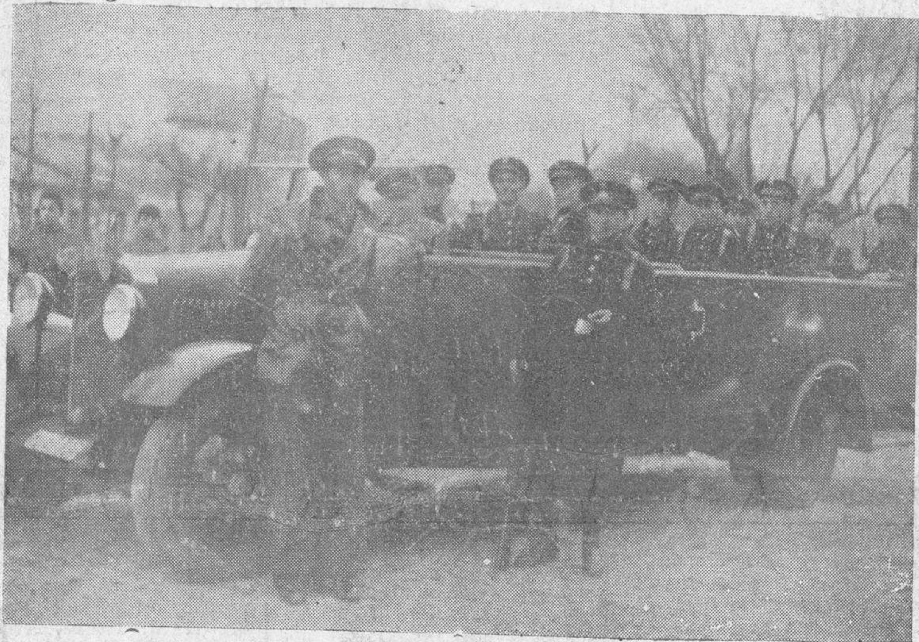
Un camión de guardias de Asalto, en la formación de ayer tarde