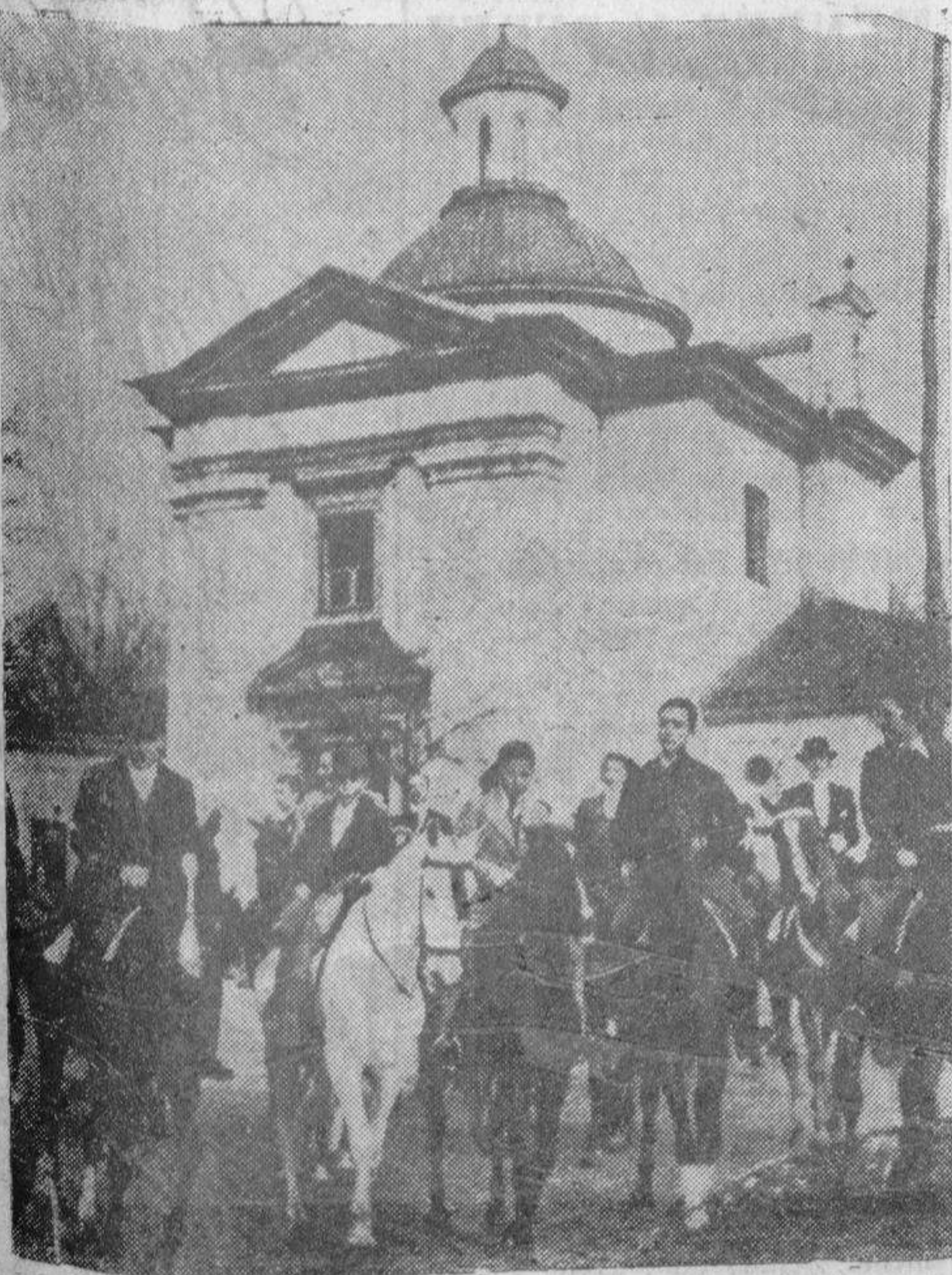
La tradicional fiesta de San Antón, que desde hace años se muestra en franca decadencia, ha tenido en este un principio de resurgimiento merced a la iniciativa del Club Hípico Madrileño de formar una nutrida caravana, que acudió a la ermita de San Antonio de la Florida