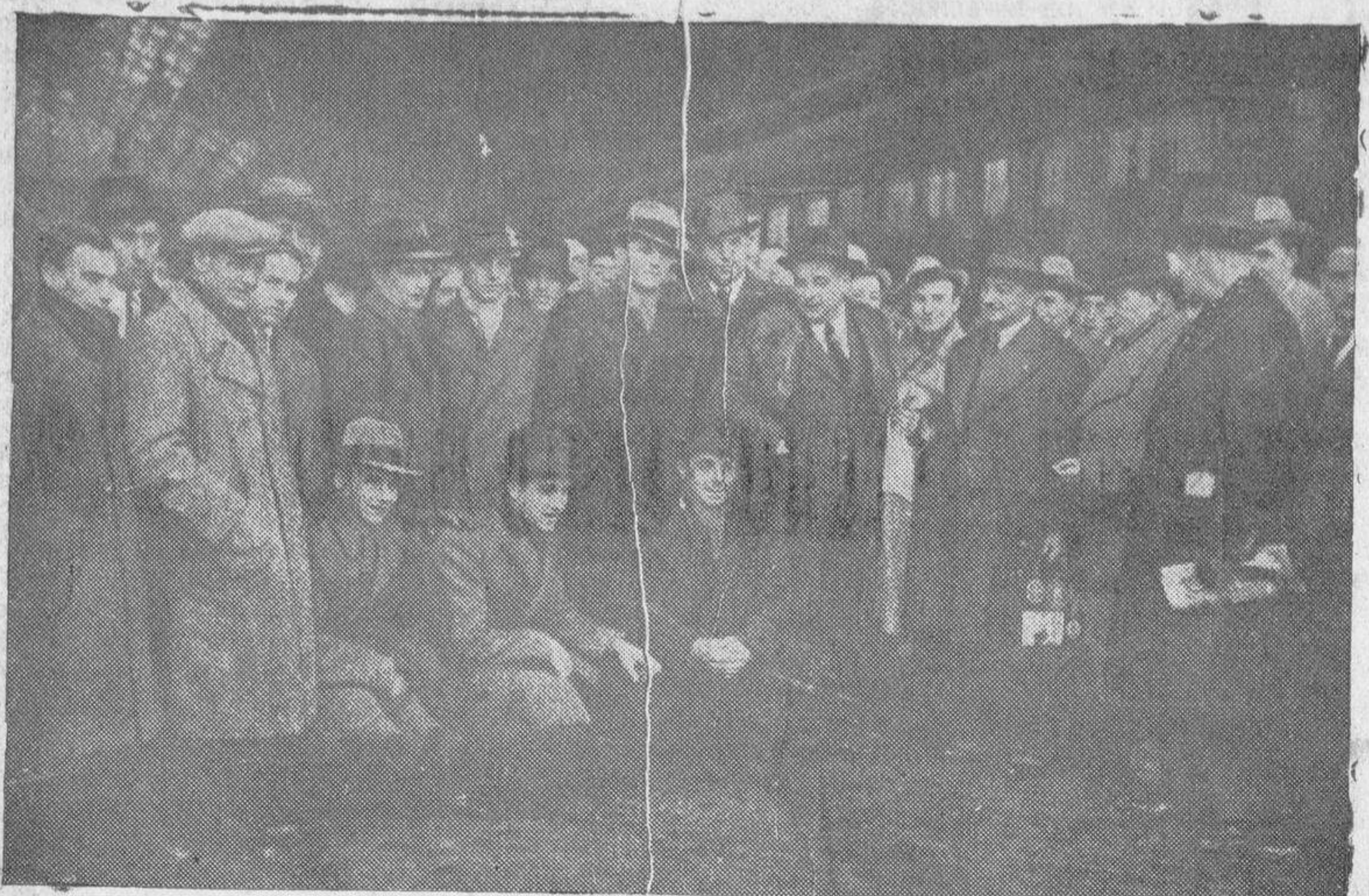
Los jugadores que componen la selección austriaca, que jugarán hoy con el equipo nacional de España, a su llegada a Madrid, donde fueron recibidos por una nutrida representación de entidades deportivas