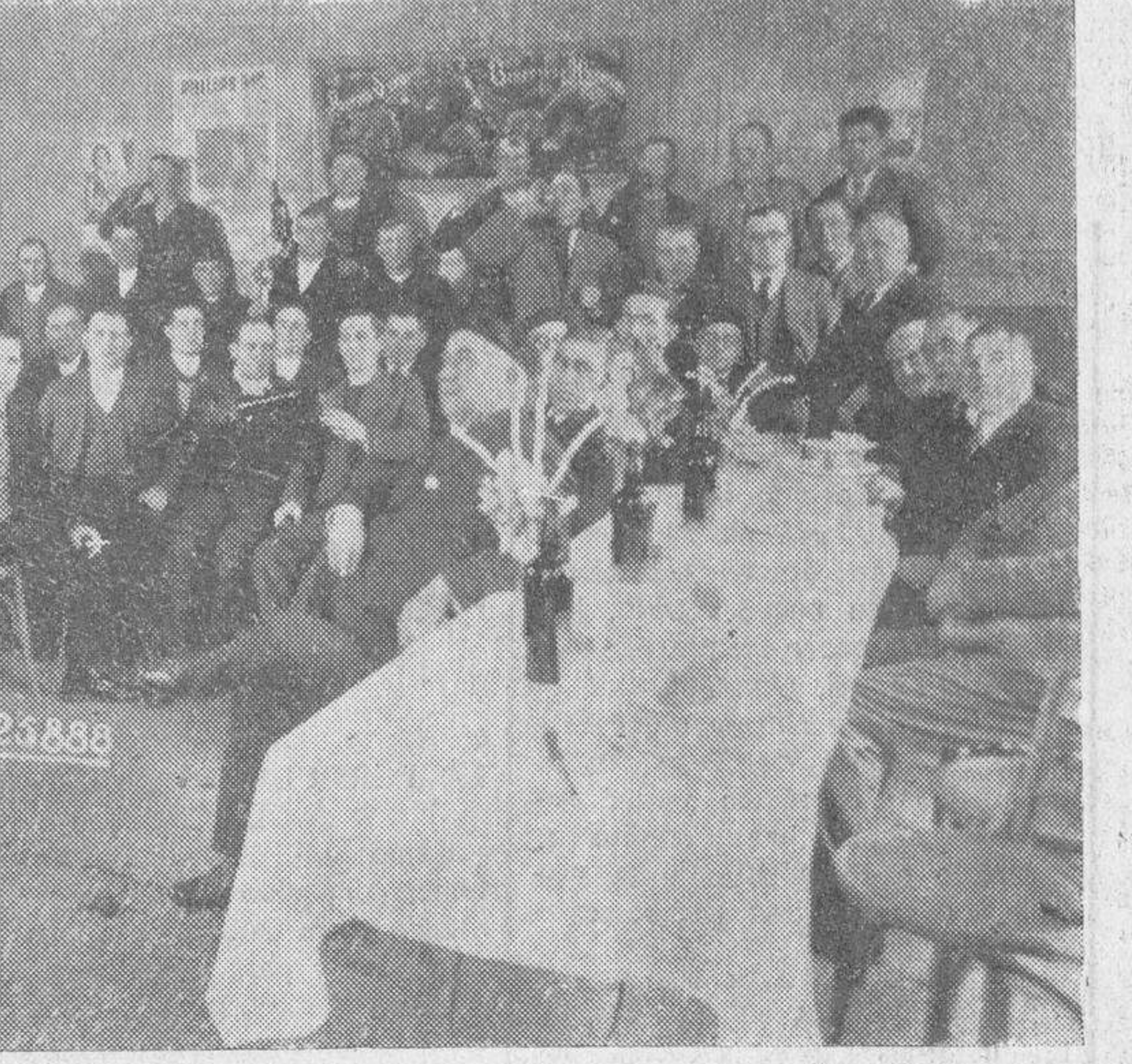
Grupo de asistentes al banquete