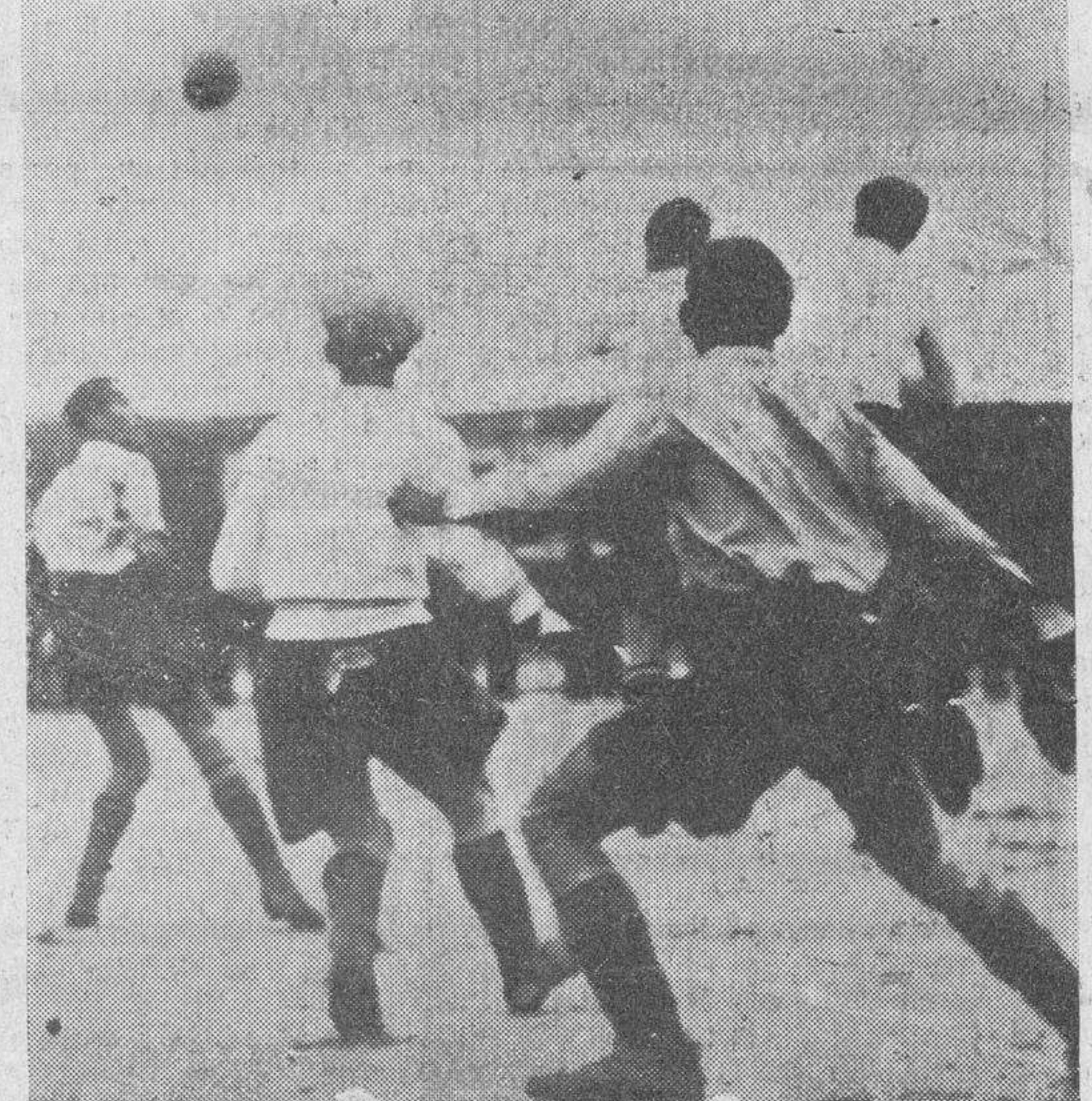
Un momento del acoso salmantino en la meta del Vallecano.

El árbitro sigue mostrando parcialidad o desconocimiento; a Perete, entre dos, se cogen en prensa en el área, no lo pita, pero Perete mete, el pie, tira y un jugador detiene con las dos ma-