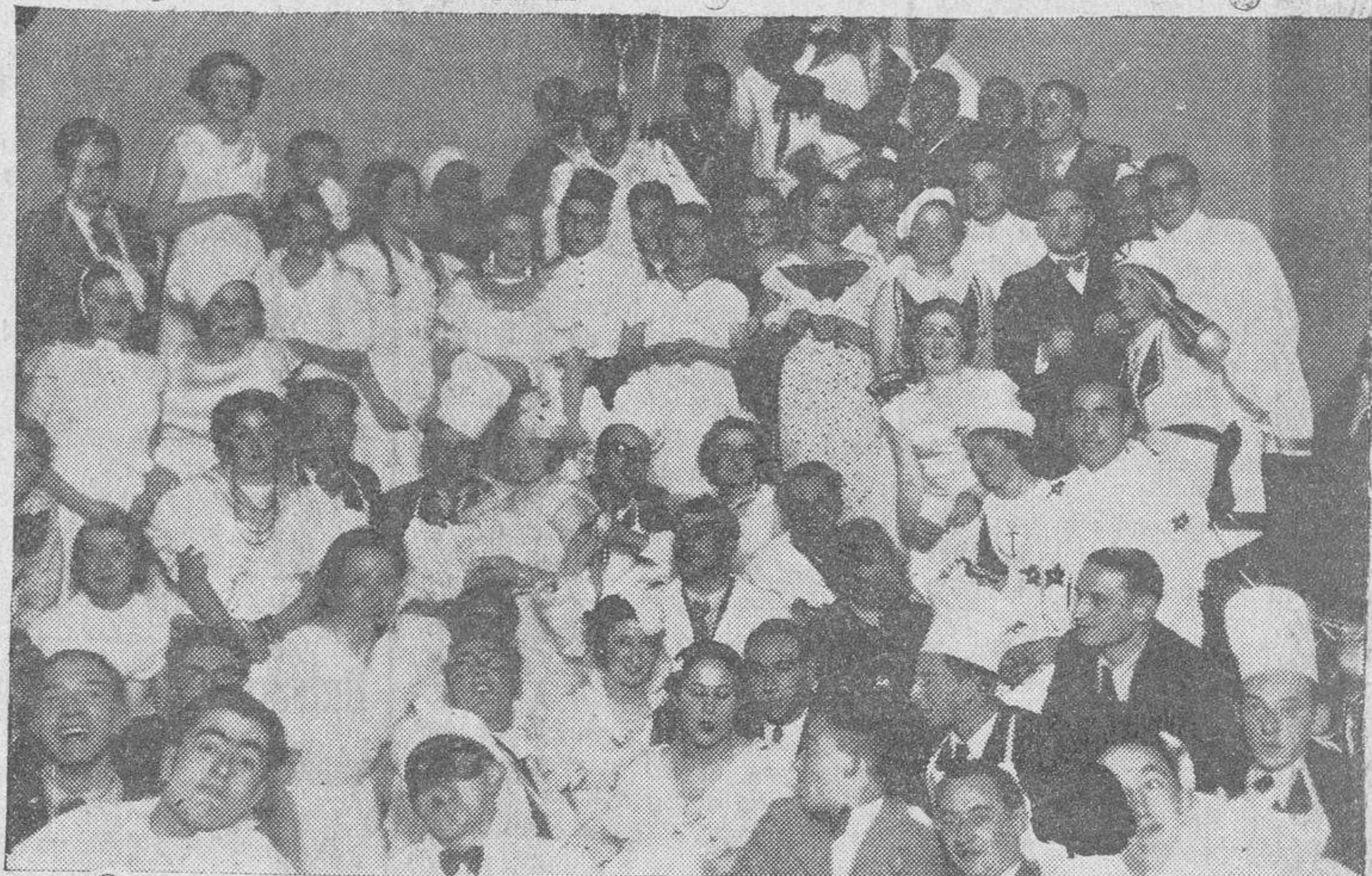
Grupo de concurrentes al «Baile blanco», celebrado en los salones del Hotel del Castillo de Trastámara