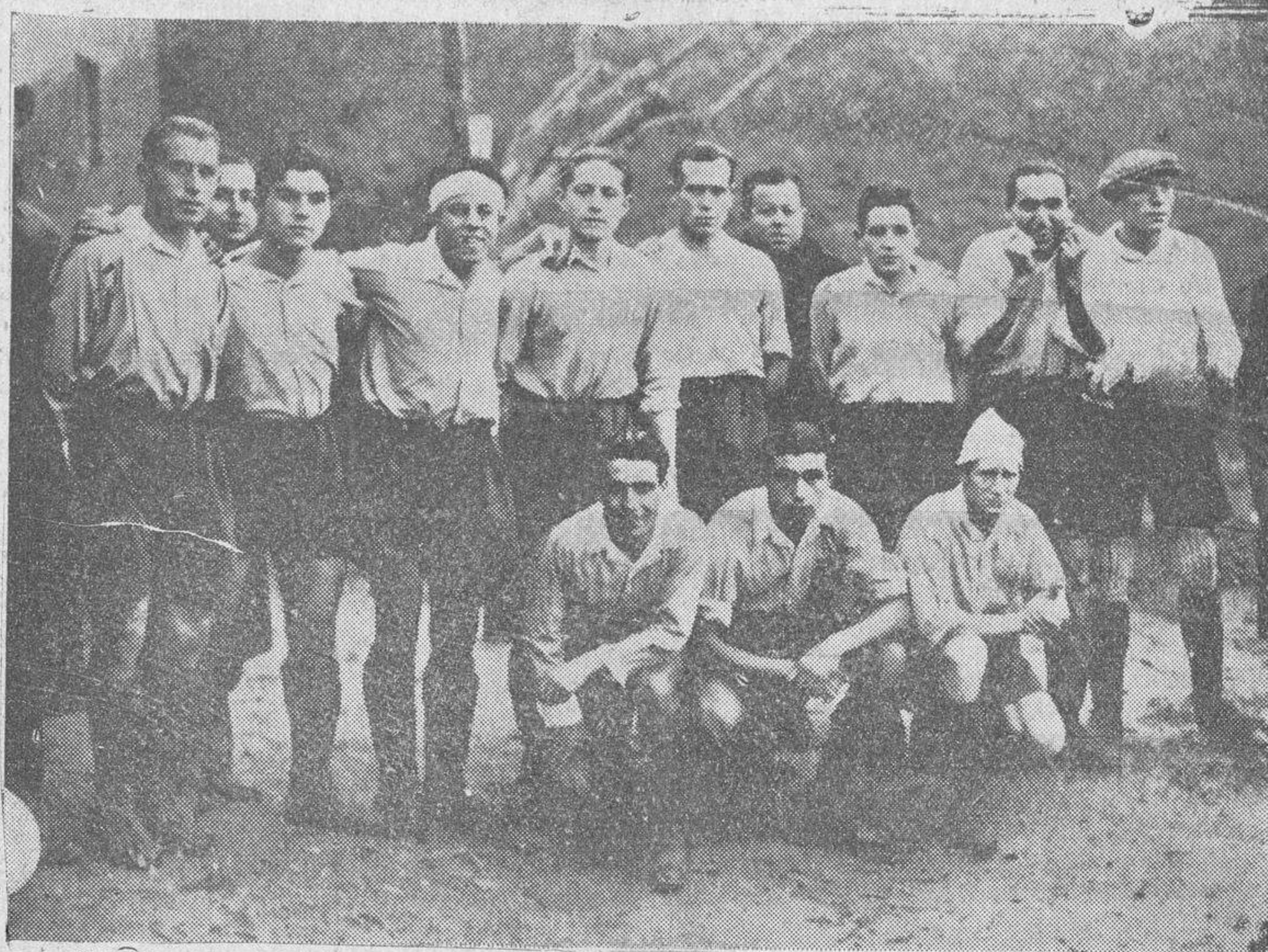
El equipo del Sporting Vallecano, que fué derrotado ampliamente por la U. D. Salamanca.

Oréjón, Parra, Argumosa, Cano, Espinosa y al Salamanca: Joven Solas, Pepín Lolín, Jimeno, Pedrín Muñiz, Gil Cacho, Sánchez Perete, Leal