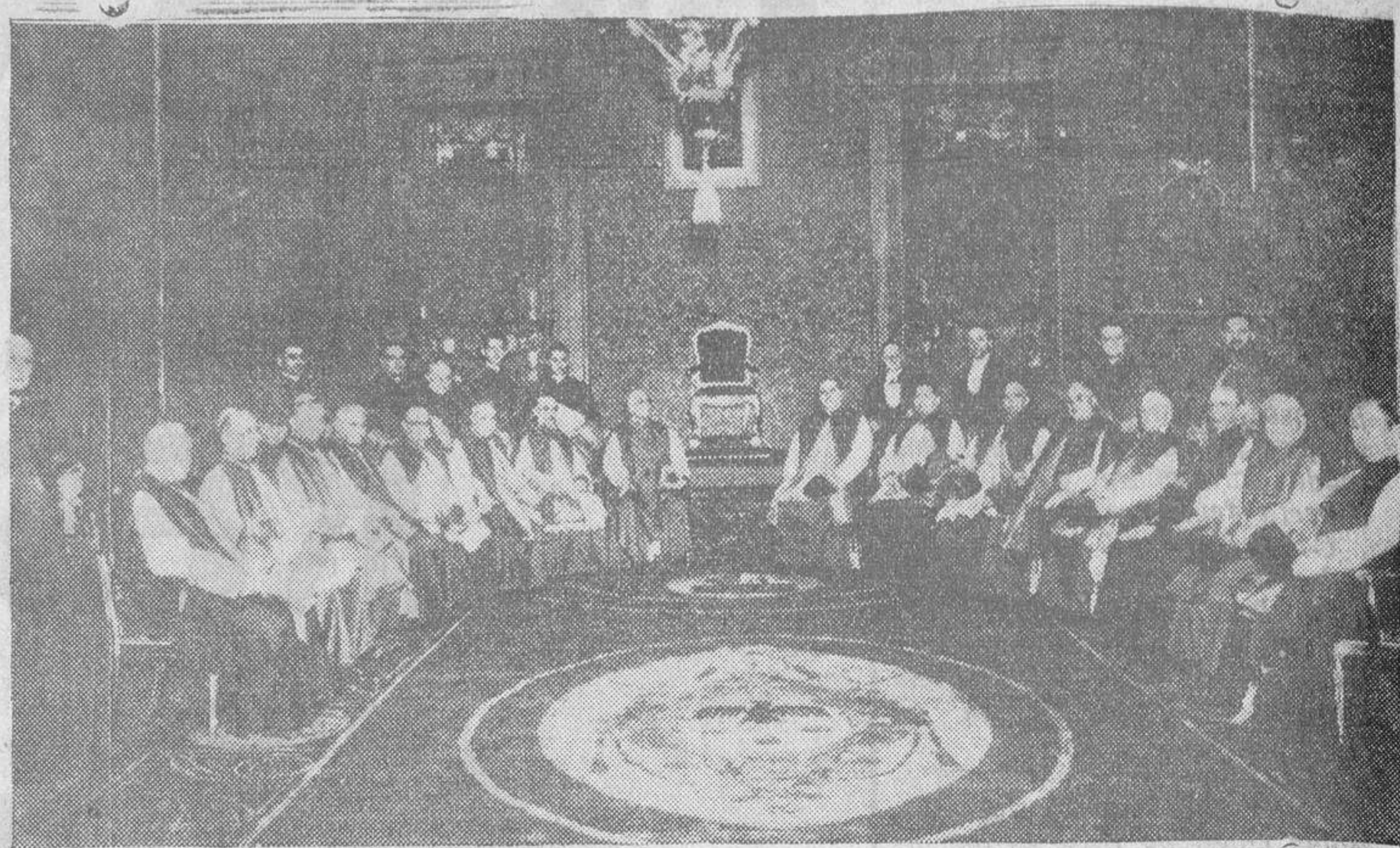
Los dieciséis Prelados que se trasladaron a Roma, esperando, en la sala Matilde del Vaticano, que el Pontífice les impusiera los birretes cardenalicos