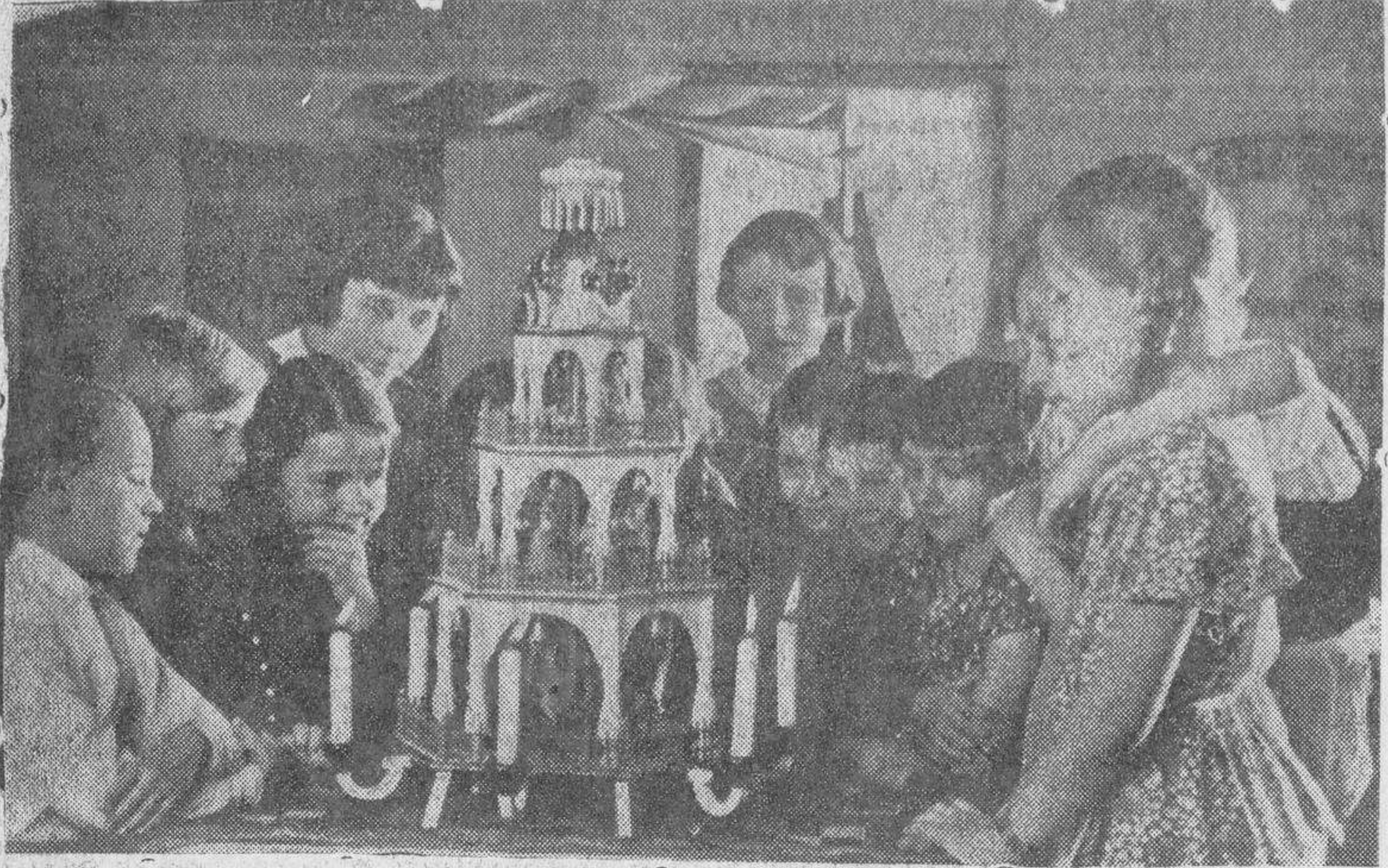
En muchos lugares de Alemania, una pirámide que hace el encanto de la chiquillería, sustituye el árbol de Navidad