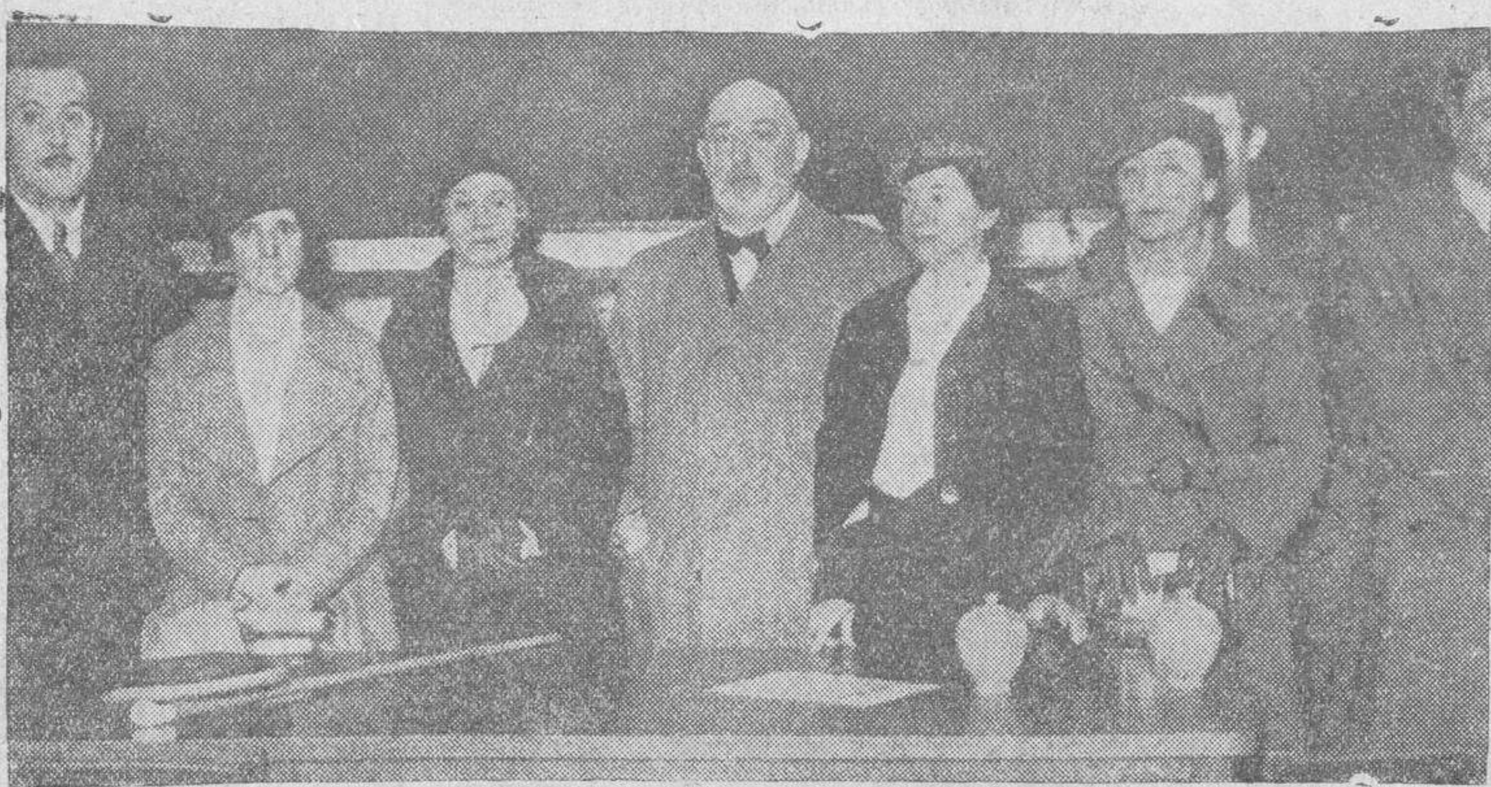
Organizado por la Asociación Auxiliar del Niño, de Madrid, tuvo lugar un acto público, con intervención de ilustres oradores, entre los que figuró don Angel Ossorio Gallardo, que aparece en la foto con los demás participantes en el acto