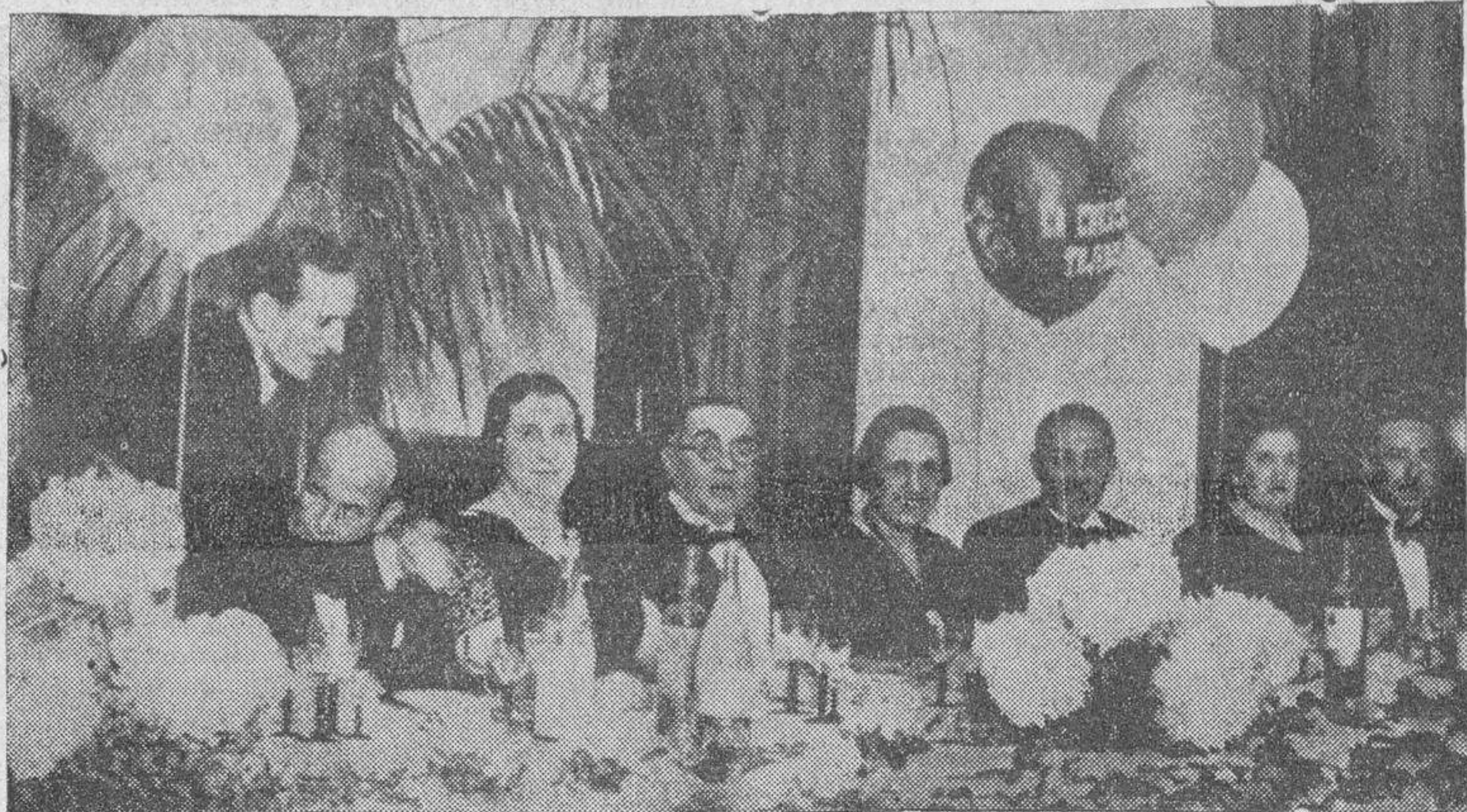
El general Villegas y su esposa han sido objeto de un homenaje en Zaragoza. He aquí la presidencia del banquete con que ambos fueron obsequiados