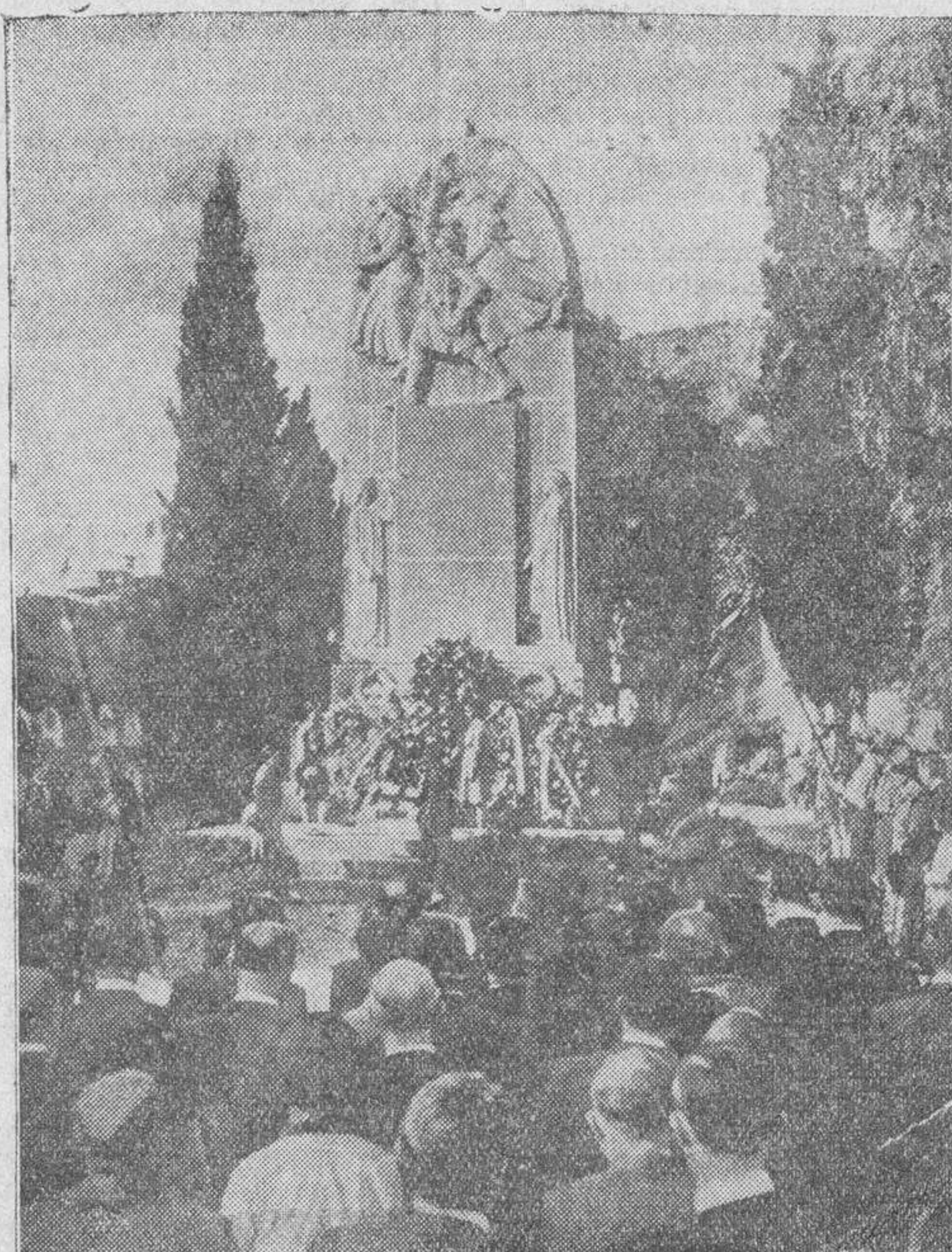
Para conmemorar la fecha del armisticio, se han celebrado diversos actos por los miembros de las colonias de los países beligerantes. En el cementerio de Barcelona se colocaron numerosas coronas de flores en el monumento erigido a la memoria de los muertos por Francia, franceses y españoles, los últimos soldados voluntarios