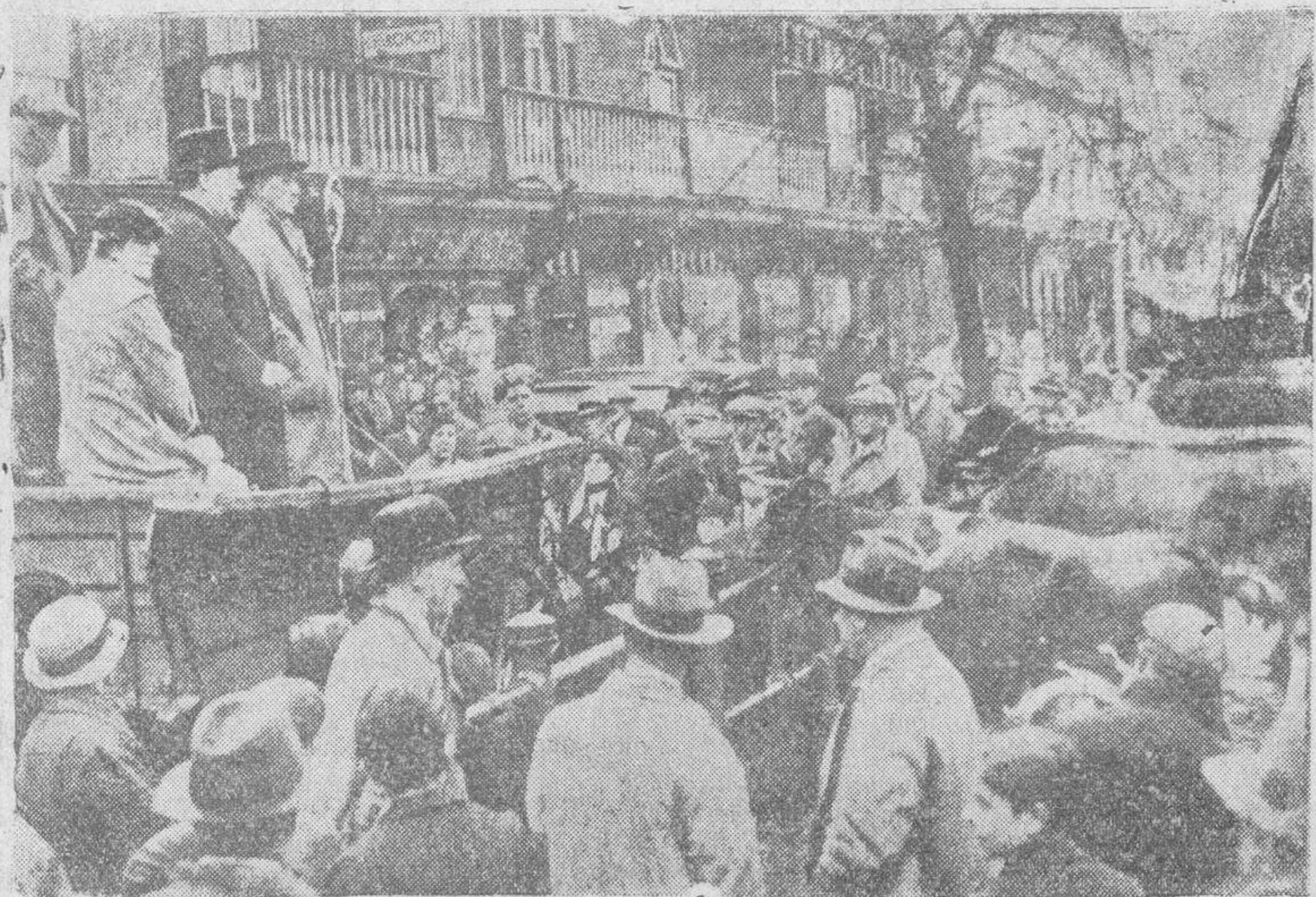
La relación de la política británica con la paz d' Europa hace que este año tenga excepcional importancia el resultado de las elecciones. Mister Winston Churchill, candidato del partido conservador, haciendo la propaganda de su candidatura desde un camión con altavoces, que recorre los barrios más modestos