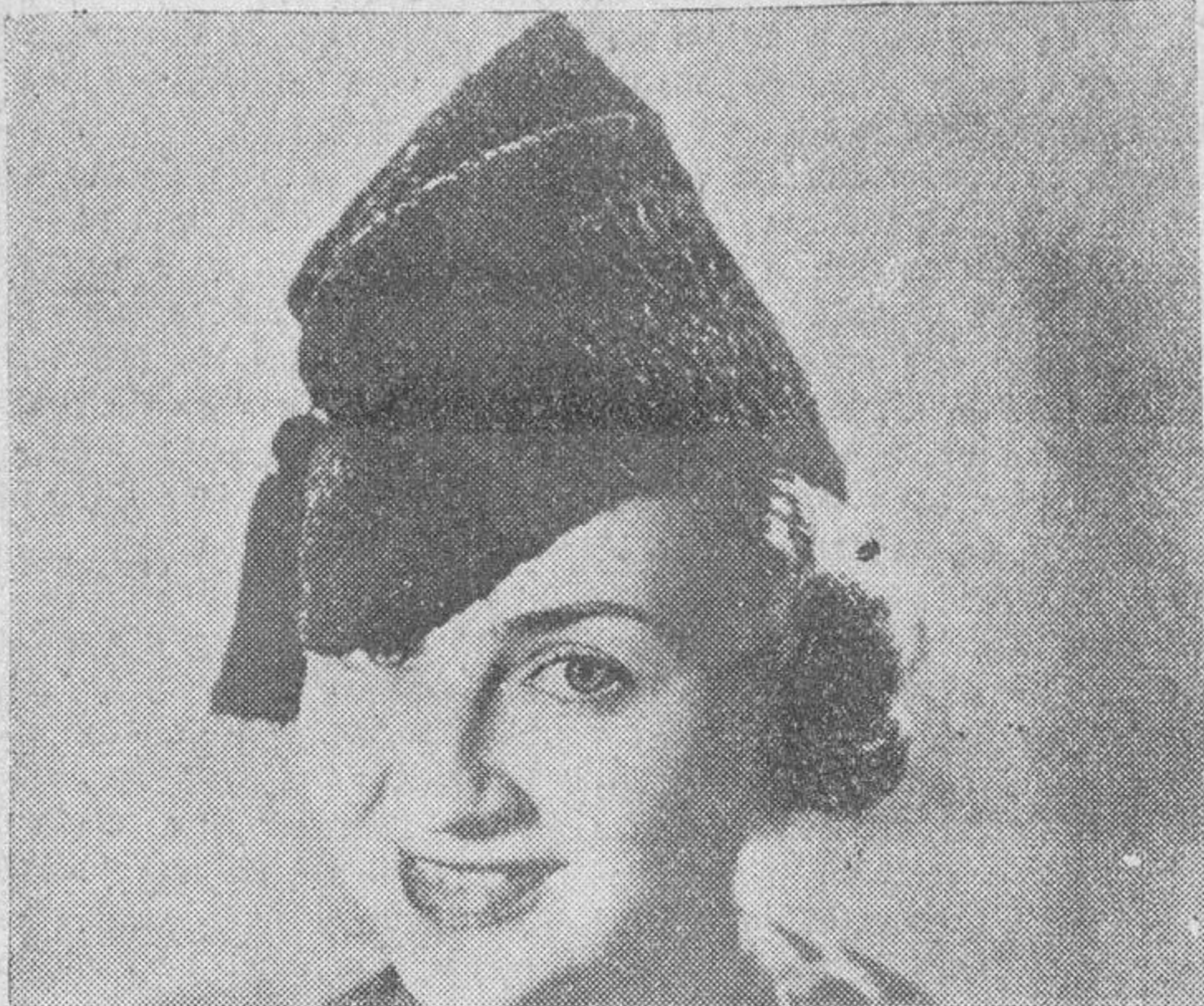
Un gorrito de astracán, con bo la al lado derecha, la última creación de la moda