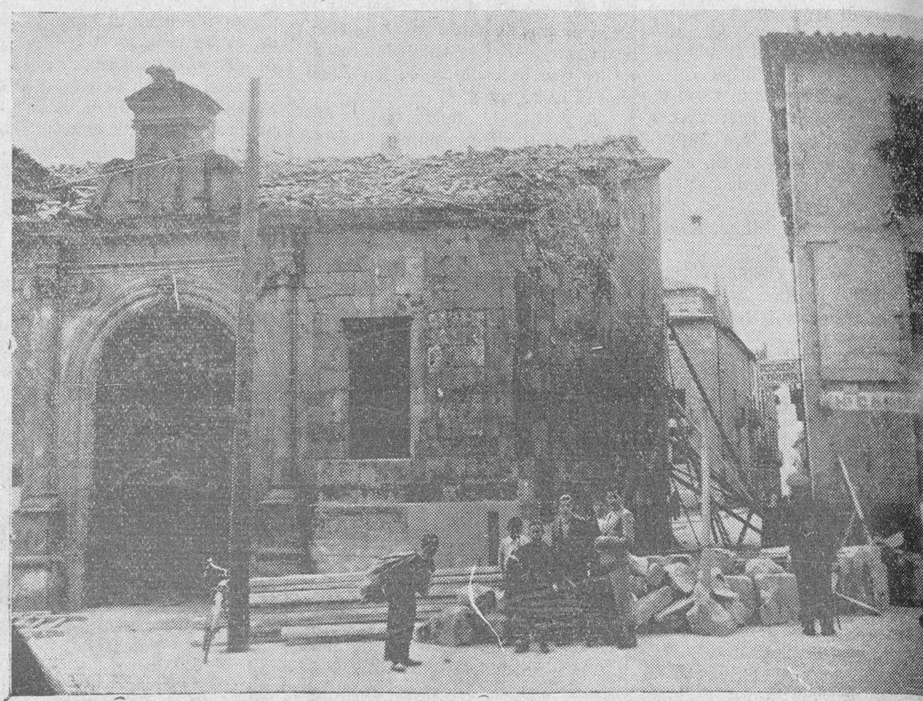
El Garage de San Isidro del que ayer se desprendió como puede verse en la foto, un gran trozo de pared, ocasionando lesiones a un obrero y a un niño.

y en un automóvil fué trasladado a la Casa de Socorro, donde fué curado de una herida contusa en la región occipital y contusiones en diferentes partes del cuerpo. Después de asistido el herido en