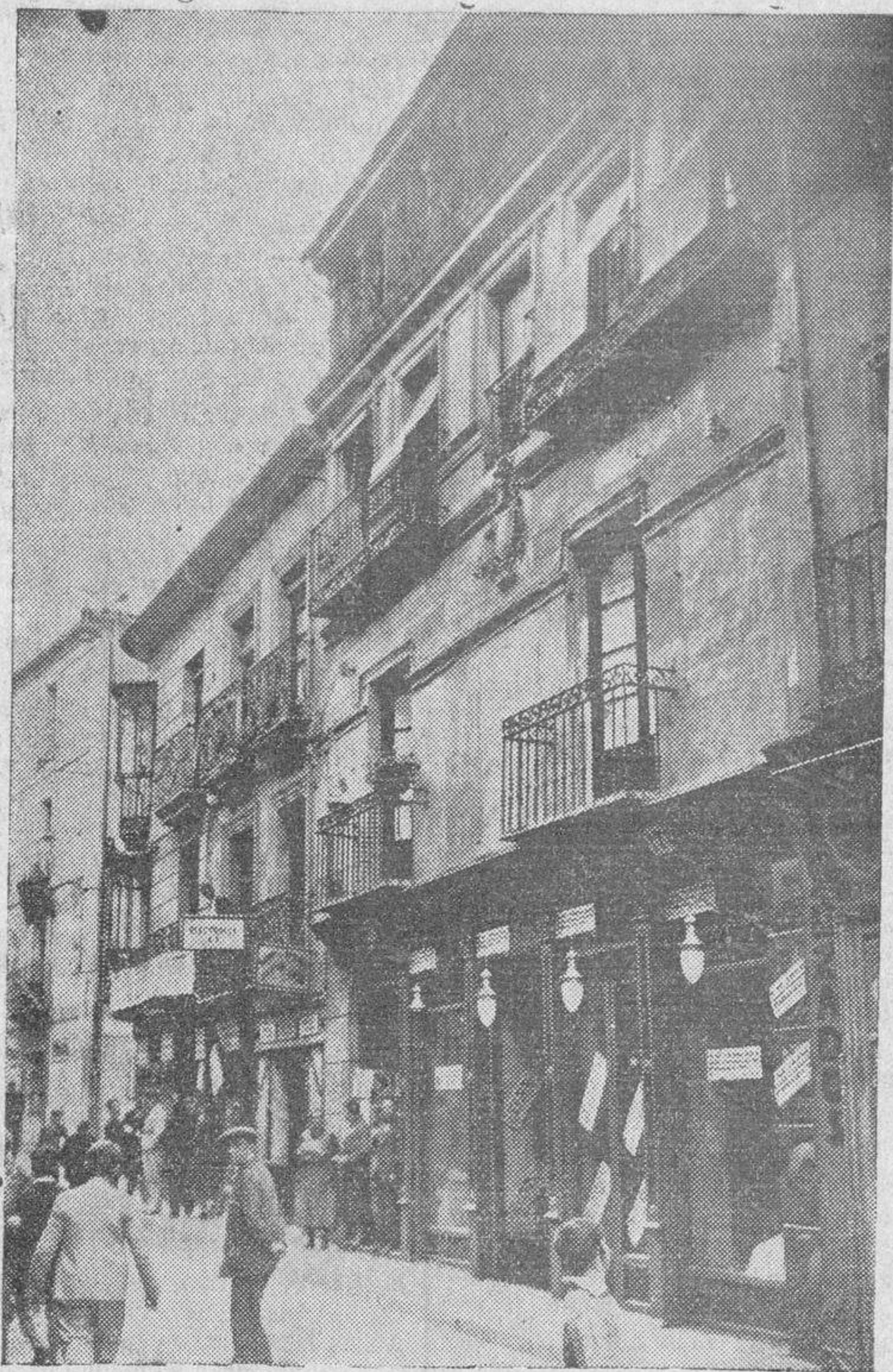
Las casas números 15 y 17 de la calle del Doctor Risco, propiedad de don Víctor Villoria, en las que éste se propone hacer nuevas edificaciones con todo el confort moderno. La fachada muestra los letreros en los que los arrendatarios de los locales, anuncian el traslado de los respectivos comercios