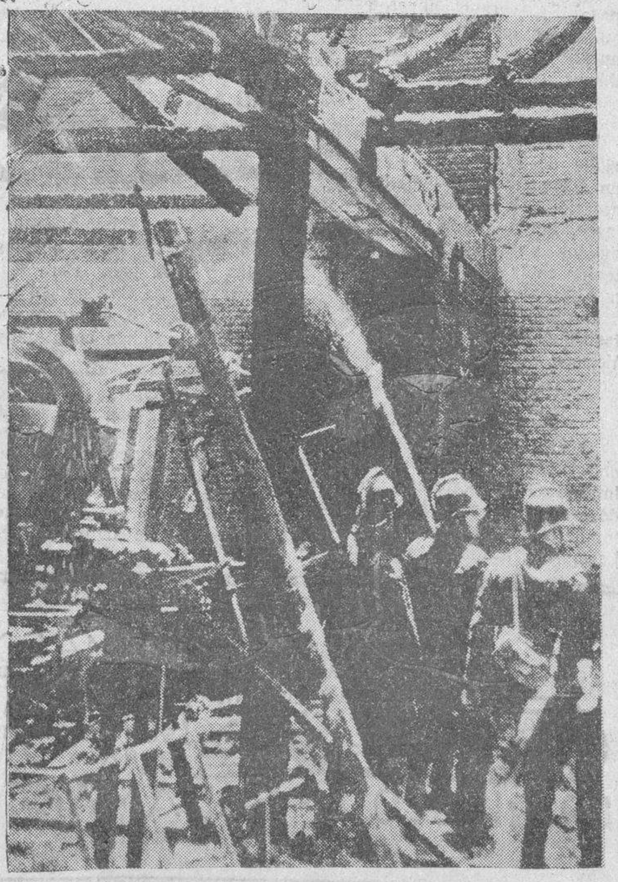
Los bomberos trabajando en la extinción del incendio que destruyó parte de una fábrica de guata, según dimos cuenta en nuestro último número