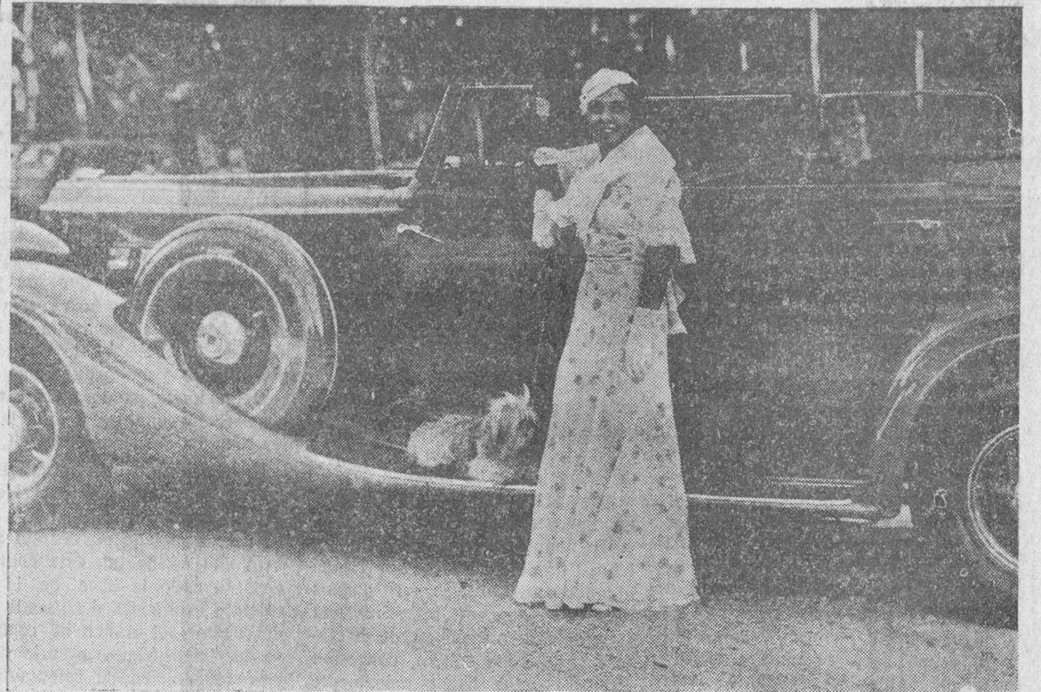
El pasado jueves se celebró en el paseo de coches del Retiro, en Madrid, un concurso de elegancia del automóvil con extraordinario éxito. He aquí un bello coche y su aún más bella propietaria