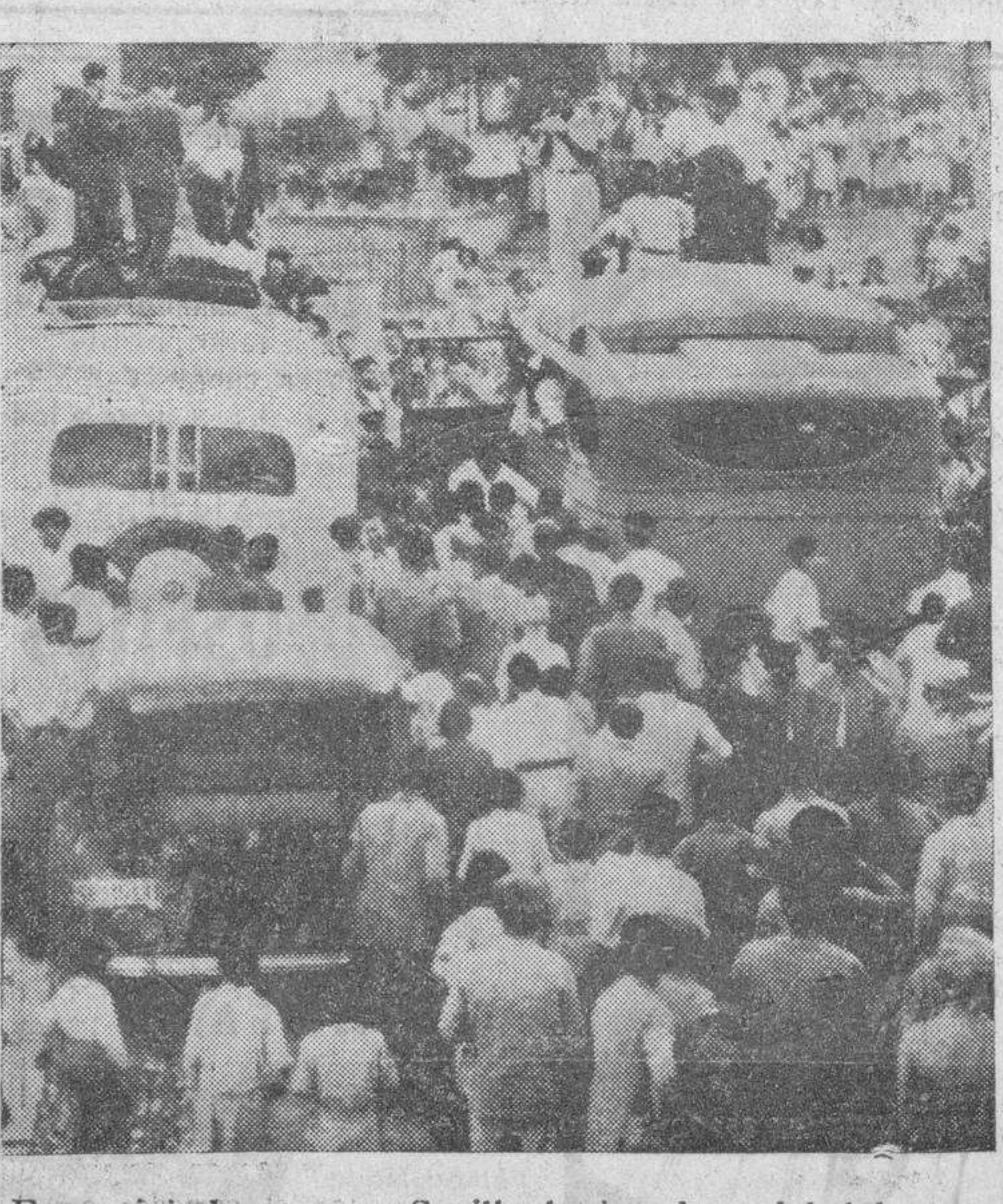
En su viaje de regreso a Sevilla, los jugadores del club titular, nuevos campeones de todas clases, fueron objeto de entusiastas homenajes. Véase al vecindario de Carmona, rodeando los autocares de los equipiers, a los que hicieron detener algunos momentos