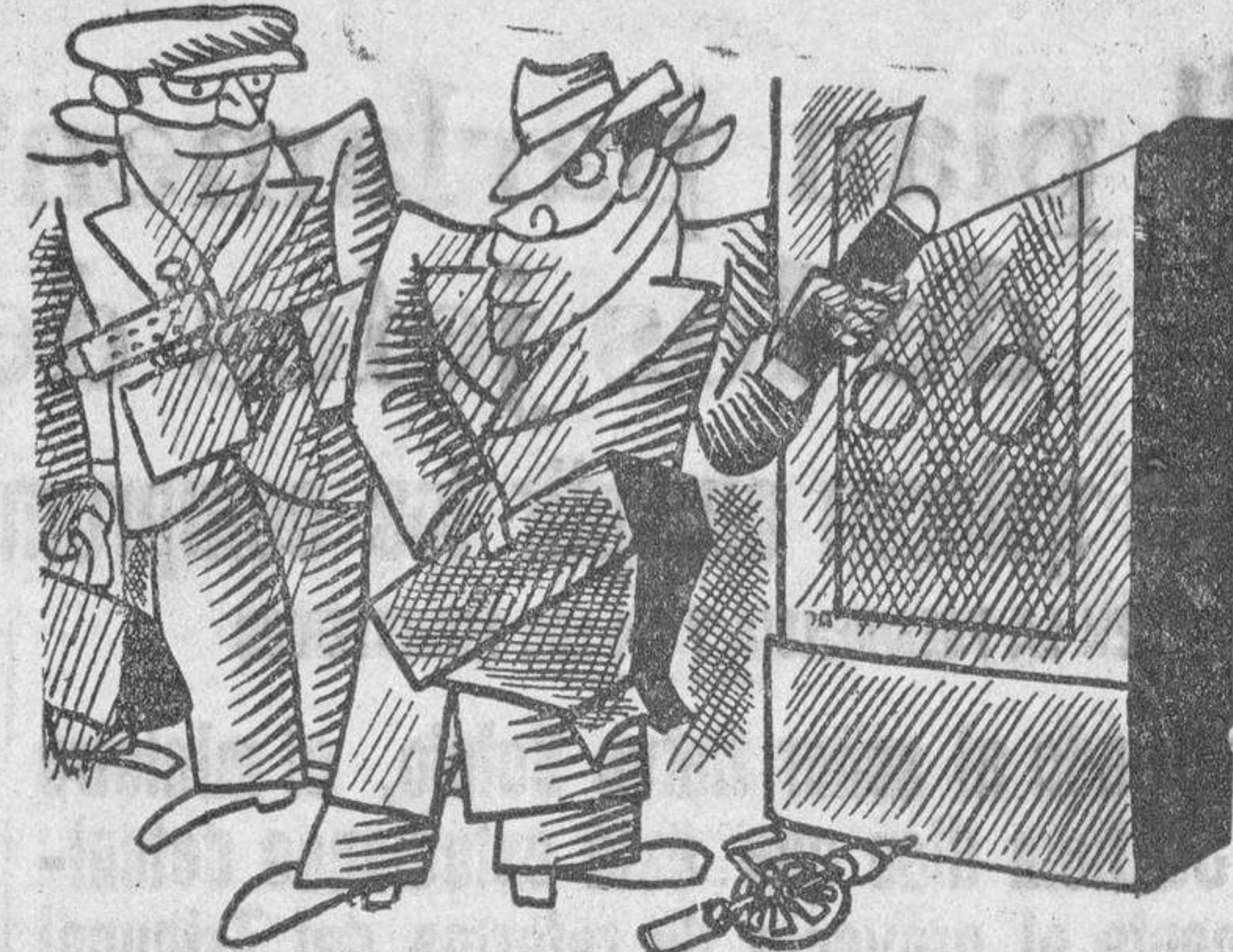
ASALTADORES MODERNOS —Llama al radiólogo. No vaya a ser que esta caja de caudales esté vacía... (Gringoire)