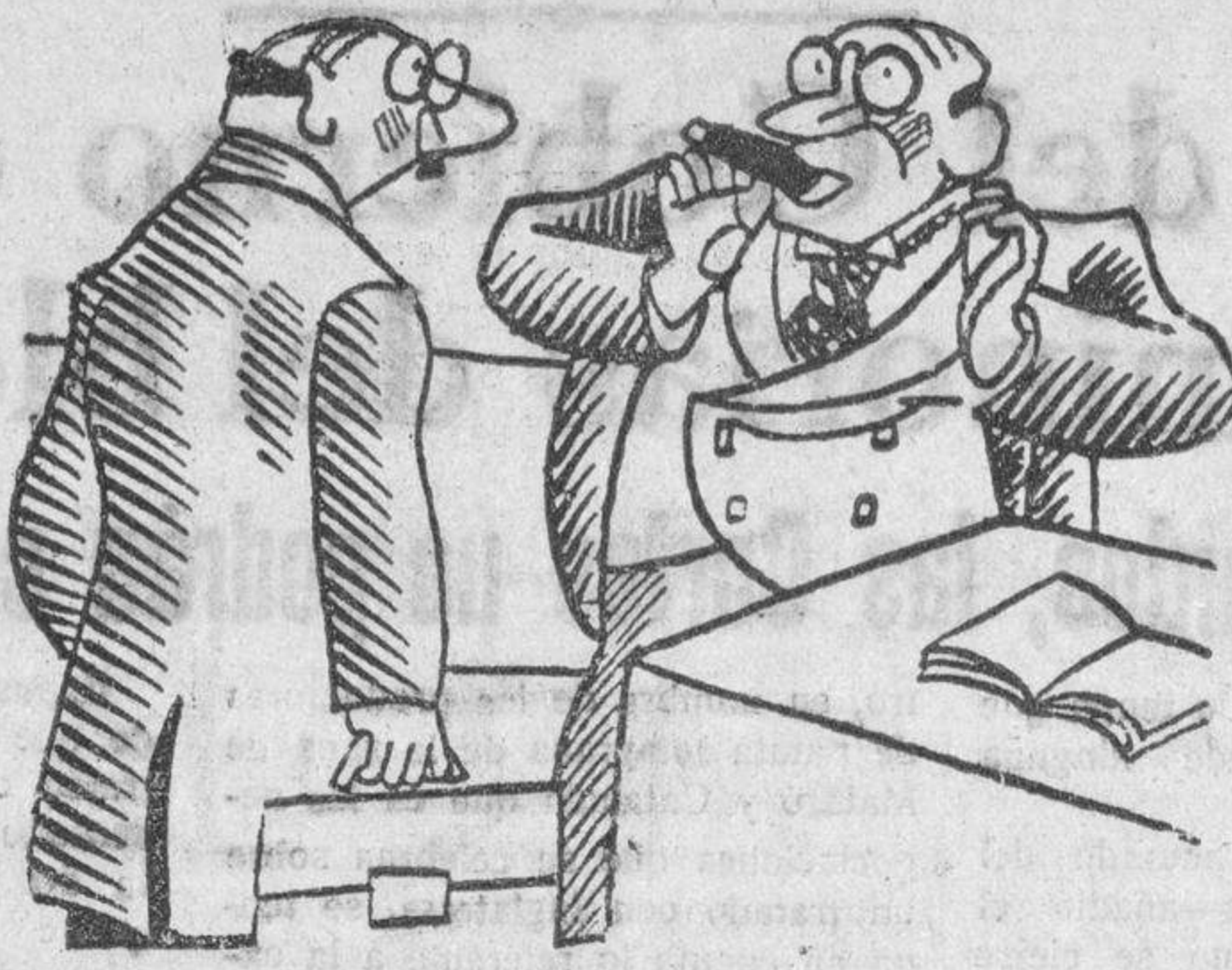
EDITOR Y NOVELISTA —La gente no tiene tiempo para leer. Hay que decirse todo rápidamente. En la próxima novela, el final sitúe usted al comenzar. (Candide)