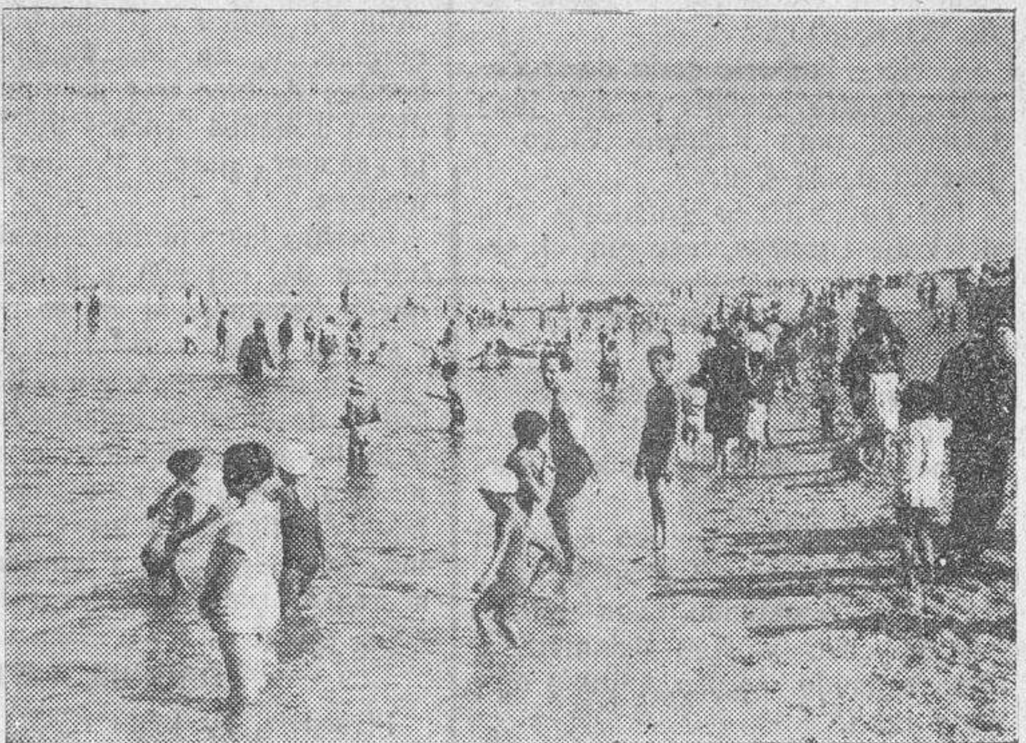
Un aspecto de la playa de Espinho a la hora del baño

Desde hace unos cuantos años ha dejado de ser la playa portuguesa de Espinho—tan frecuentada por numerosas familias de esta provincia—recoleta y pueblerina para convertirse en centro turístico de modernismo refinado, donde la playa, en la hora del baño, y en el Gran Casino en las fiestas que organiza, se lucen los mallots de moda y las toiles lujosas, respectivamente, y donde, en fin, se derrocha alegría y buen humor con el tono distinguido de las playas mimadas del gran mundo. No obstante lo anterior, a pesar de ese gran avance que ha experimentado Espinho, existe aún una característica peculiar de este pueblo laborioso que consiste en saber mantener la vida barata, incluso para tener bien abastecido el mercado, llegan recién pescadas en Matozinhos. Es también la playa de Espinho la más económica por el precio de los arrendamientos de las casas para familias enteras y por el coste de la estancia en pensiones y hoteles, unas y otros instalados y servidos para satisfacer plenamente a quienes en ellos se hospeda. Los precios de las pensiones oscilan entre 5 y 10 pesetas por día y por persona, y el coste de la pensión completa en los hoteles varía entre 9 y 13 pesetas diarias. En el arrendamiento de las casas, según se concierte, suele estar comprendido el servicio de vajilla de cocina y de comedor, la