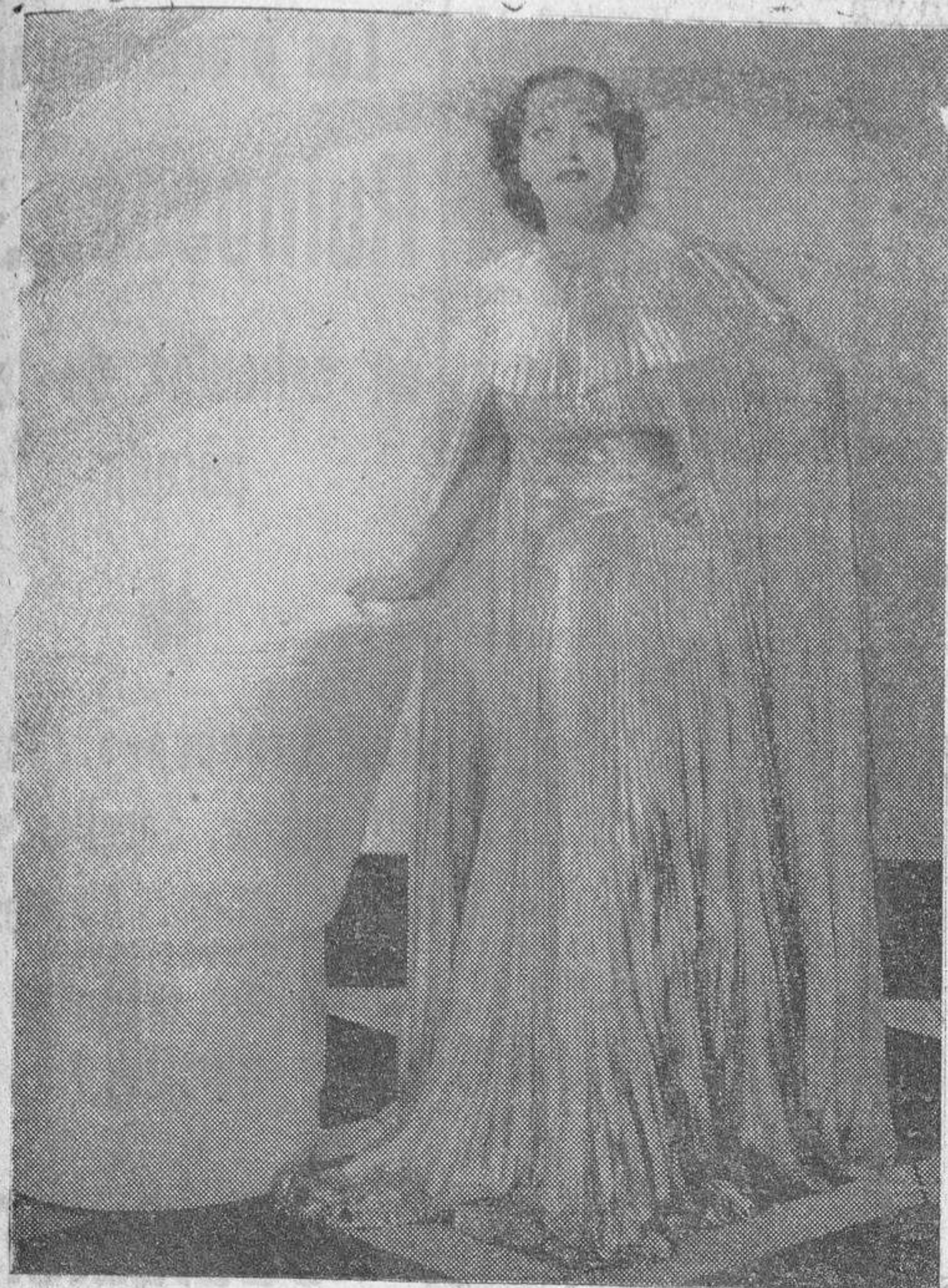
Brillante como rayos de luna es este traje diseñado por Adrián, que Joan Crawford exhibe en su nueva película. El traje se confeccionó con 32 metros de tela laminada con hilos de plata y plegada en acordeón