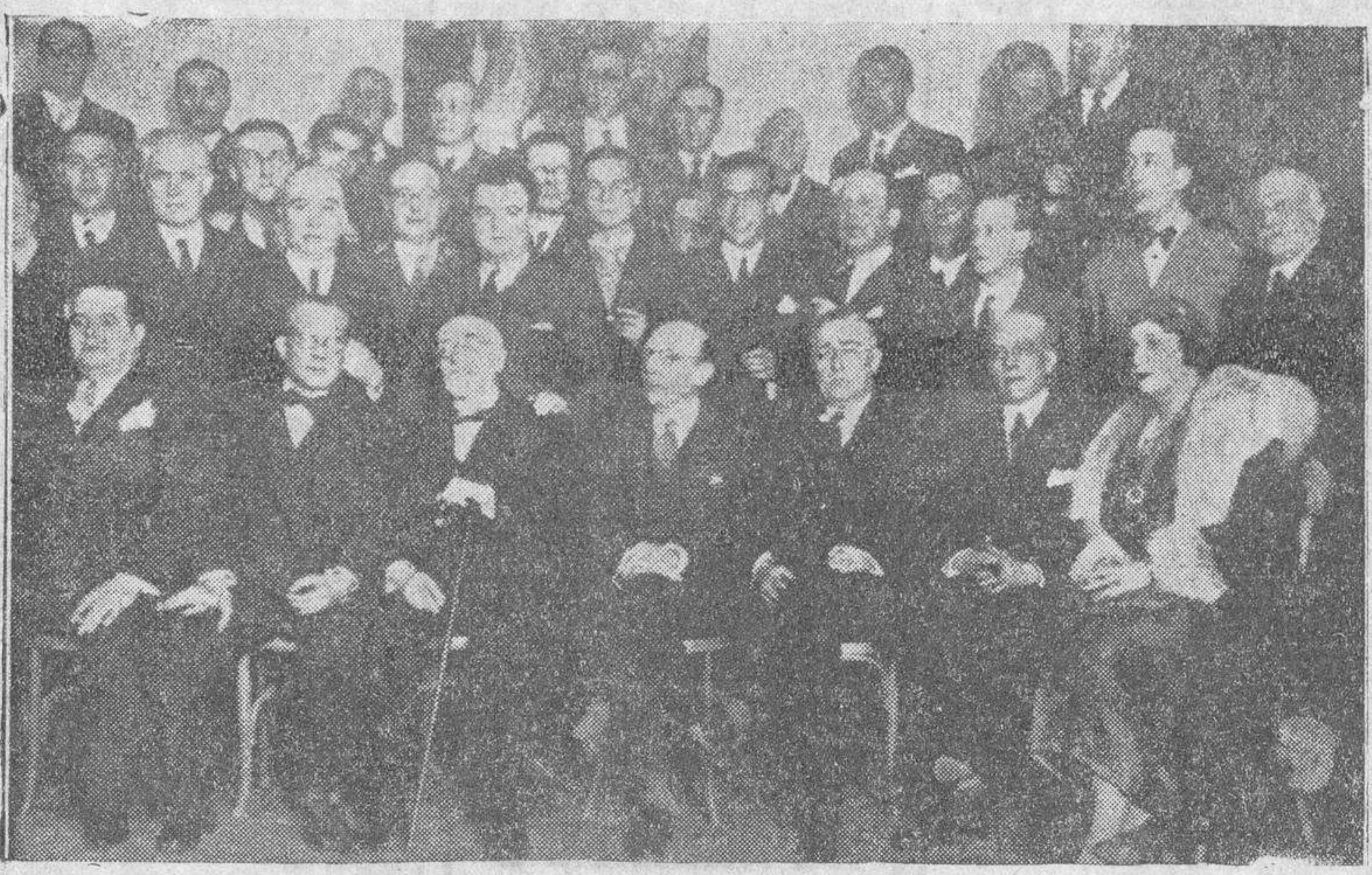
Grupo de concurrentes al agasajo celebrado en la Casa Regional Valenciana...

decla días atrás en un discurso memorable: "Desde un despacho donde no falta ninguna de las comodidades..."