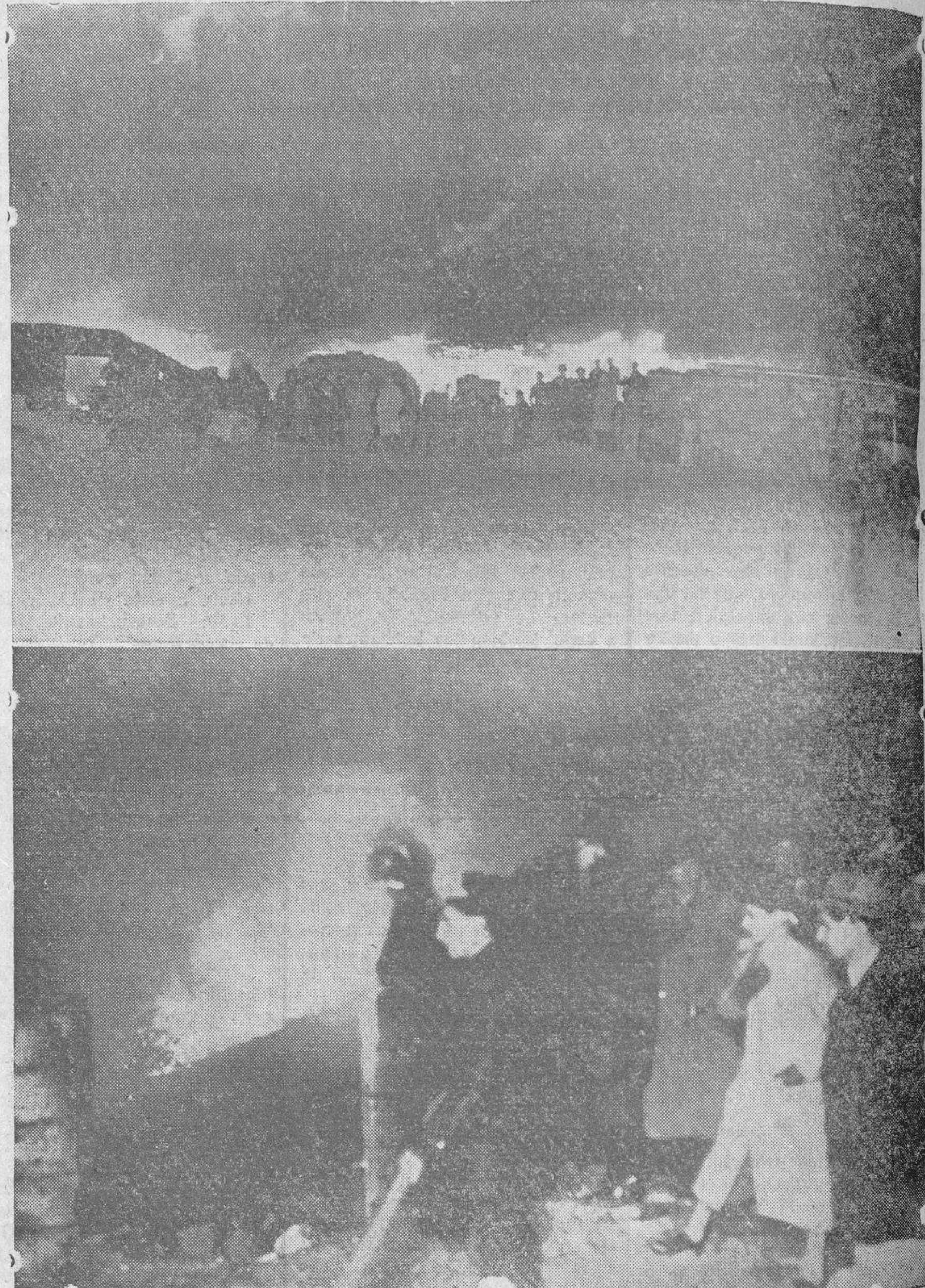
A pecto que ofrecía la fábrica siniestrada, después de producidos los derrumbamientos de la techumbre y parte de los muros. Abajo: Los bomberos, tratando de sofocar el fuego

El edificio siniestrado, medía 60 metros de largo, por nueve de ancho, construido con piedra y techumbre de cemento armado. Tenía contigua una casa, que estaba destinada al guarda, la cual también ha quedado destruida. Las pérdidas se calculan en unas cen-