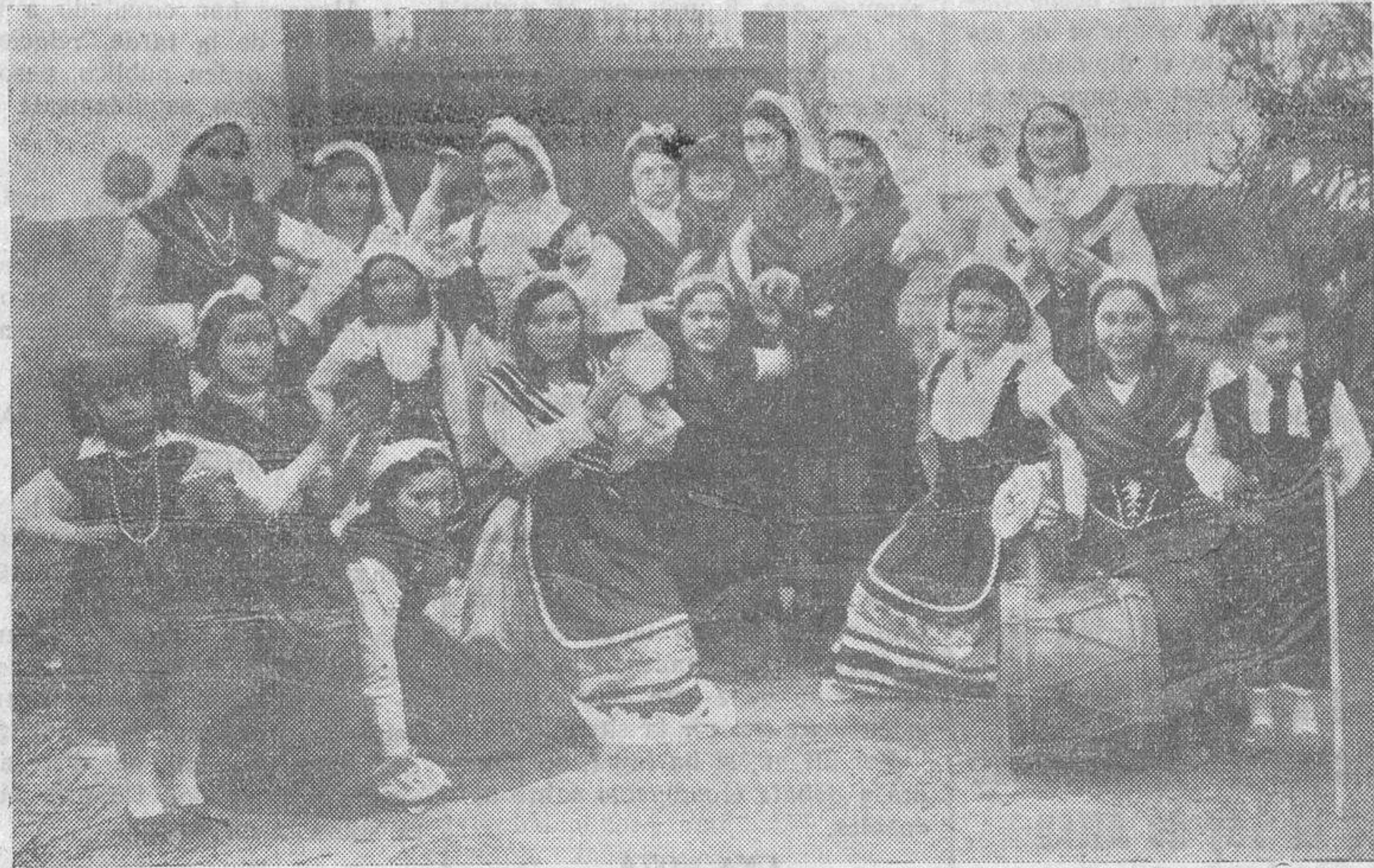
Grupo de niños y señoritas que representaron un cuadro gallego en el teatro de La Frontera, de Lumbrales

Las tres obras alcanzaron un señalado éxito, destacándose el