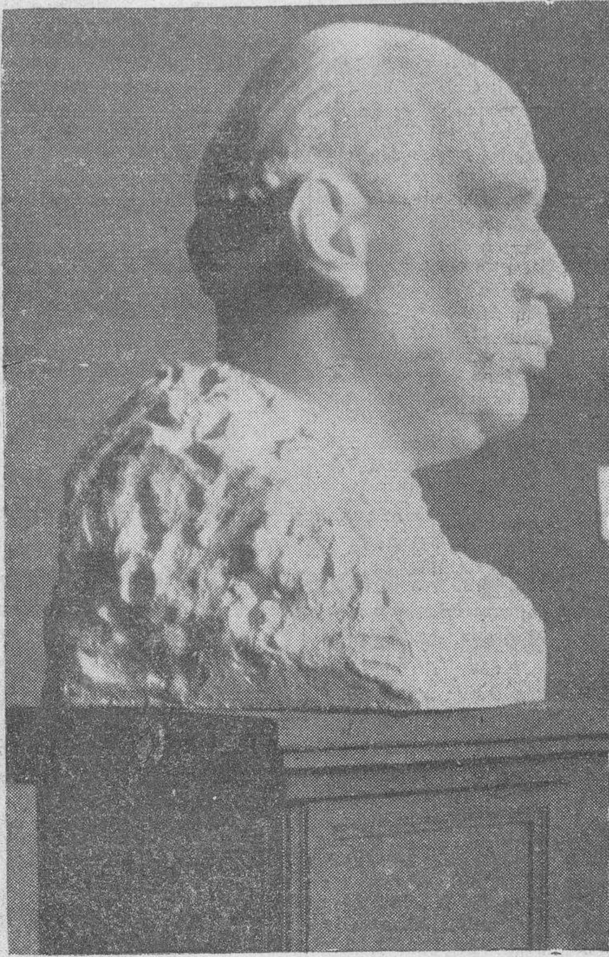
Uno de los bustos que presenta González Macias en «Los Amigos del Arte»

es también genial en los simples bultos: cabezas retratos con sobriedad y fuerza de trazo...; delicadas tallas infantiles como "Joven madre", tercera medalla de la última Exposición Nacional; "Niña