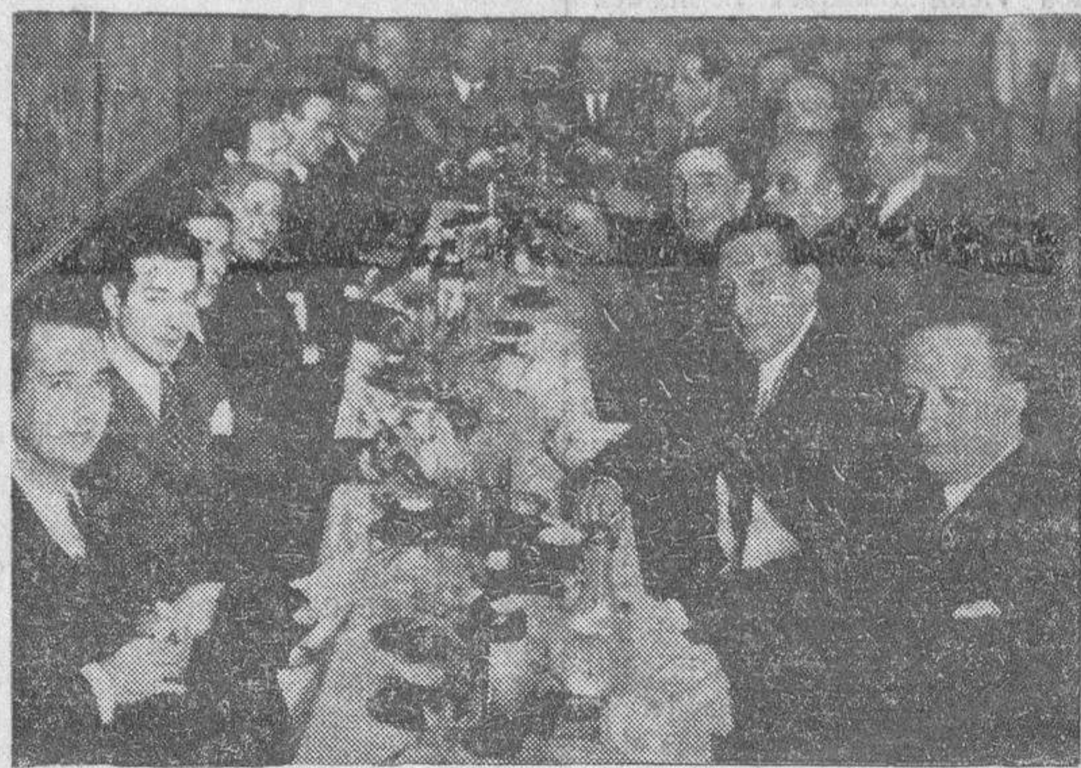
Los «ases» del fútbol, que se vieron en la imposibilidad de asistir al homenaje tributado recientemente al ilustre actor don Ricardo Calvo, han obsequiado a éste con un almuerzo íntimo, en el que participaron otras personalidades del teatro que, como el genial comediante, hacen compatible su arte con la afición al popular deporte.