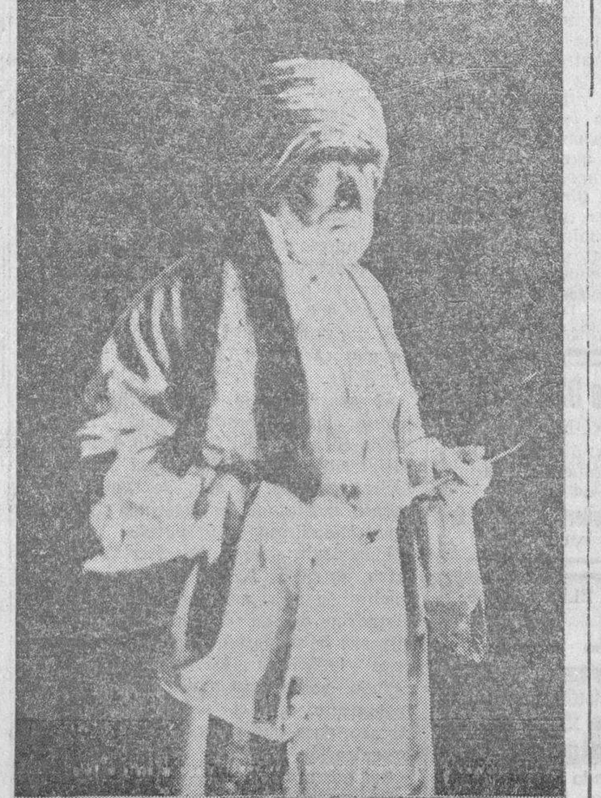
M. Paul Poiret, en traje de príncipe persa

Paul Poiret instala sucursales en Cannes, Biarritz, Niza; lleva sus modelos por las capitales de Europa en una alegre y vistosa caravana de muchachas jóvenes y bonitas; dibuja para las revistas de moda, vistiendo a las "vedettes", a las