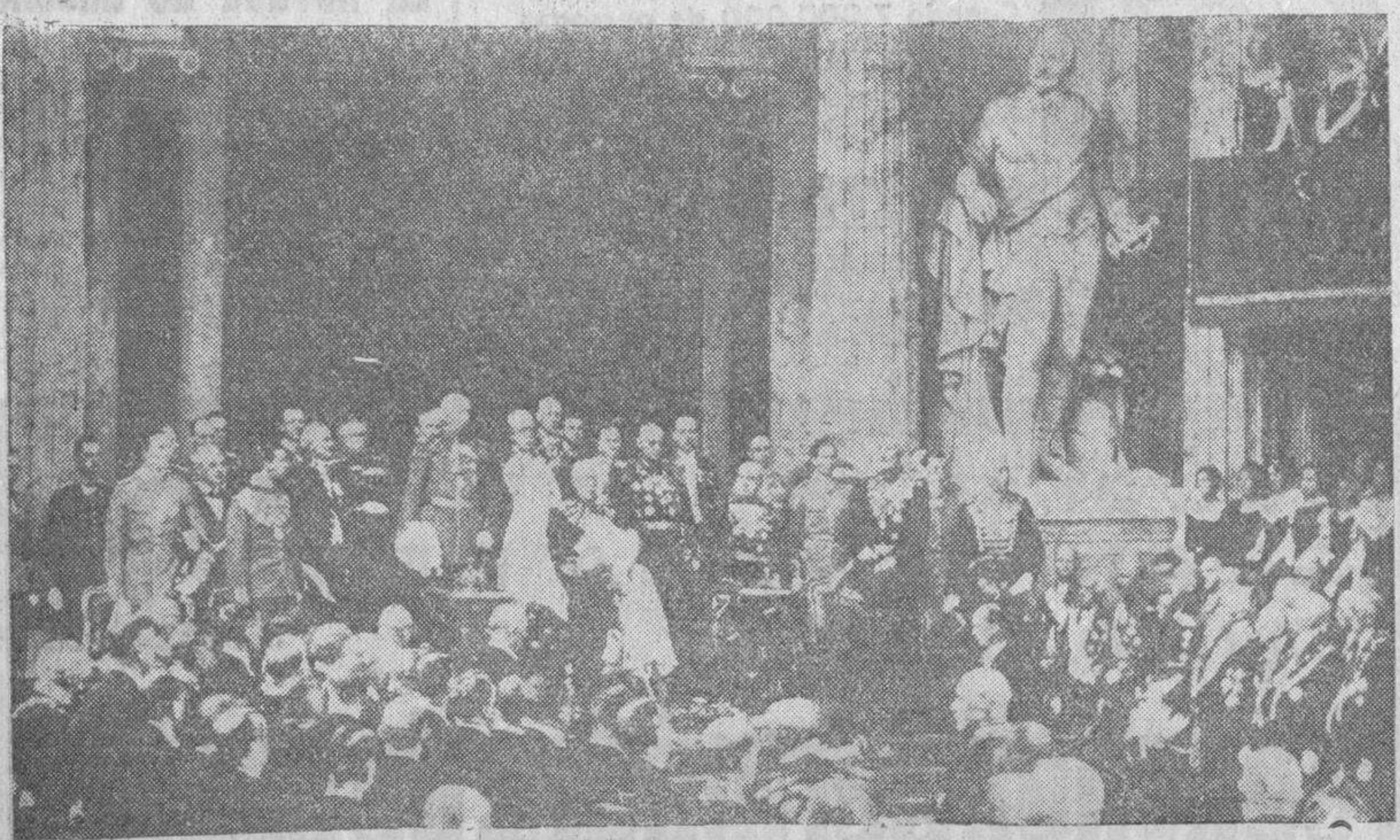
Un momento de la solemne ceremonia conmemorativa del quinientos aniversario del Parlamento sueco, celebrado el pasado día 11, y a la que asistió el rey Gustavo V.