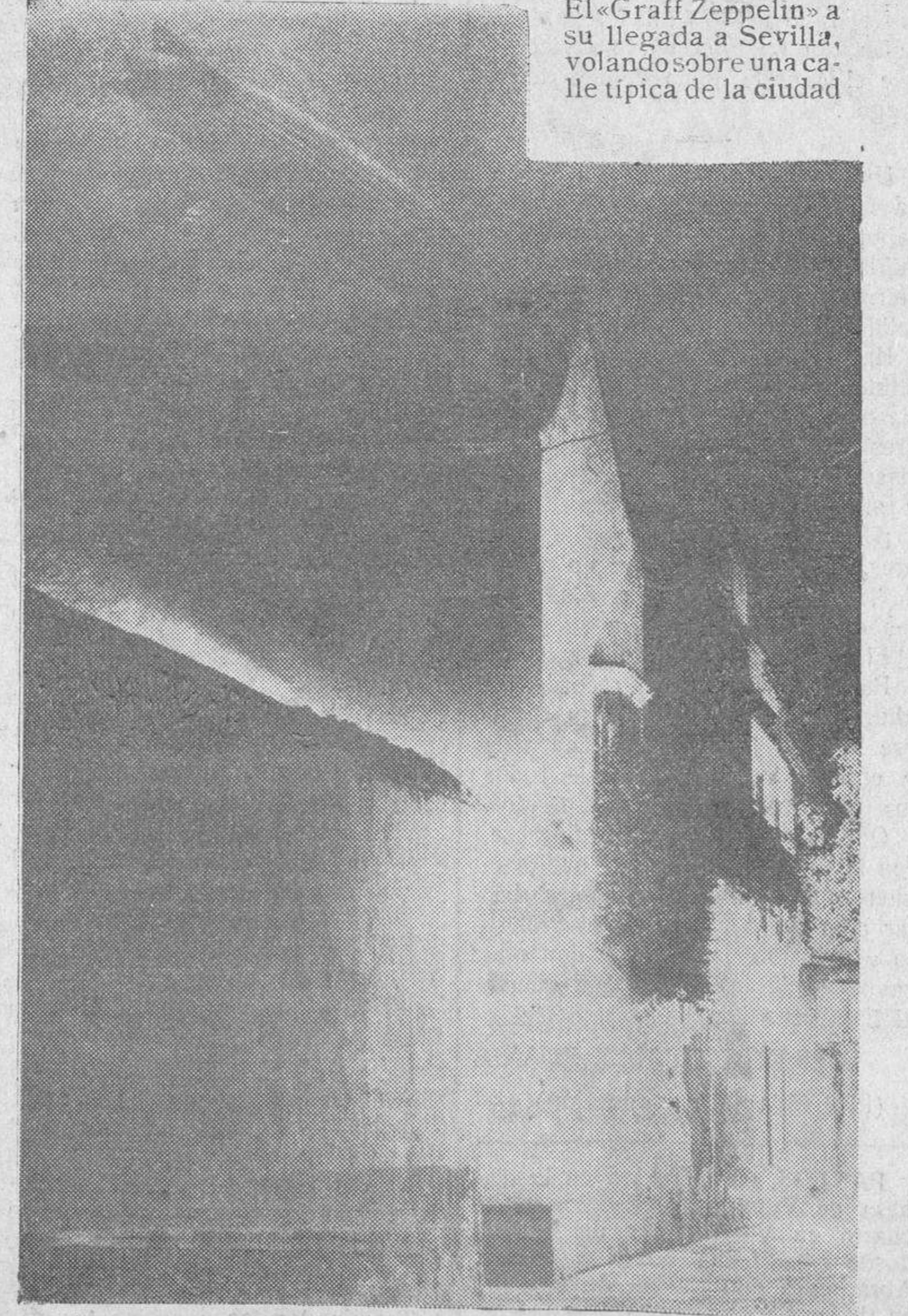
El «Graff Zeppelin» a su llegada a Sevilla, volando sobre una calle típica de la ciudad

Recordar que, en tiempos del señor Martínez Barrio, se aplicó la censura a los manifiestos de algunas organizaciones afiliadas a la U. G. T., leídos en el salón de sesiones por la señora Nelken.