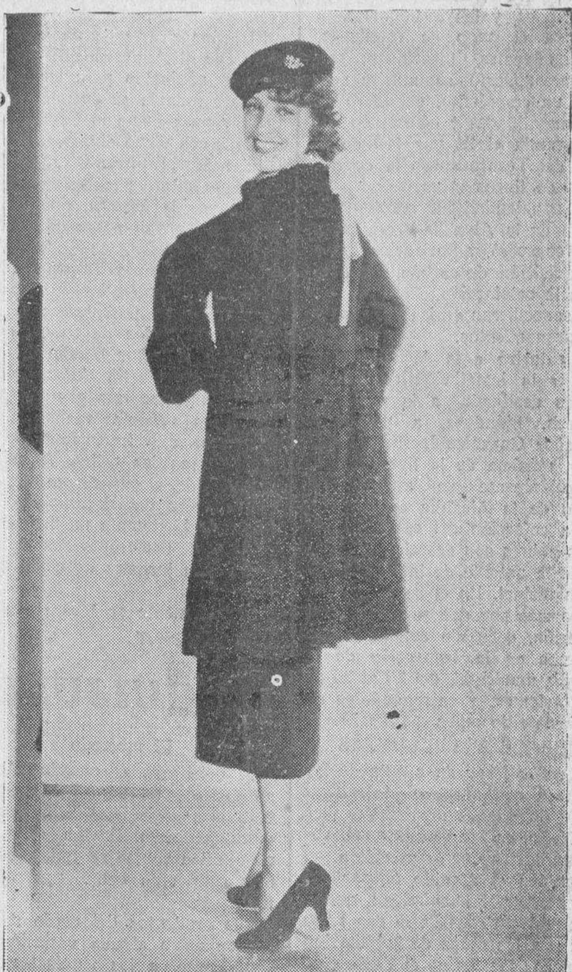
Jeanette Mac Donald, famosa estrella y cantatriz de la Metro-Goldwyn-Mayer, con un «ensemble» de su vestuario particular, en el que puede verse la tendencia a lo ruso que muestran las modas femeninas actuales