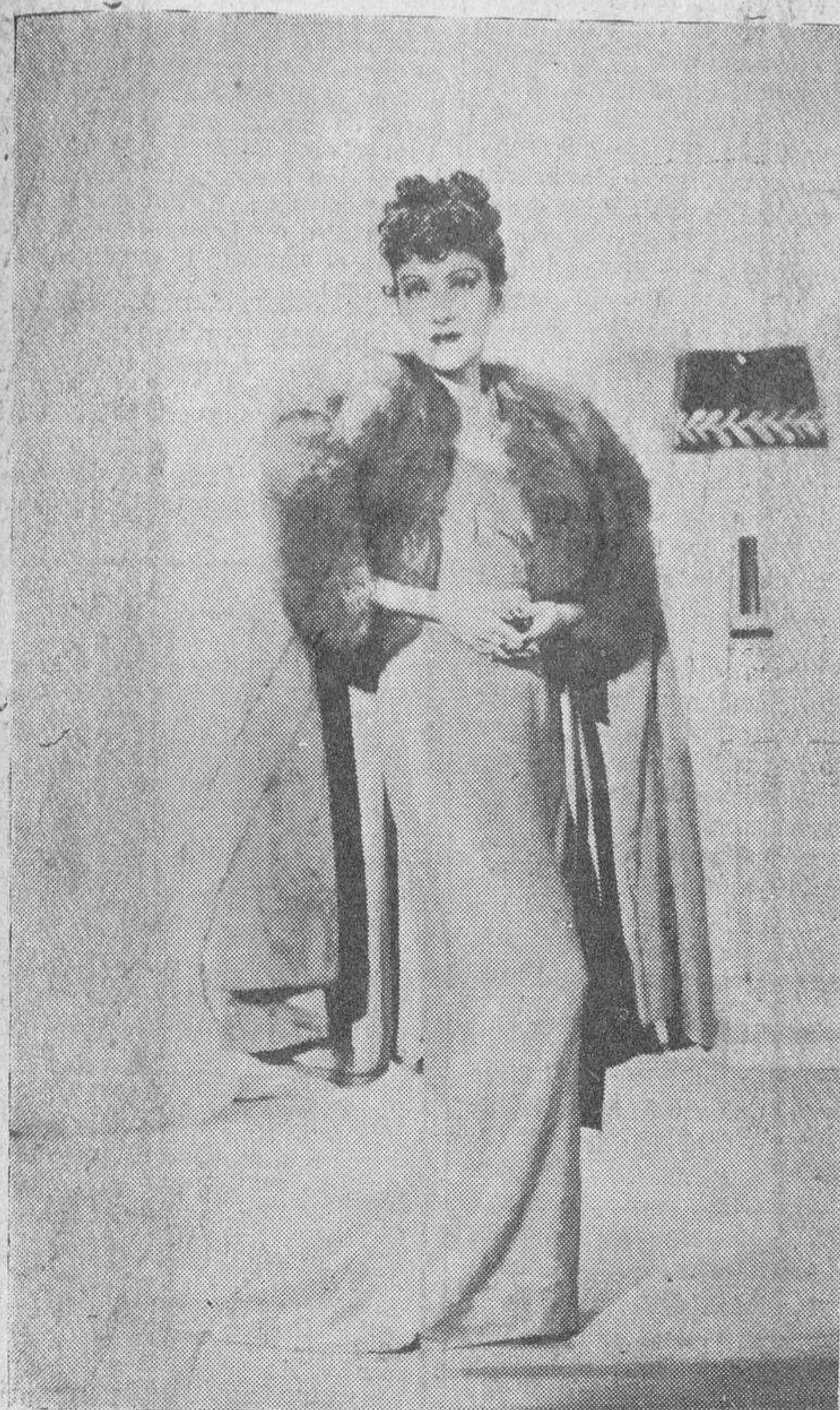
Gloria Swanson, luciendo uno de los muchos y elegantes trajes que forman su vestuario particular