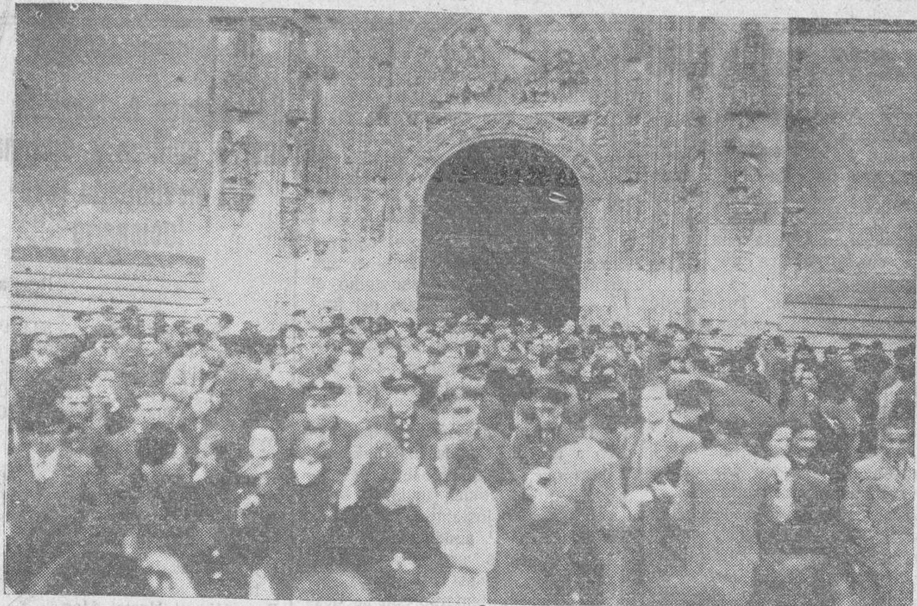
Salida del numeroso público que asistió ayer a los funerales celebrados en la Catedral, en sufragio de las víctimas de la sublevación, y organizados por la Asociación Femenina de Educación Ciudadana. —(Foto Almaraz).

A las once de la mañana, en la Catedral, tuvieron lugar solemnes funerales por todas las víctimas del último movimiento revolucionario, que habían sido organizados por la Asociación Femenina de Educación Ciudadana.