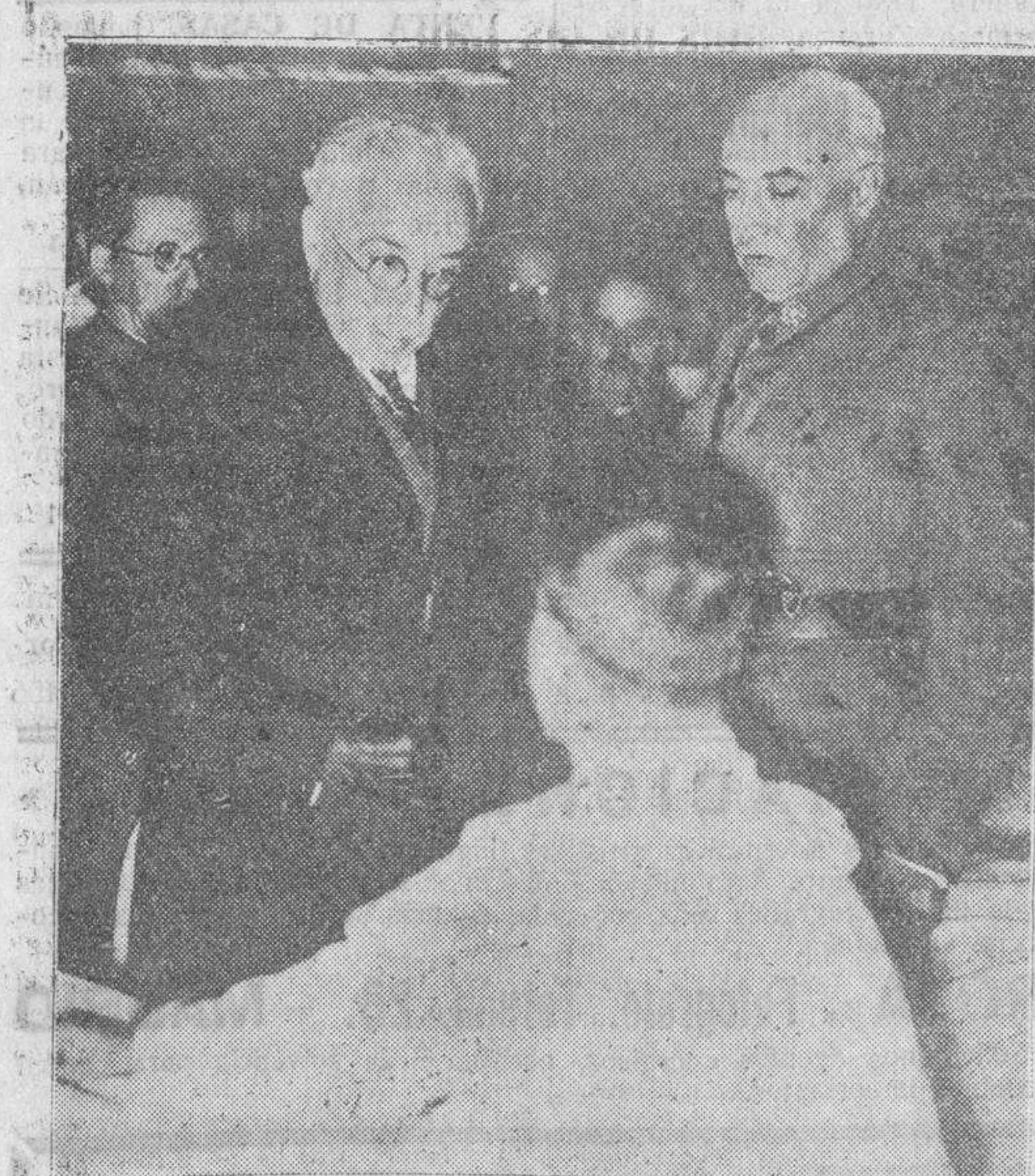
Su Excelencia el Presidente de la República, visitó, el martes, a los soldados heridos en los sucesos revolucionarios, hospitalizados en Carabanchel. En la foto aparece el jefe del Estado conversando con uno de los heridos, a los que prodigó frases de caluroso elogio.