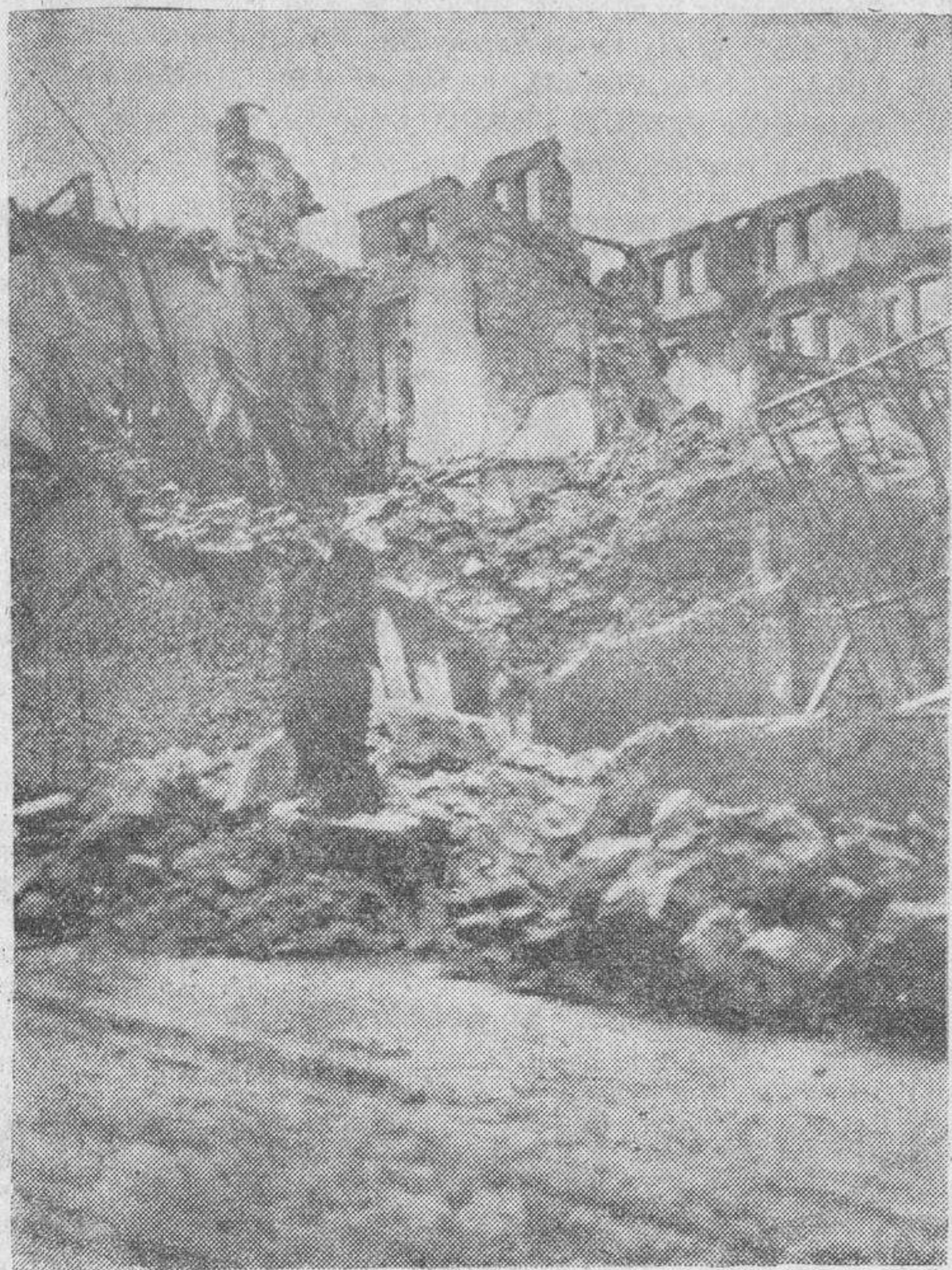
He aquí los restos del Instituto de Oviedo. Los rebeldes utilizaron el edificio, estableciendo en él su cuartel general. Al ser derrotados los revolucionarios, volaron el edificio, quemando la gran cantidad de dinamita que habían almacenado