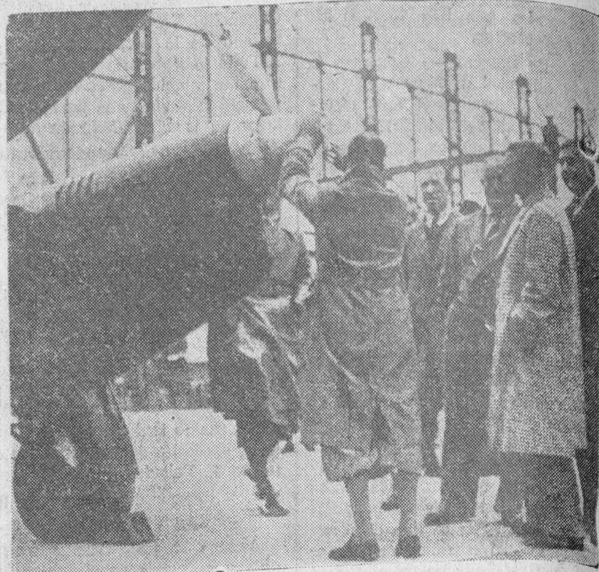
El avión «Gresvenor House», pocos instantes después de haber llegado al hipódromo de Flemington (Australia), tripulado por los aviadores ingleses Scott y Black, que constituirá la meta de la gran carrera aérea Londres-Melbourne. Ha hecho el recorrido de 20.000 kilómetros en dos días y veintitrés horas; marchando a una velocidad media de 256 kilómetros por hora. El Príncipe de Gales aparece en la fotografía, ante el aparato vencedor de la prueba