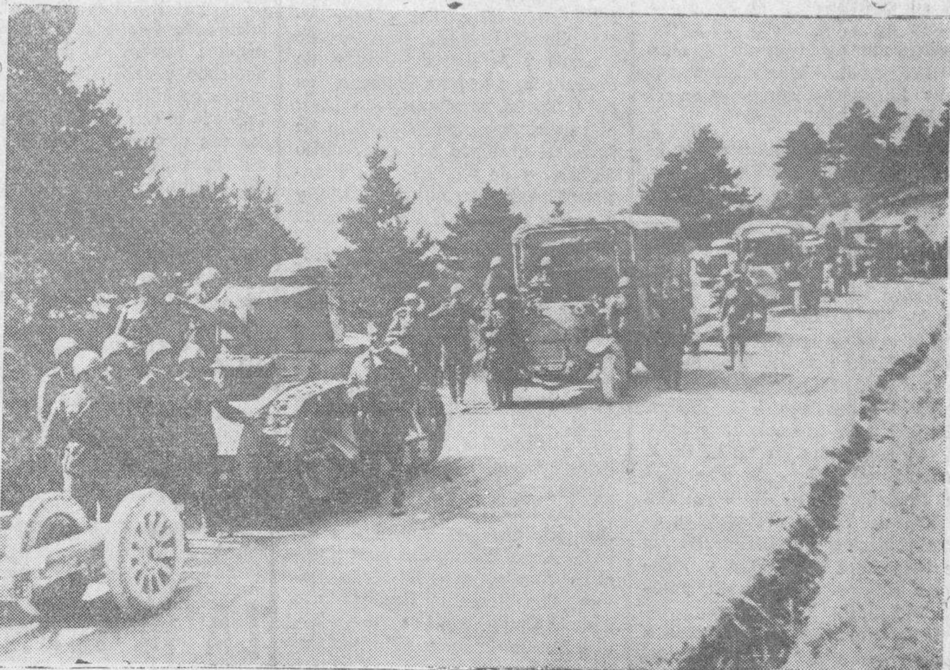
Van a celebrarse en Italia grandes maniobras militares, a las que asistirá el Gobierno en pleno. La foto muestra el comienzo de la concentración de las fuerzas