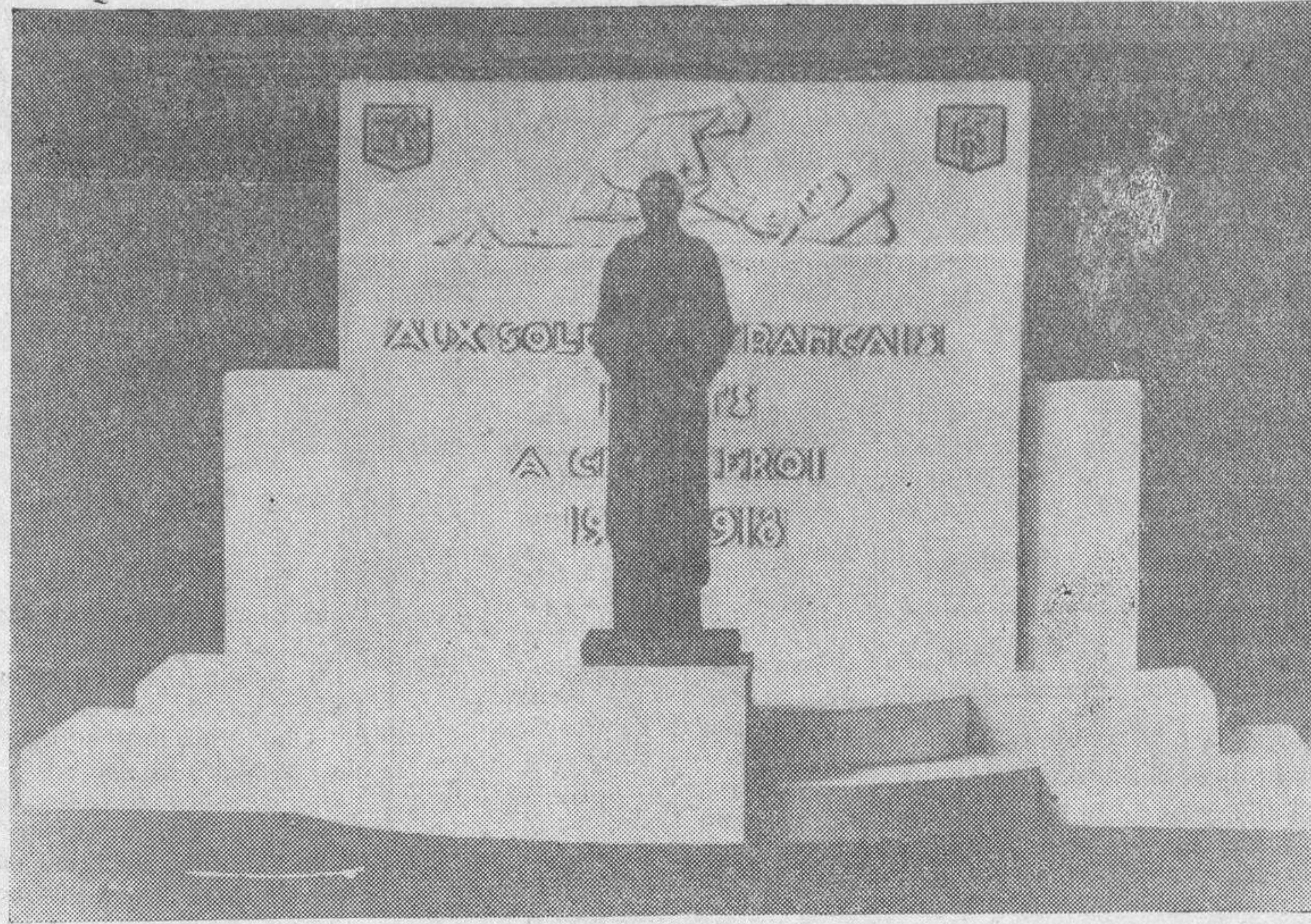
Monumento erigido a la memoria de los soldados franceses muertos en Charleroi, que será inaugurado el próximo domingo.

camente y en su obsequio las Empresas le autorizarán a que transpase su abono a otra persona, pero siempre con la debida intervención y aquiescencia de las Empresas.