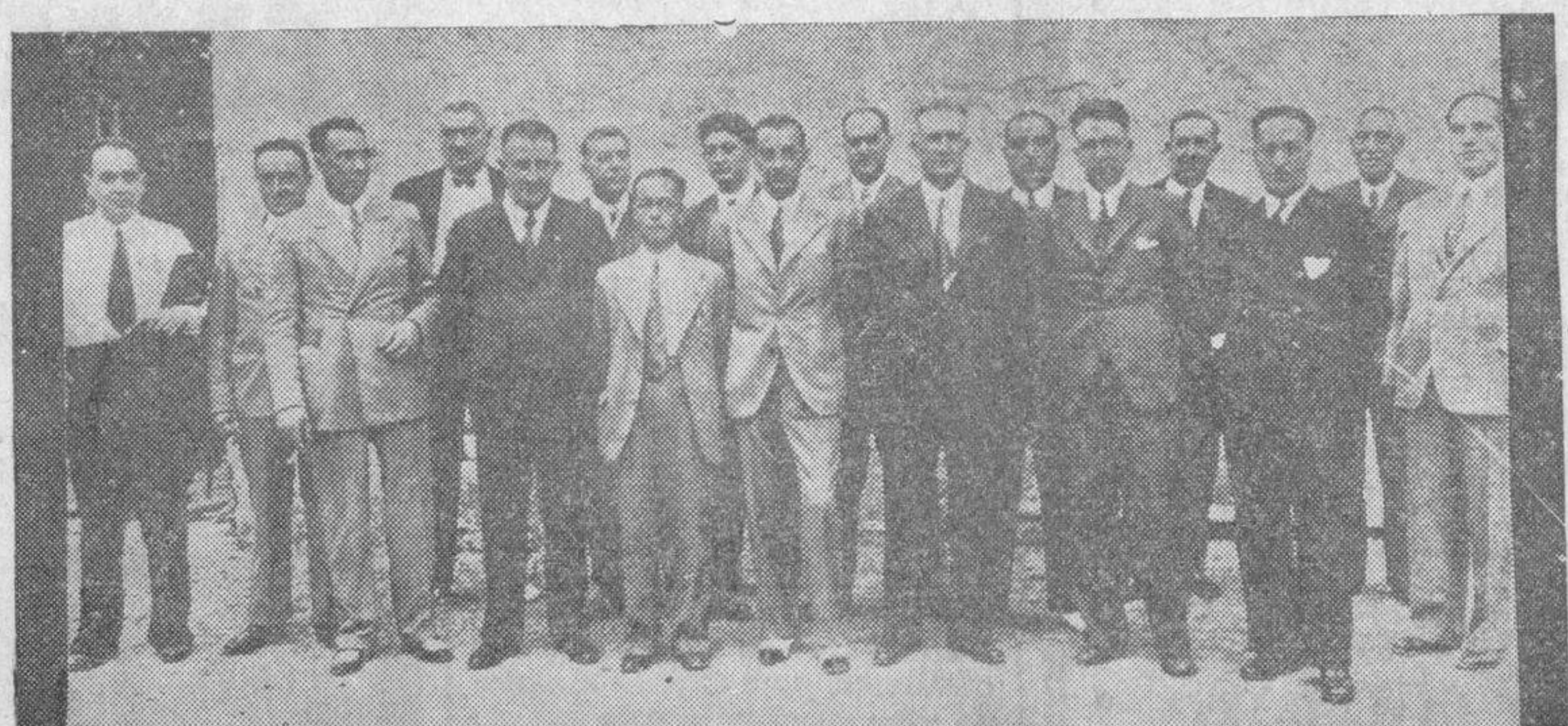
Los alcaldes guipuzcoanos que forman la Comisión defensora del concierto económico, que fueron detenidos por reunirse clandestinamente el domingo último