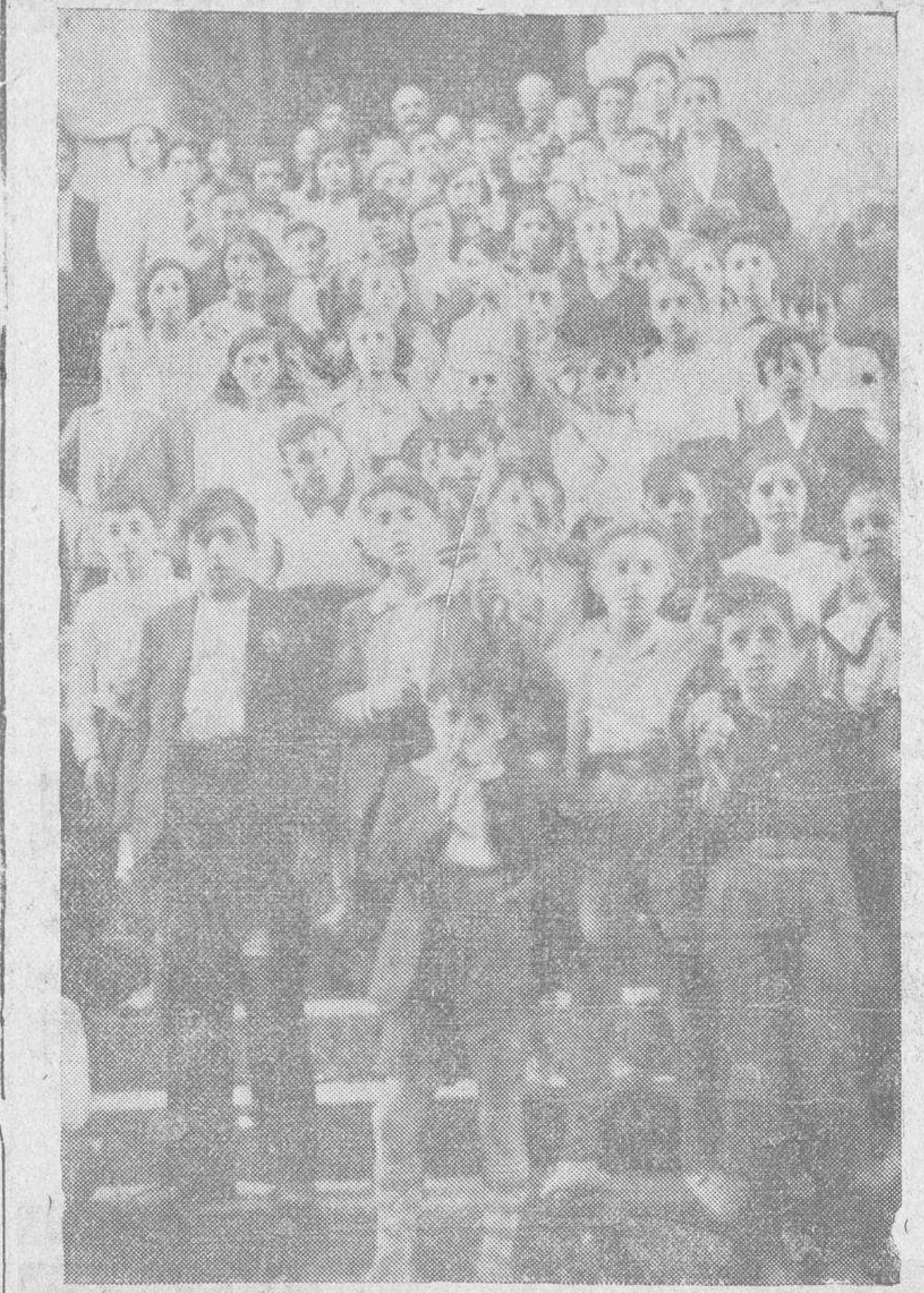
En la Catedral de Zamora