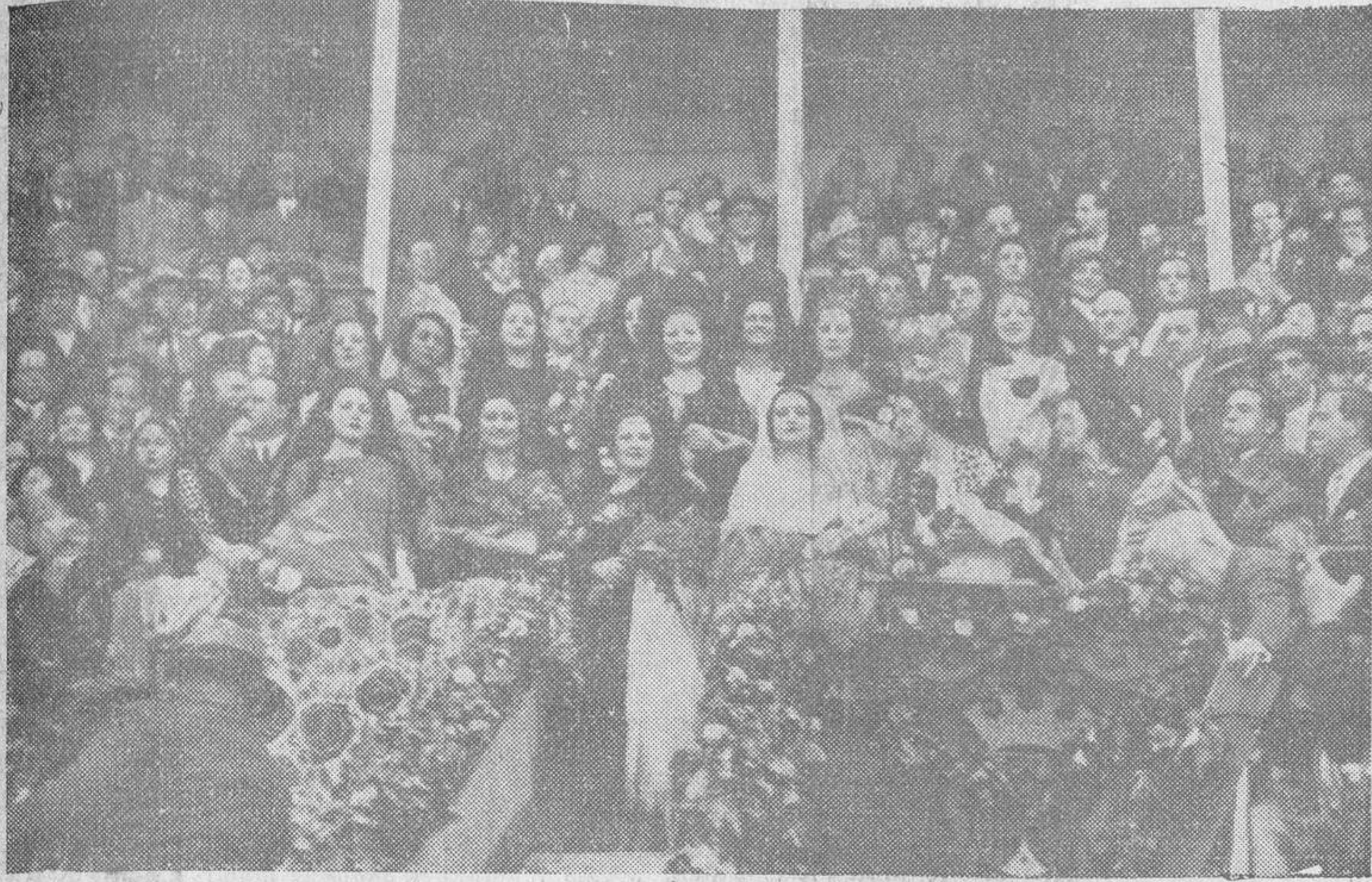
Las "misses" regionales, en su palco presidencial, presenciando la corrida de toros, celebrada el pasado jueves en su honor