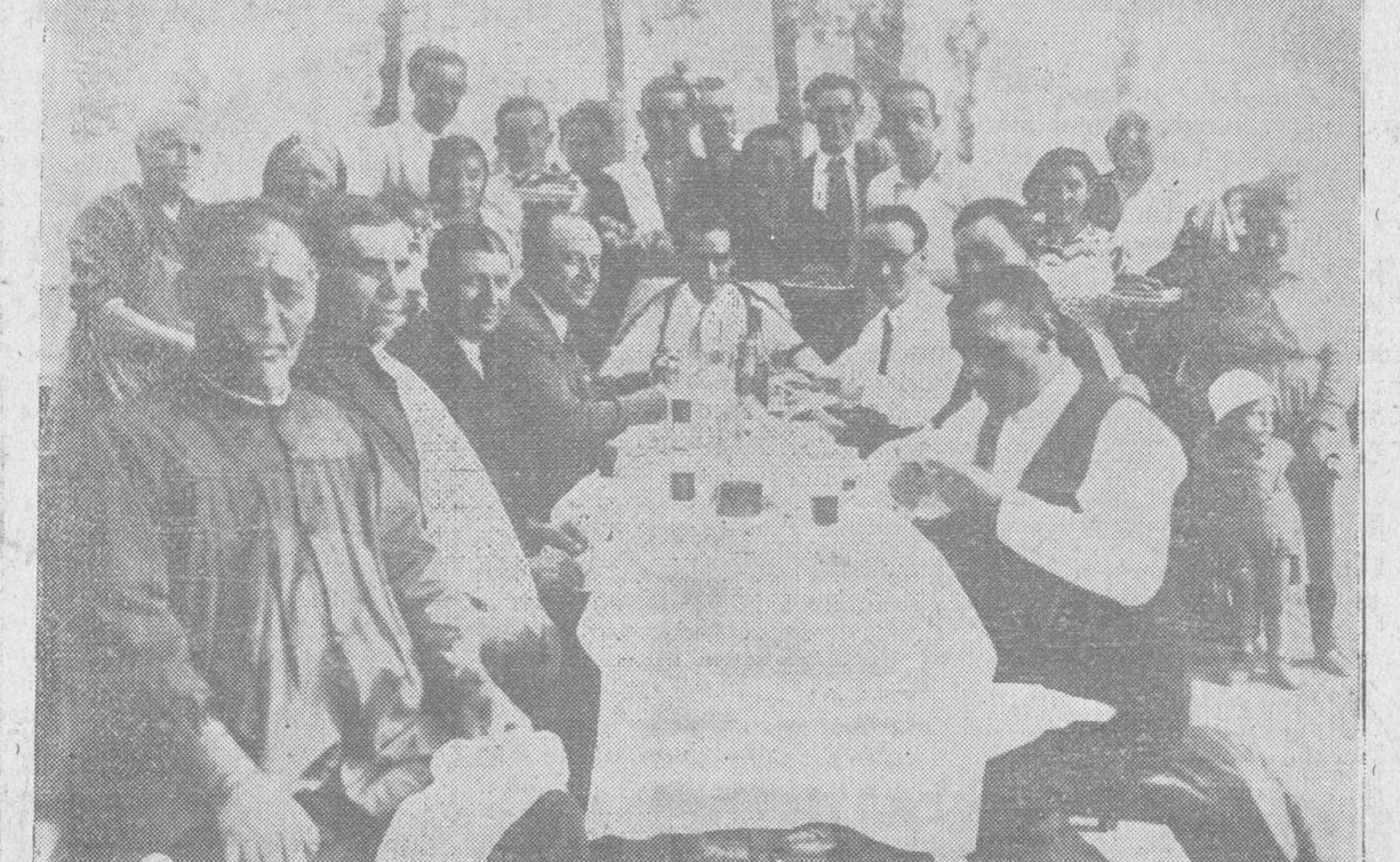
Arriba: Los concurrentes a la jira organizada por "La Productora de Leche".—Abajo: La mesa presidencial.