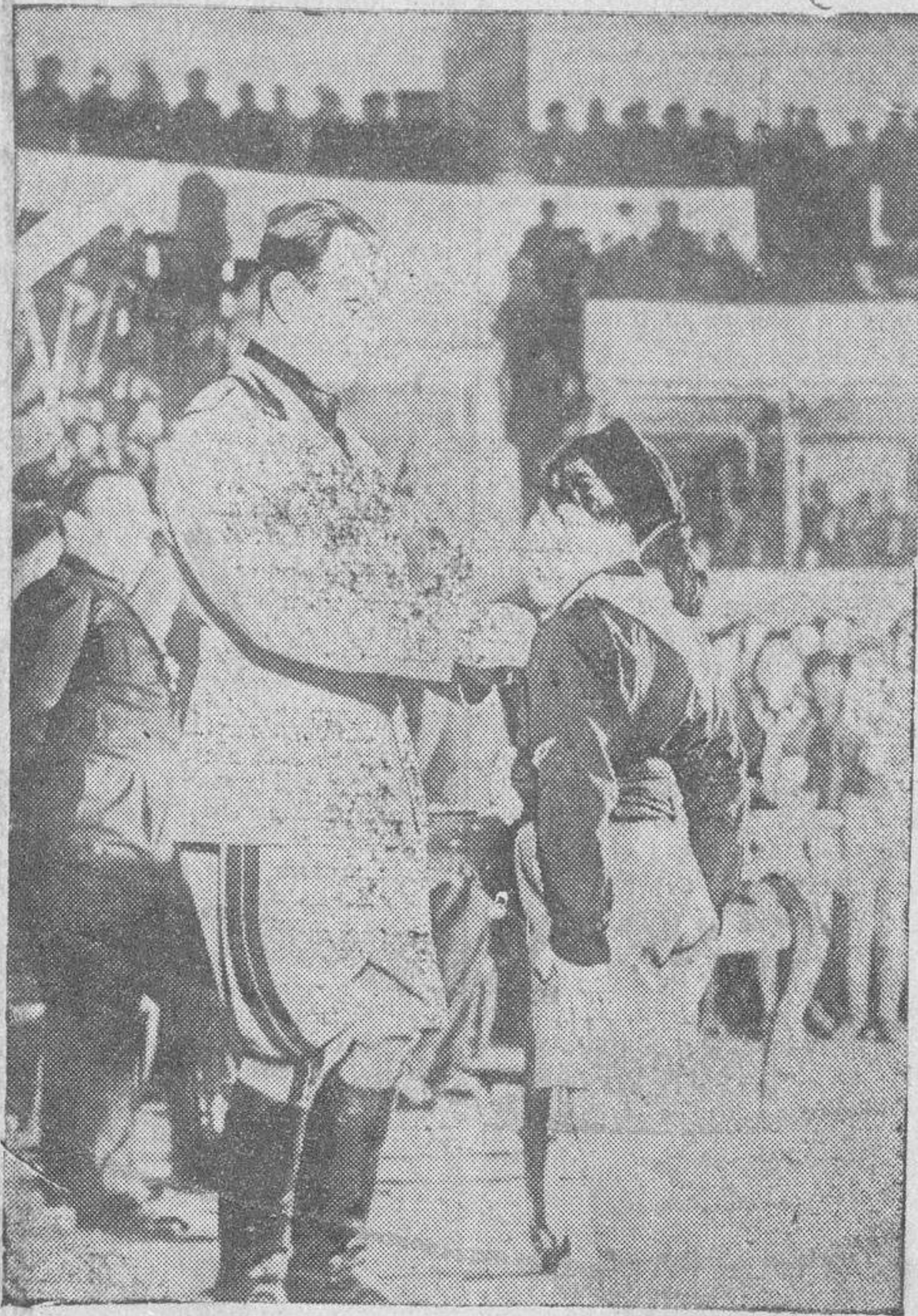
M. Ricci, subsecretario de Estado, encargado de la educación nacional, condecora a un joven "balilla"

Ha escrito una magnífica obra de Terapéutica de gran valor científico, utilizándole casi todos los estudiantes y médicos.