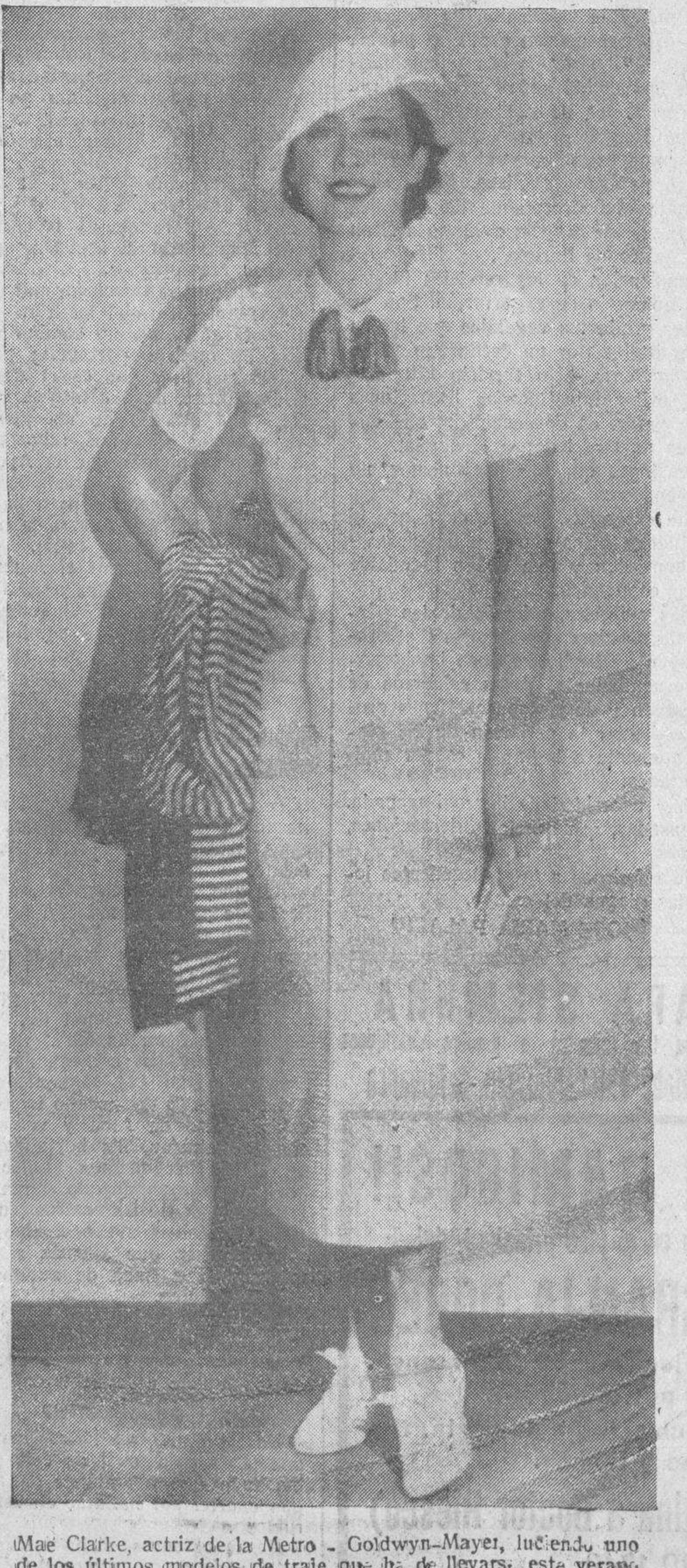
Mae Clarke, actriz de la Metro - Goldwyn-Mayer, luciendo uno de los últimos modelos de traje que ha de llevarse este verano