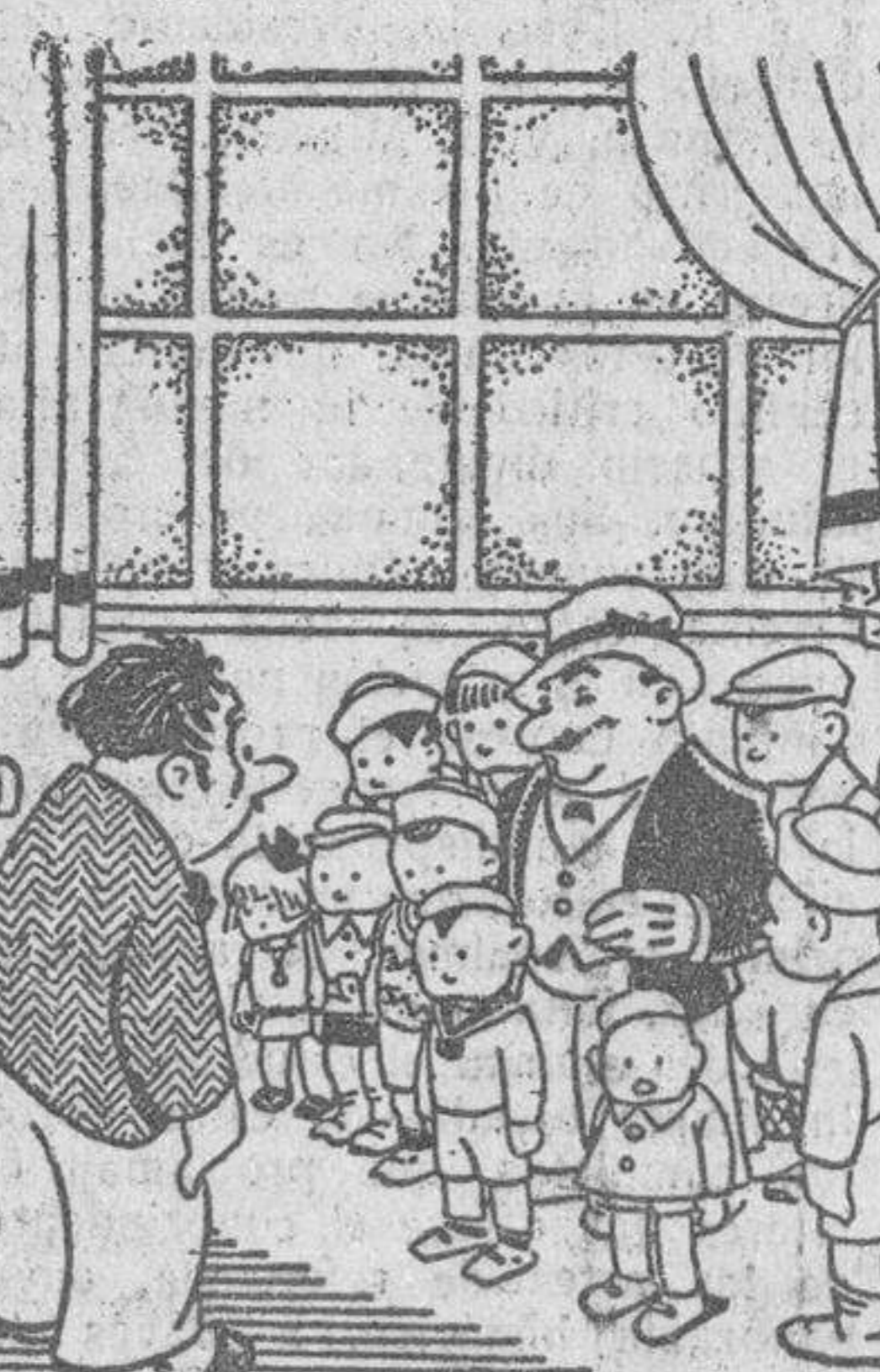
—Treinta pesetas docena? Pues habrá de hacerme una rebaja, porque sólo tengo once.