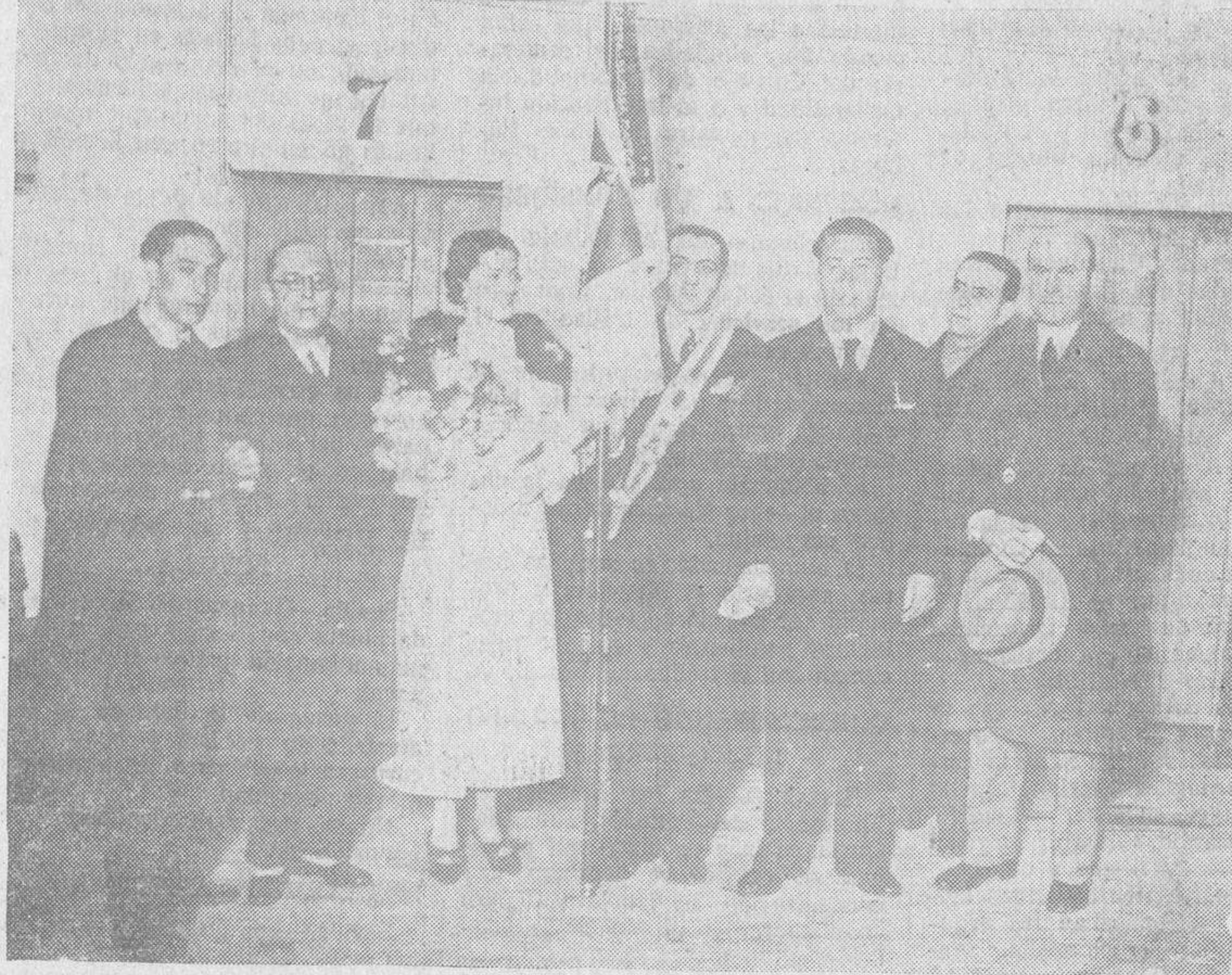
Los oradores que tomaron parte en el mitin de Acción Popular y la madrina en el momento de hacerse cargo de la bandera.

Hace otras consideraciones sobre la posición de las derechas en el Parlamento y termina aludiendo a los diecinueve puntos del programa de las Juventudes de Acción Popular, y dice que uno de ellos es admirable: "Nuestros jefes no se equivocan nunca". (El orador recibe una imponente ovación).