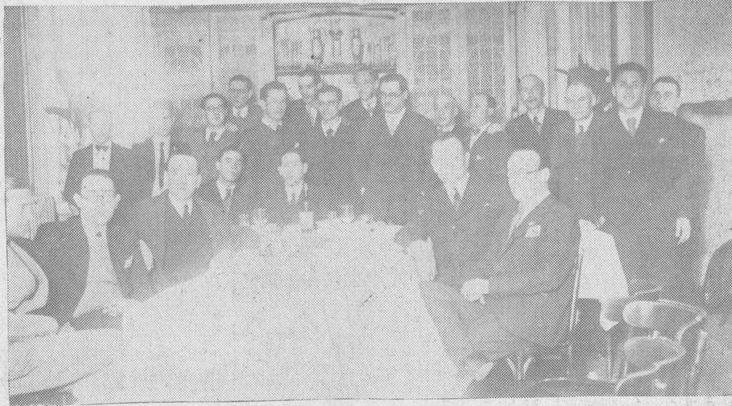
Los periodistas reunidos en fraternal banquete con los artistas premiados en el concurso de carteles organizado por la Asociación de la Prensa

También el Trío Madrid, que con un extraordinario éxito viene actuando en Novelty, obsequió a los periodistas con una audición que queremos calificar, sin incurrir en exageración, de sublime; por las obras que la compusieron y por la ejecución admirable que los tres grandes artistas hicieron de ellas.