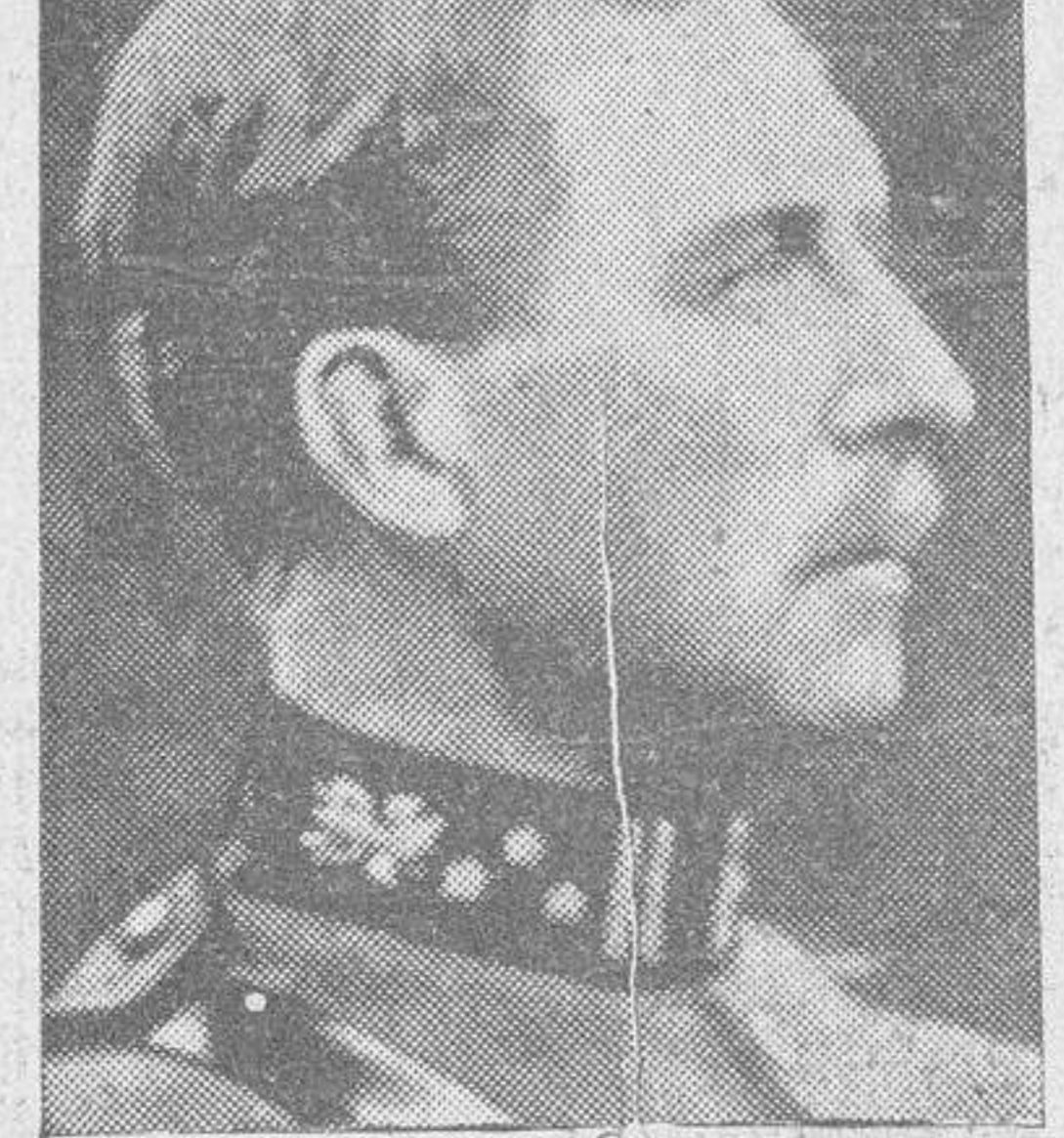
EL REY ALBERTO, DE BELGICA.

Bruselas.—El Gobierno se ha reunido en Consejo extraordinario.