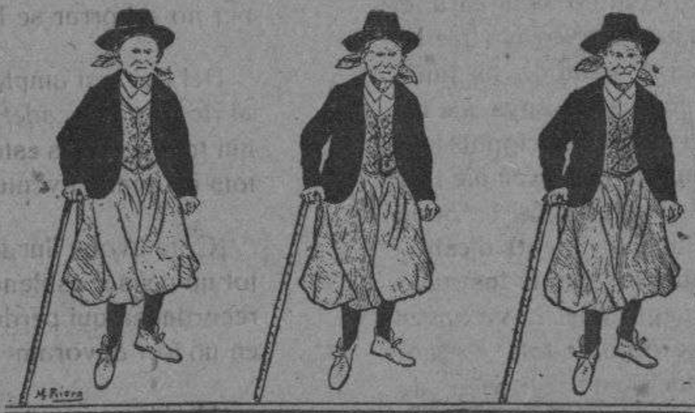
De l'Història de Mallorca en Premsa.

Redacció i Administració Murta, 5. - Inca.