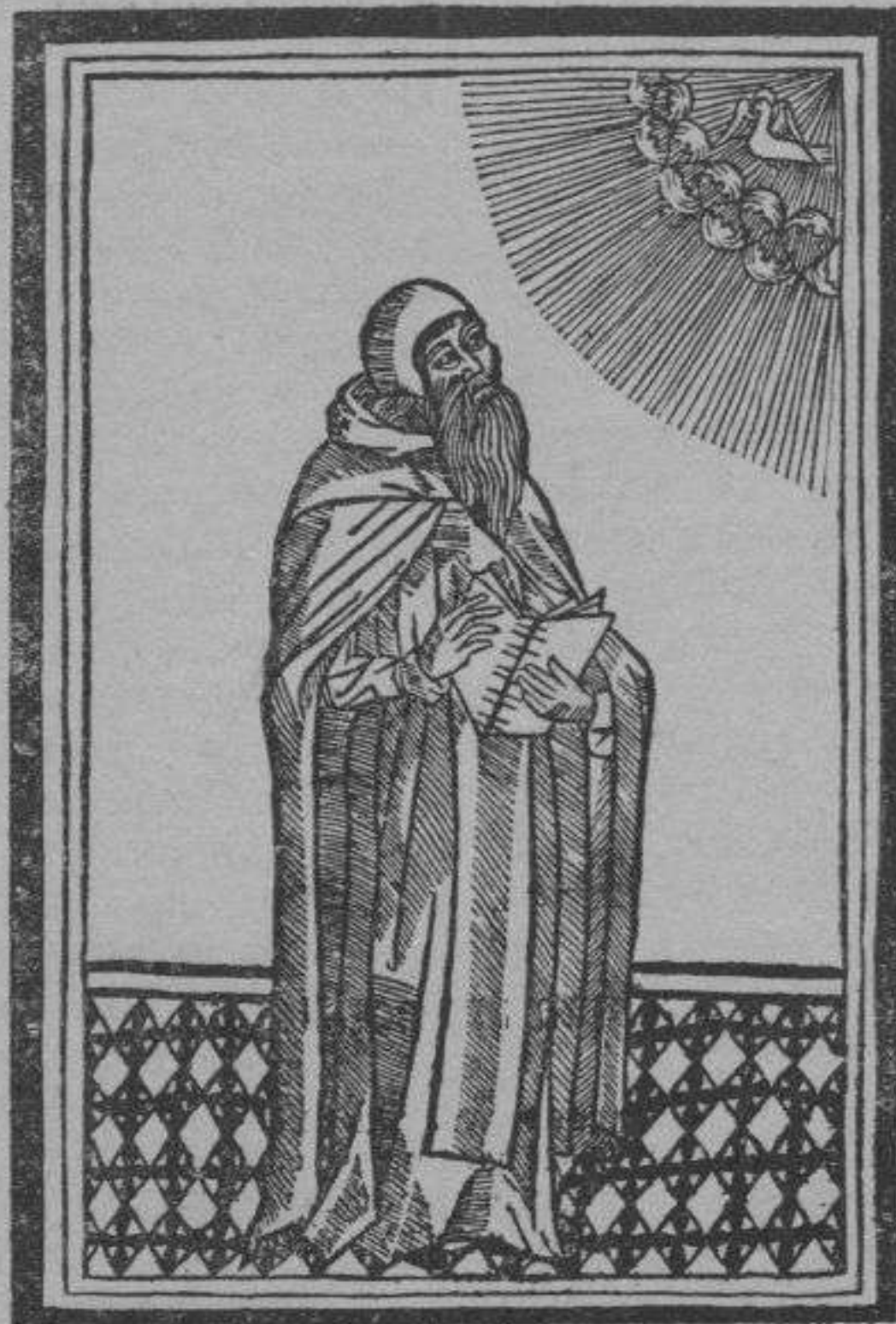
Reproducció de la portada del Apostrophe imprès a Barcelona l'any 1504.

En els dos anys qui correueren desde 1272 en que rebé aquella il·lustració divina origen del calificatiu de Doctor Il·luminat , fins a 1274, sorprén meravellósament la fecunditat del seu geni; car an aquella època s'ha de remuntar ja la composició o al manco la concepció dels esquemes d'una partida de tractats nous, essent dignes de menció el L. de Demostracions , la Lectura de la Art general , els Començaments de Teologia , de Filosofia , de Dret i de Medicina , el L. dels Articles , el L. dels Angels , el L. de Chaos , etc. que no eren més que aplicacions particulars de la Art Major .