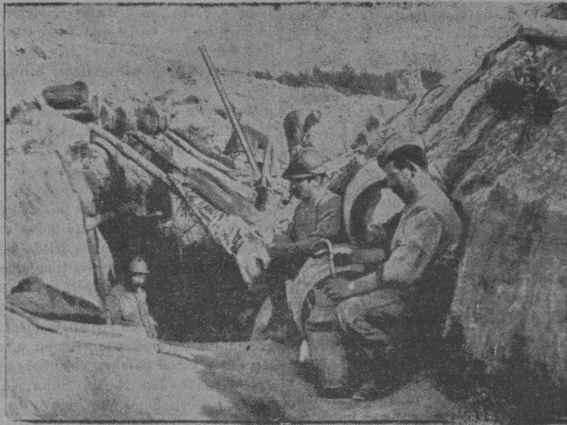
Entrada de un campamento situado cerca de la frontera servia.