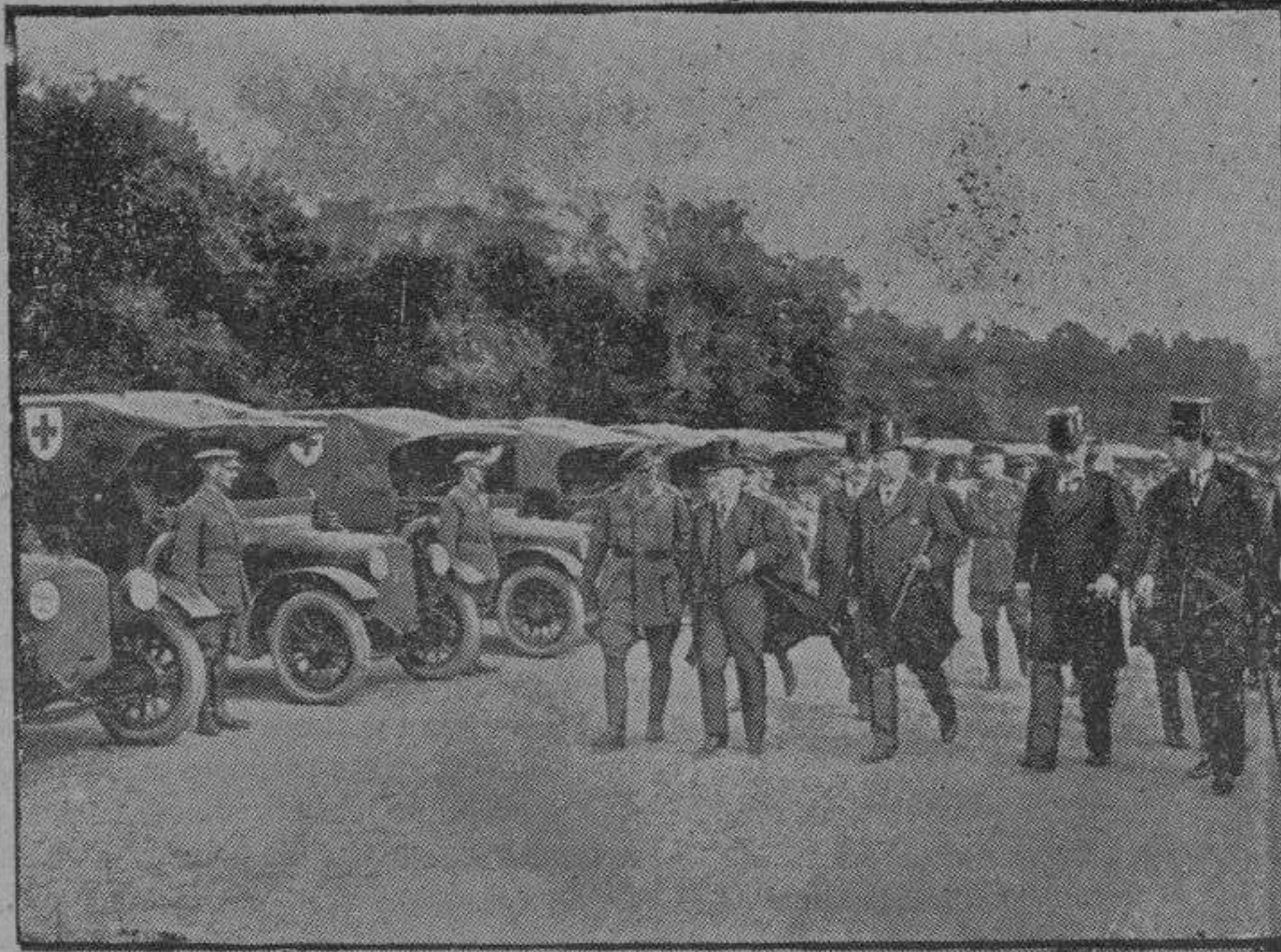
Ambulancia de cirujía al aire libre

representa el esfuerzo más grandioso de la humanidad hacia la comprensión de lo que está más arriba; y que nadie tiene el derecho de negar sus enseñanzas.