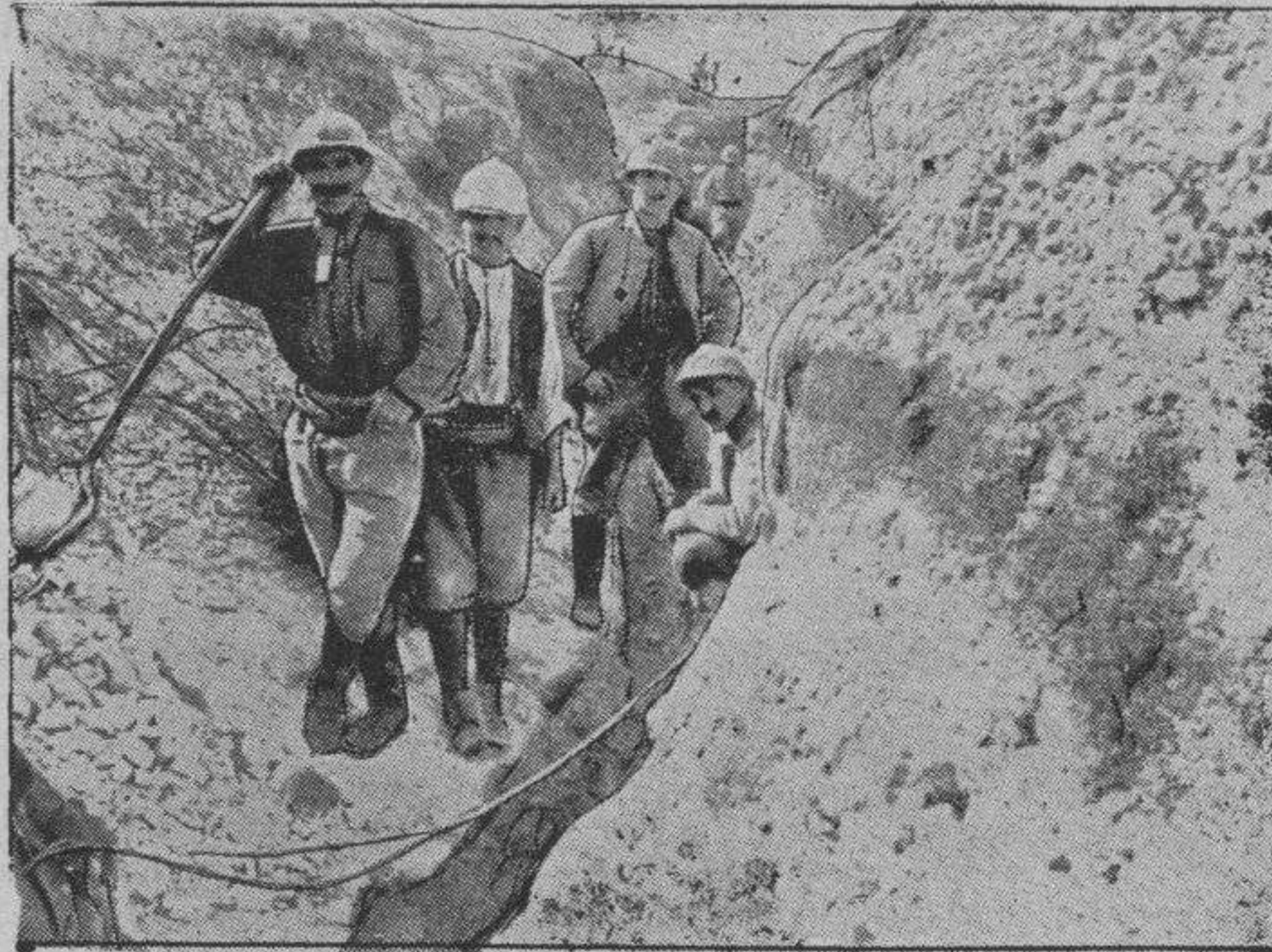
Los servios esperan la partida para la revancha

chando los carrillos como si fuesen pellejos de vino, abriendo la boca hasta casi desquiciarla; porque él era así para reír, sobre todo cuando oía cosas de tanta gracia como la que acababa de soltar Tío Lión .