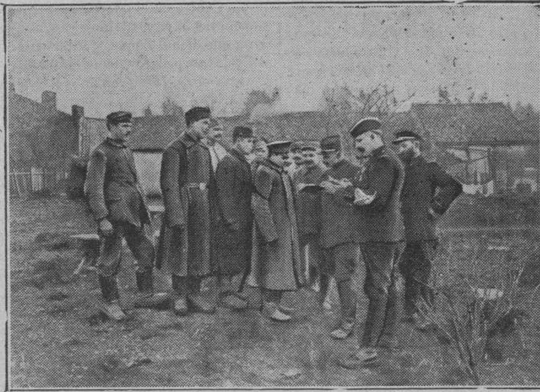
Grupos de soldados rusos prisioneros de los alemanes empleados en trabajos militares en el frente occidental, que lograron escapar y ganar las líneas francesas bajo disfraces.

y en las angustias de la tarea sin respiro, y en las noches de soledad en aquel infecto dormitorio cueva, dominio de roedores y parásitos inmundos, y bajo la manaza sin misericordia del moderno negrero, Juanín, humilde, con la bondad mansa y resignada de todos los suyos, contenta los sollozos, y, bebiéndose en silencio los lagrimones, balbuceaba muy quedito, más con el corazón que con los labios: