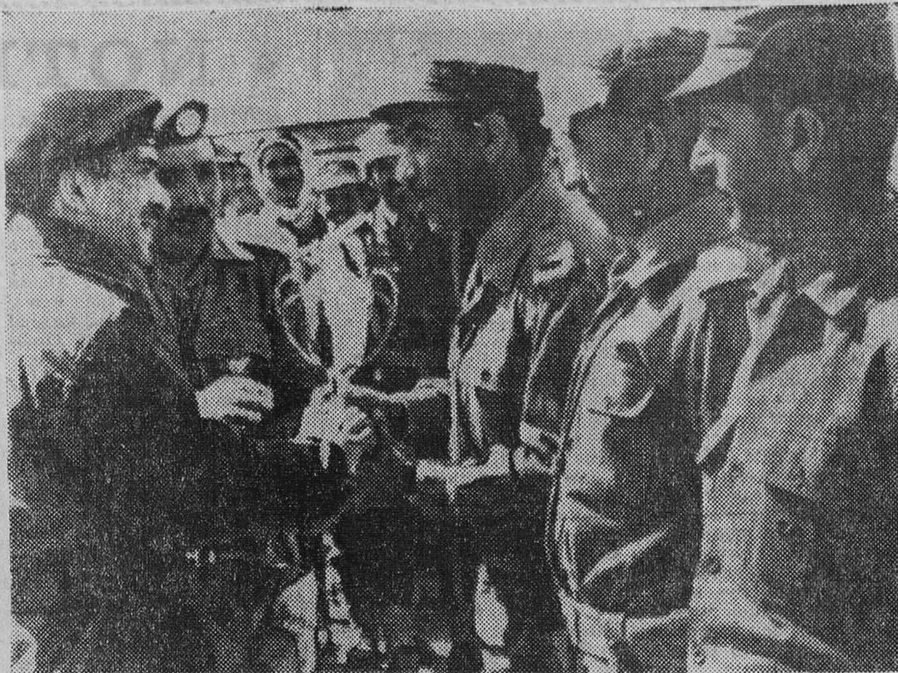
Amman. — El Rey Hussein de Jordania visita a las fuerzas armadas jornadas e iraquíes, destinadas en la orilla oriental del río Jordán. Aquí le vemos conversando con los soldados y jefes.