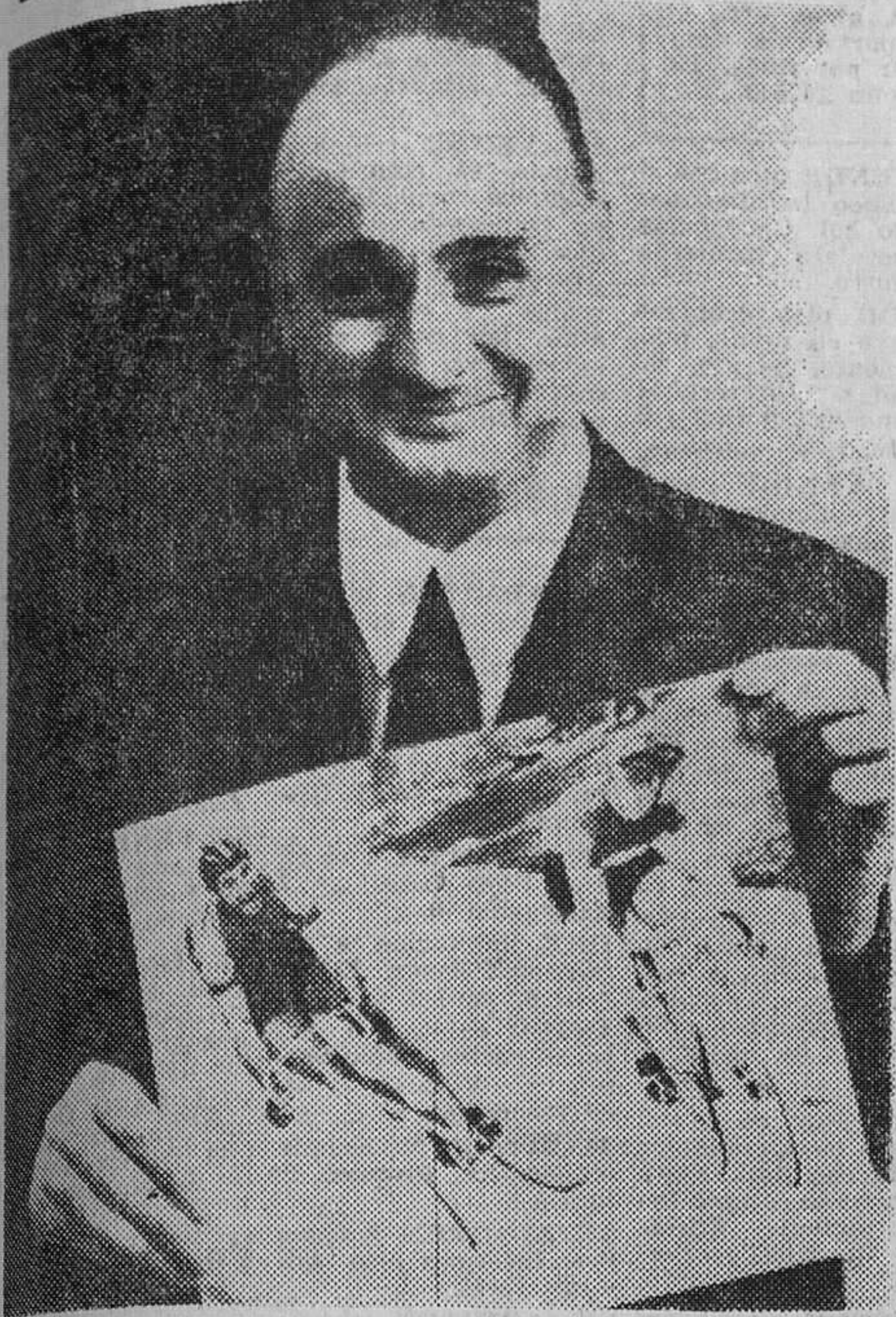
Paris. — Robert Delvac, periodista gráfico de la delegación de la Agencia United Press muestra la fotografía que le ha sido premiada con medalla de oro por el Club de Prensa de México a la mejor fotografía de la Olimpiada. En la foto se recoge el momento en que el ciclista ruso Phakadze está al borde de la caída justamente en la línea de meta cuando disputaba el «sprint» final al francés Trentin, que ganaría la prueba en dichos Juegos Olímpicos. — (Telefoto UPI-CIFRA)