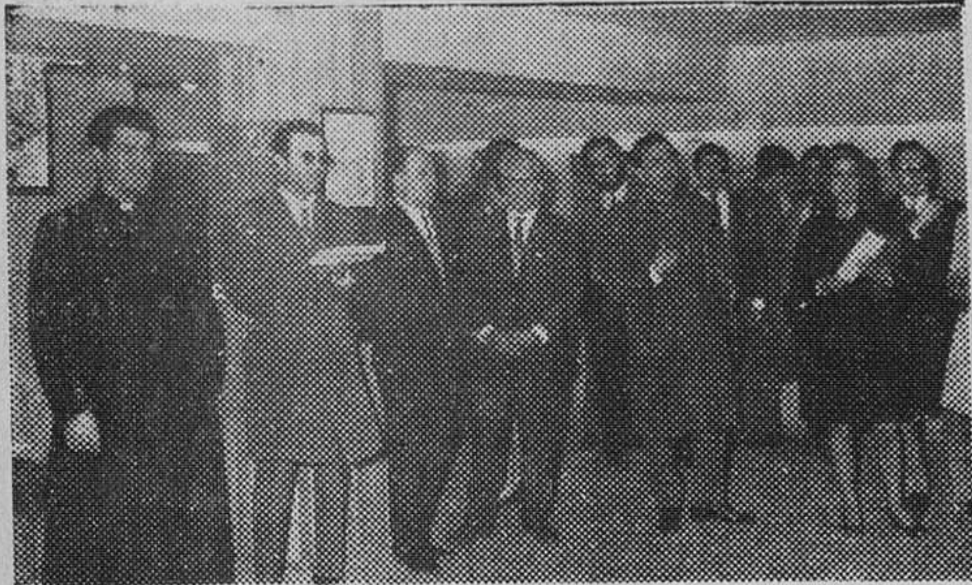
Un conjunto de once jóvenes pintores, bajo el título «Grupo Colegio Mayor San Jerónimo» expone sus obras en Burgos. Una exposición muy meritoria. El grabado recoge una vista de la Sala de Información y Turismo, donde se cuelgan los cuadros de estos artistas.

Presentación del «Grupo Colegio Mayor San Jerónimo», en la sala de Información y Turismo