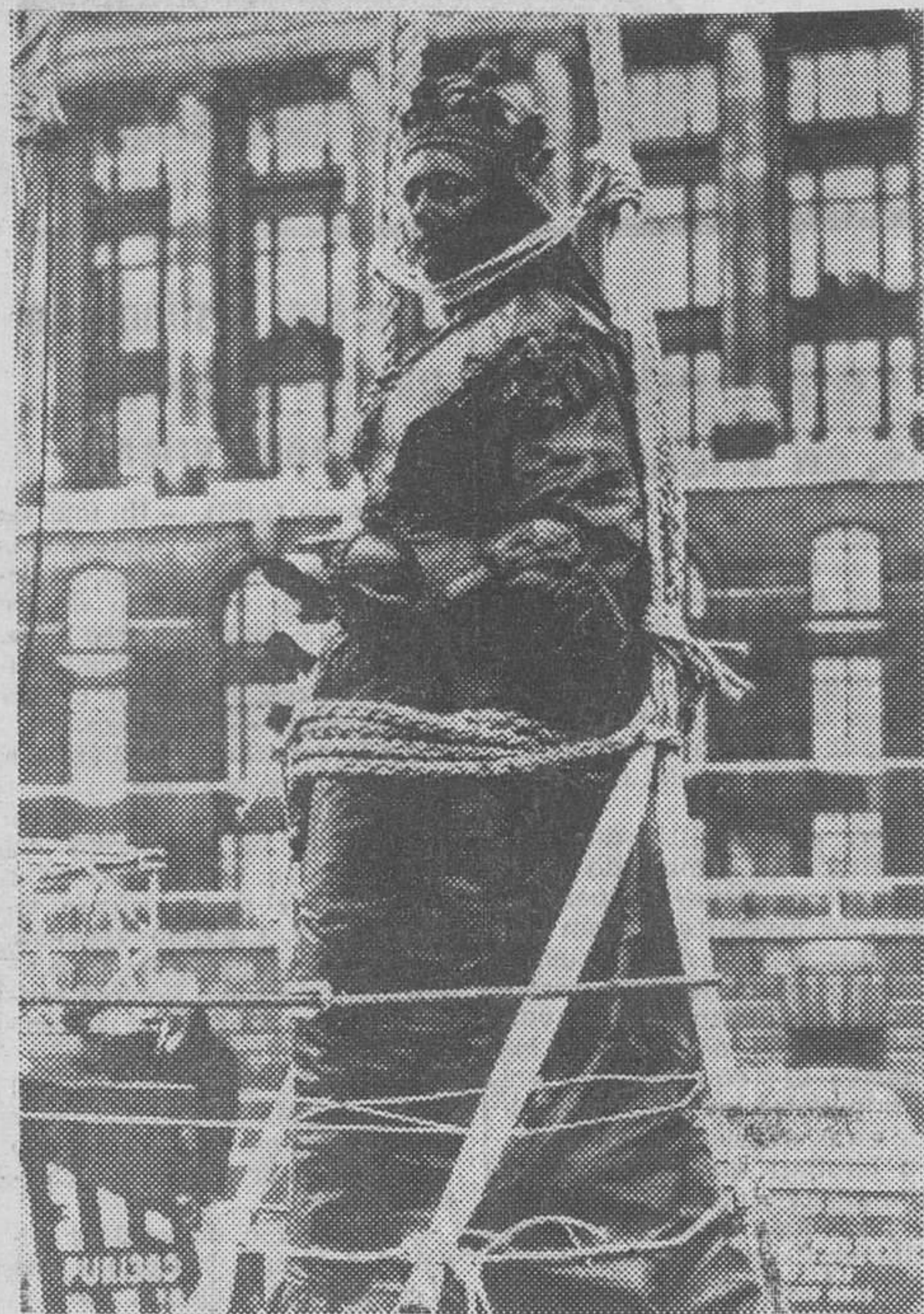
La Reina Victoria de Inglaterra no hubiera estado muy de acuerdo con la forma de realizar este viaje por Londres...