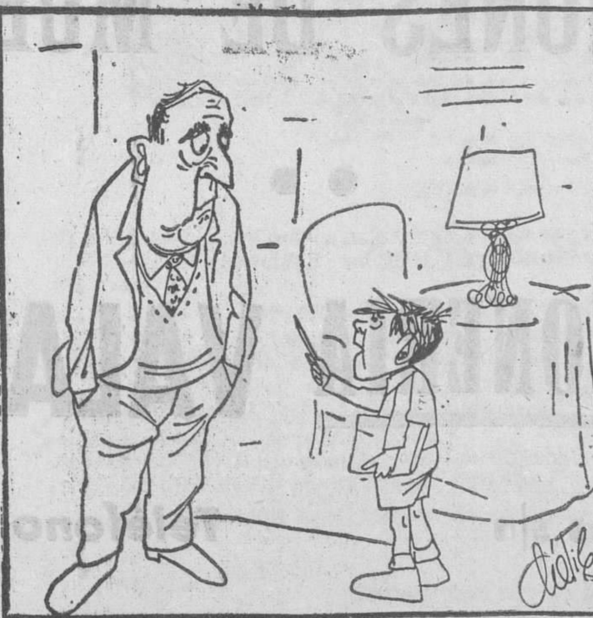
—¡No, papá, no! La regla de Rufini no tiene nada que ver con la Ley Orgánica...

Un turista admira los maravillosos bosques que le rodean y no puede menos de hacer un cumplimento a la persona que le acompaña: —Felizmente —dice—, aquí los árboles crecen. Y el hijo del país que marcha a su lado arguye: —¡Forzosamente!... No tienen otra cosa que hacer.