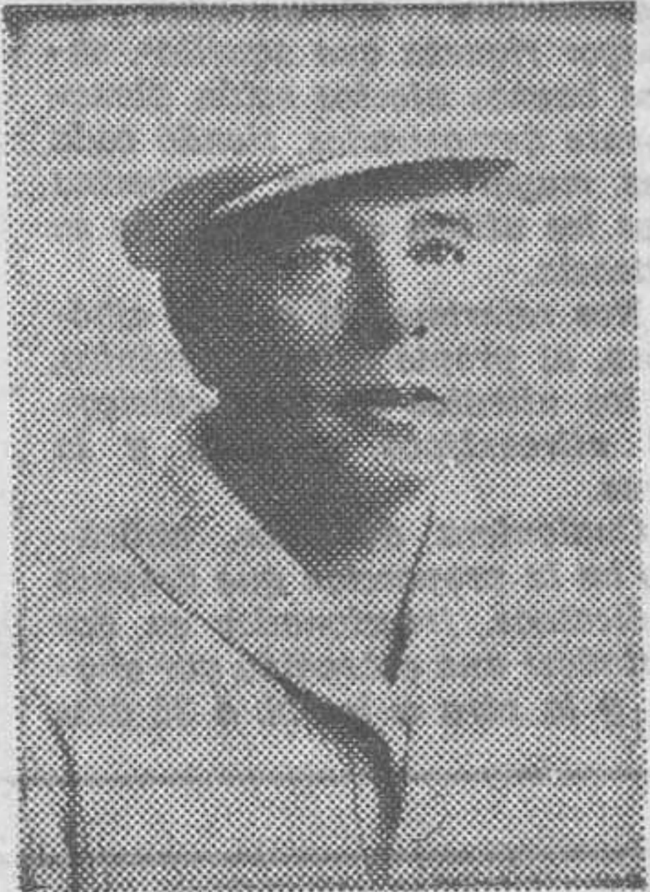
Ricardo Zamora, vistiendo el equipo de guardameta en su época dorada. Su sueter se hizo famoso

Ricardo Zamora es siempre actualidad. Para este viejo ídolo el tiempo se ha detenido. Ricardo Zamora siempre es tema futbolístico. Ricardo ha sido una de las figuras más prestigiosas del deporte español. Su personalidad, su prestigio y su calidad humana le han granjeado siempre la simpatía de la afición española. Hace años, cuando todo el mundo gritaba admirado su nombre; después, como entrenador, y ahora como técnico del Real Club Deportivo Español y periodista. Sus artículos para la Agencia EFE y sus comentarios en "La Vanguardia Española", son siempre lecciones deportivas, salpicadas de pasajes de su vida y madura experiencia deportiva.