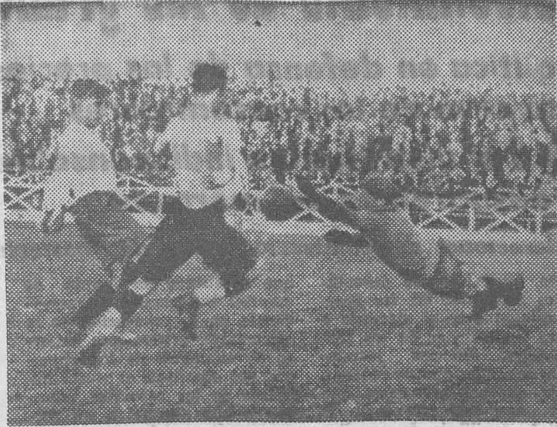
Una de sus más características paradas.

La charla con Zamora finaliza. Su vida ha pasado rápidamente ante nosotros. Momentos agradables y otros amargos. Pero la vida continúa. El sol está en lo alto, cuando Zamora sale a las calles barcelonesas. Y unos pequeños se le acercan para pedirle un autógrafo. Zamora sonríe... Sí, la vida continúa, pero la fama del gran Ricardo será eterna. El paso de las generaciones así lo confirman.