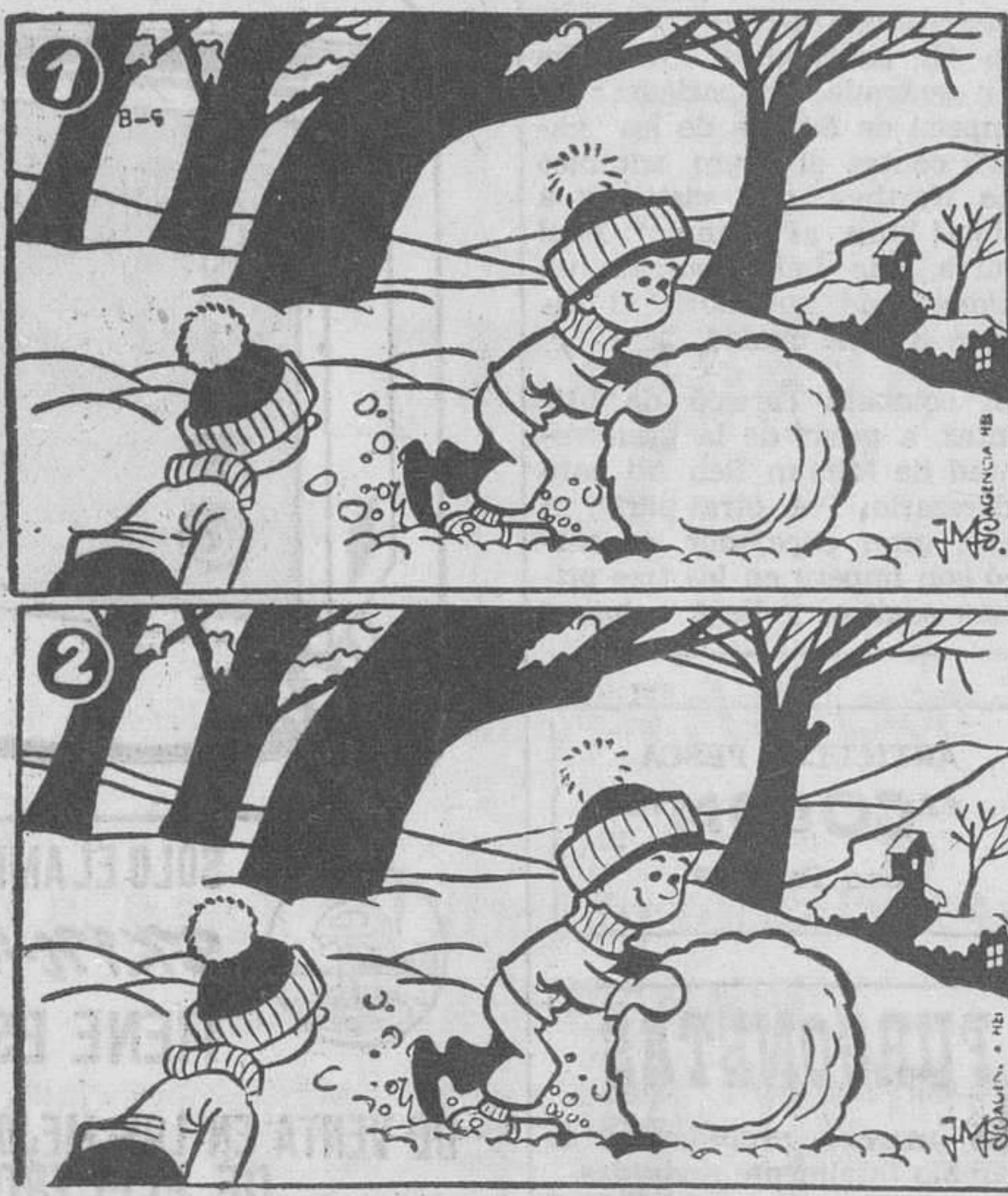
Estos dos dibujos son aparentemente iguales. Siete diferencias los separan. Si es usted buen observador debe descubrirlos antes de cinco minutos.