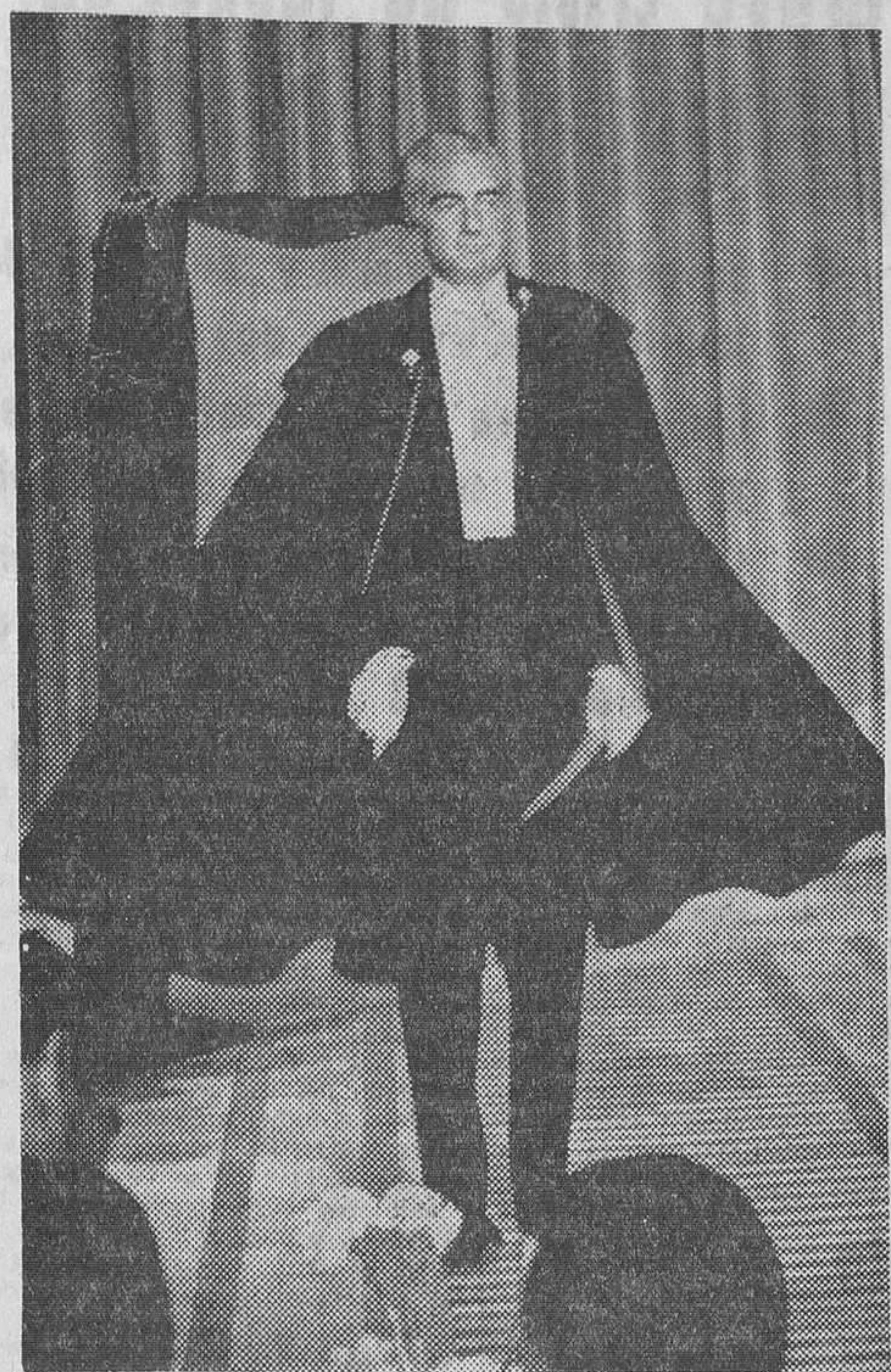
¿Vuelve a llevarse la capa? ¿Se trata de una prenda ya «pasada»? No entramos ni salimos en esta cuestión, pero informamos de que no hay desfile de moda masculina española en que no se muestre, como colofón, la mencionada prenda.

La capa sirvió a la manoleña para abrigarse y también para torear, aunque claro, es-