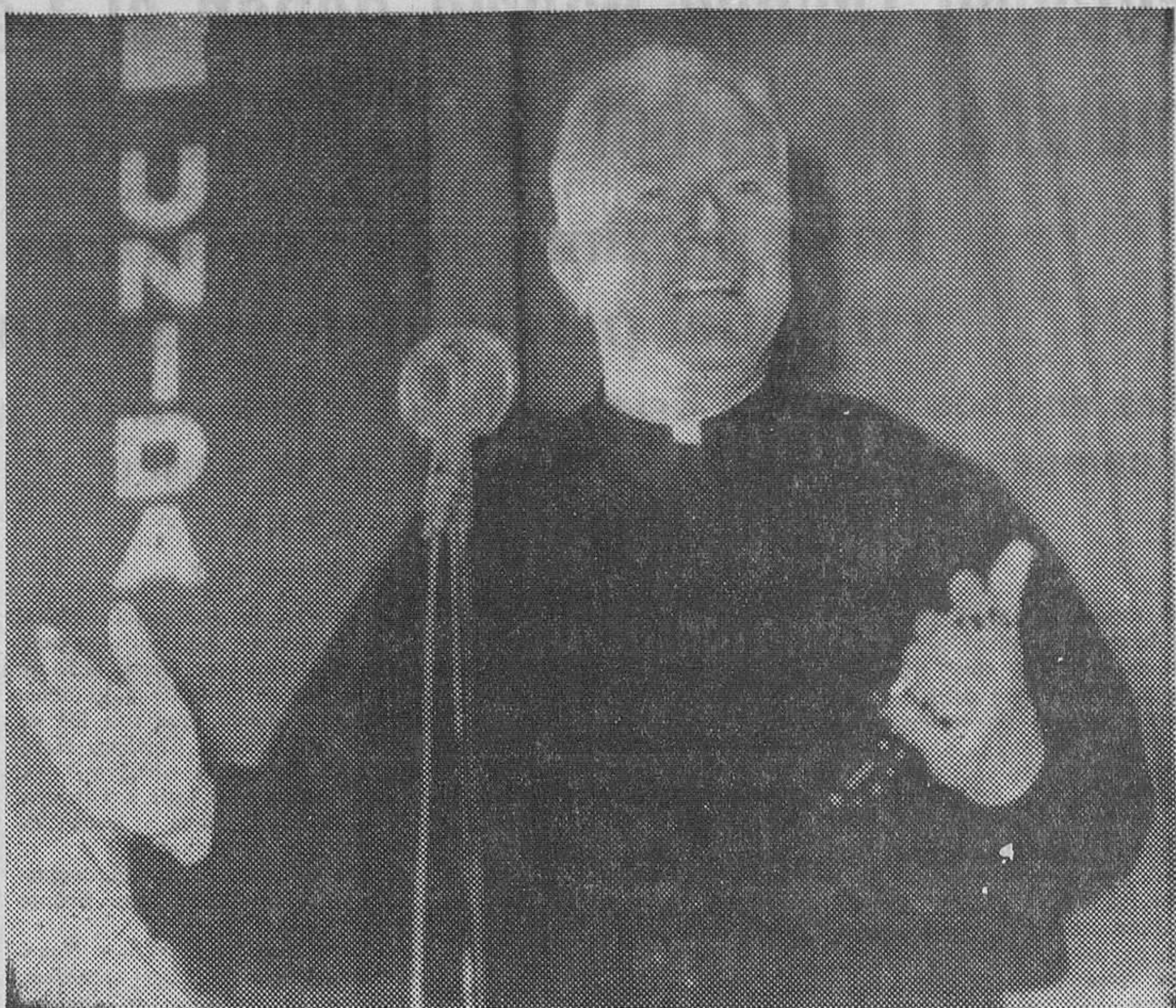
El Padre Peyton, promotor de la Cruzada del Rosario en Familia.

—Tenemos previsto un gran programa navideño con la participación del Santo Padre Paulo VI, que este año no ha sido posible, pero el Santo Padre, nos prometió que en otra ocasión, para el año próximo.