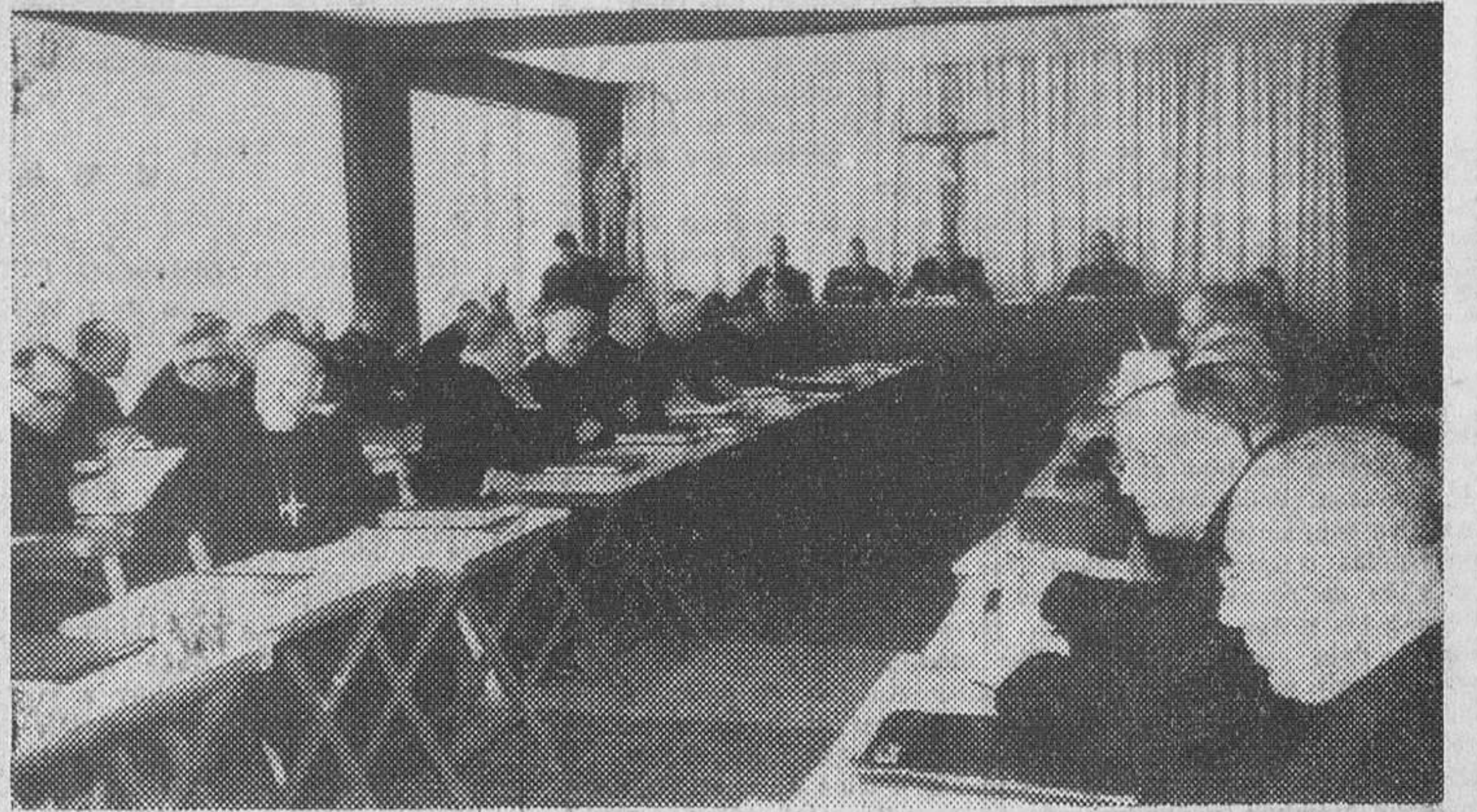
En la Casa de Ejercicios de El Pinar, en Madrid, se ha reunido la Asamblea plenaria de la Conferencia Episcopal española. En la fotografía vemos un aspecto de la reunión.