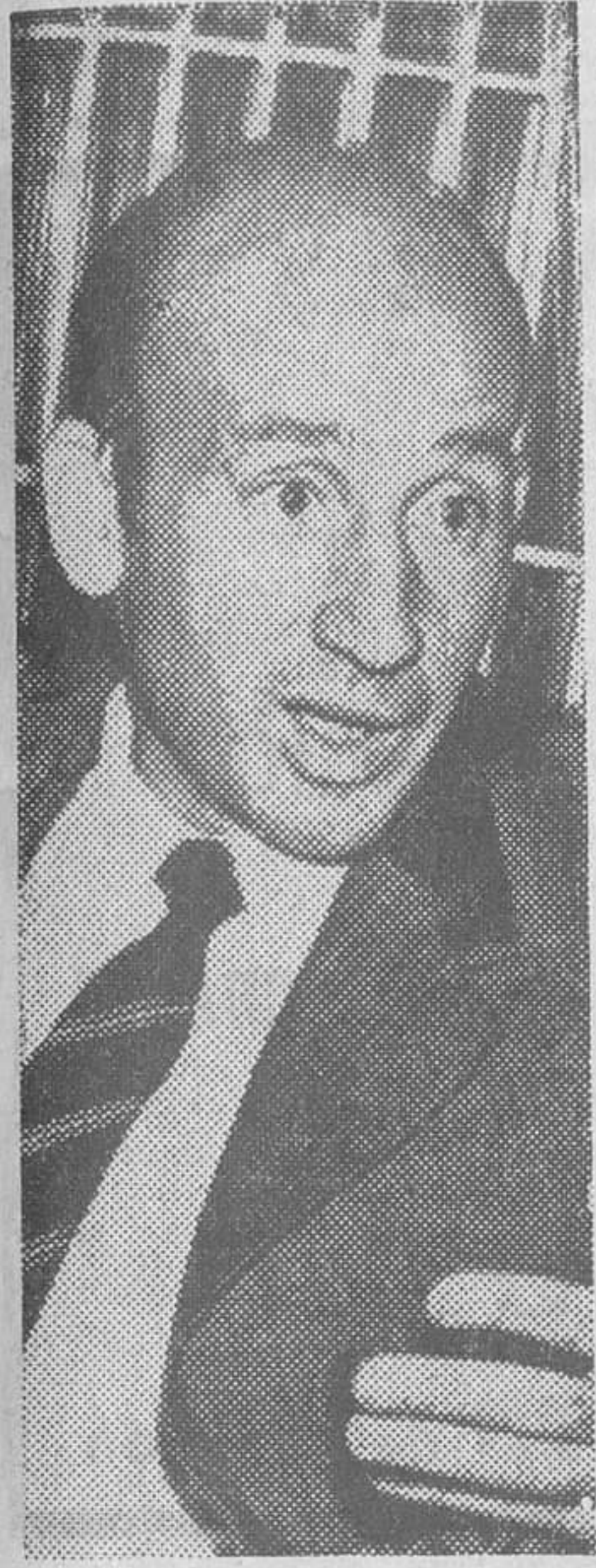
Adolfo Marsillach va a estrenar en Madrid y vuelve a la pantalla de la Televisión. Dos noticias importantes de nuestra vida teatral de hoy, tras el paréntesis veraniego

A DOLFO Marsillach entra de nuevo — salió alguna vez de ella? — en el plano de la actualidad. Por su estreno de principio de temporada teatral con «La piedad de Noviembre», y por su vuelta a Televisión con un programa semanal.