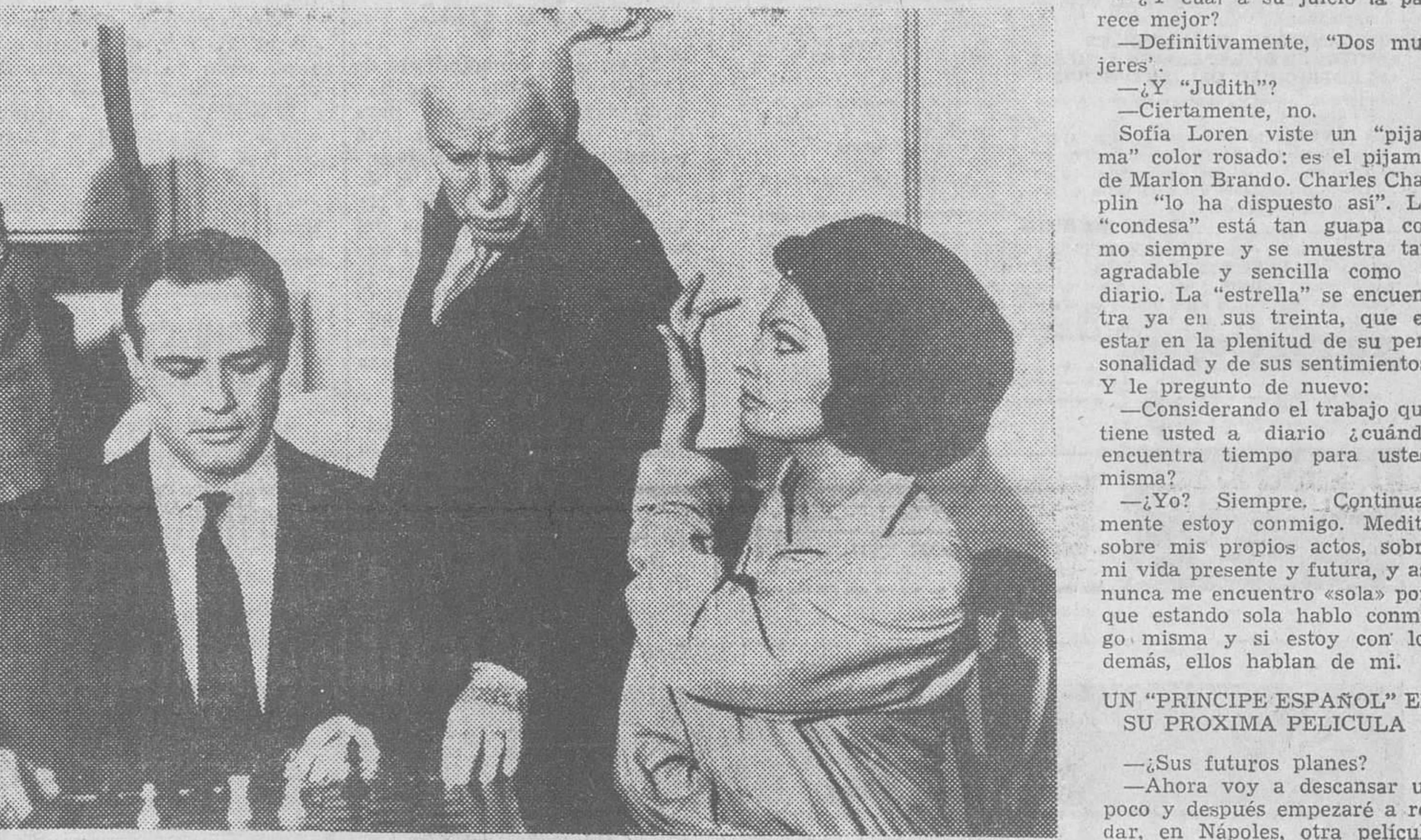
En unos estudios londinenses acaba de rodarse una película, «La condesa de Hong Kong». Su director es «Charlot», e intérpretes principales Sofia Loren y Marlon Brando, tres nombres de primera fila en la aristocracia del cine

— es muy diferente a ser. Se puede ser muy inteligente y no saber actuar. Charles Chaplin está nervioso y se muestra reiterativo en el momento de dirigir. Bebe un vaso de agua casi de un trago. Viste un jersey gris, chaqueta del mismo color y pantalones de un tono más oscuro. Como acaba de salir de una «gripe» no se quita ni un instante su sombrero de fieltro también gris. Sus gafas son de gruesos cristales. A veces se pasea por el