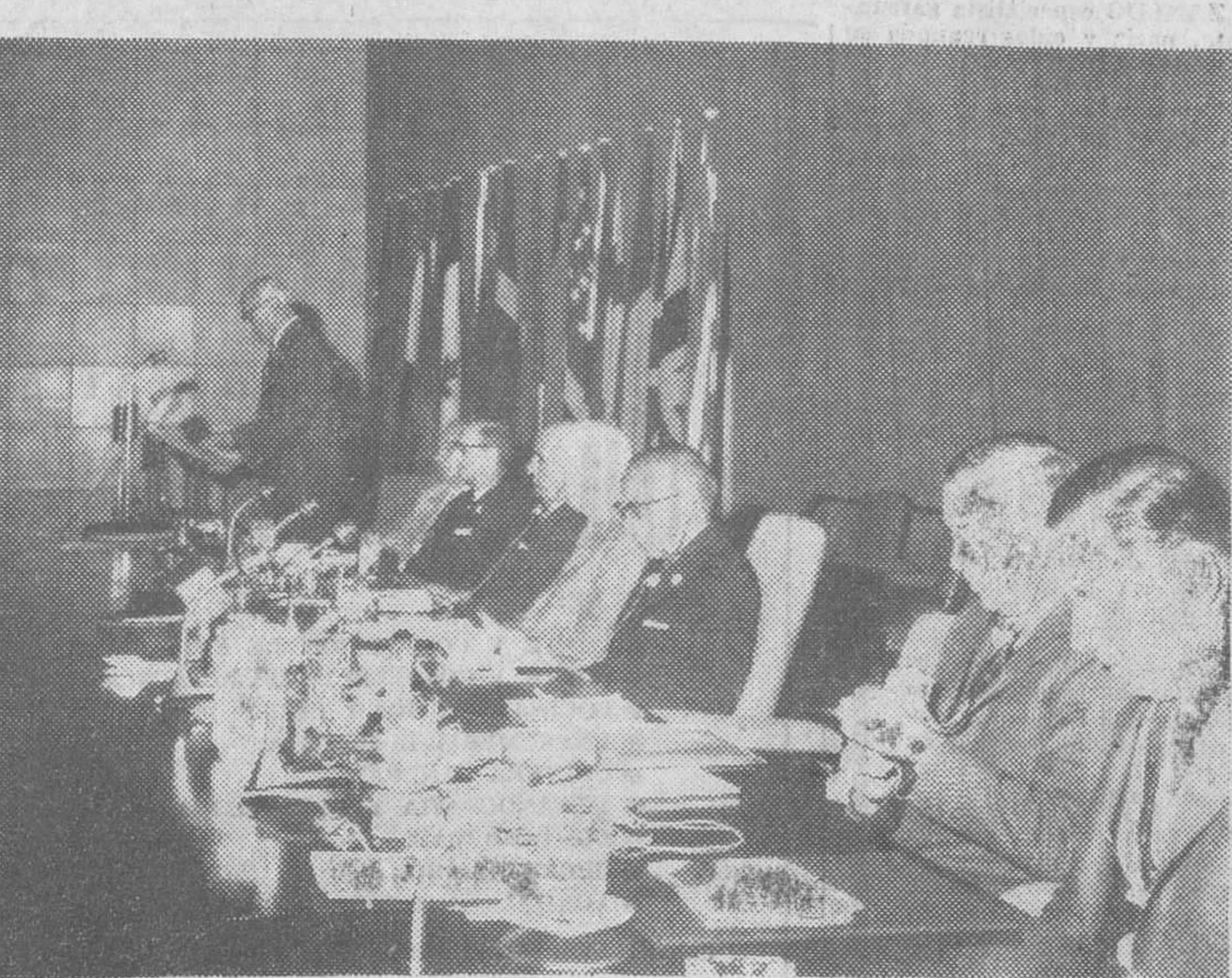
Madrid. Clausura de la Asamblea de Información de Farmacia en la Casa Sindical, presidida por el subsecretario de Gobernación, señor Gutiérrez de Miguel. En la foto, un momento del acto