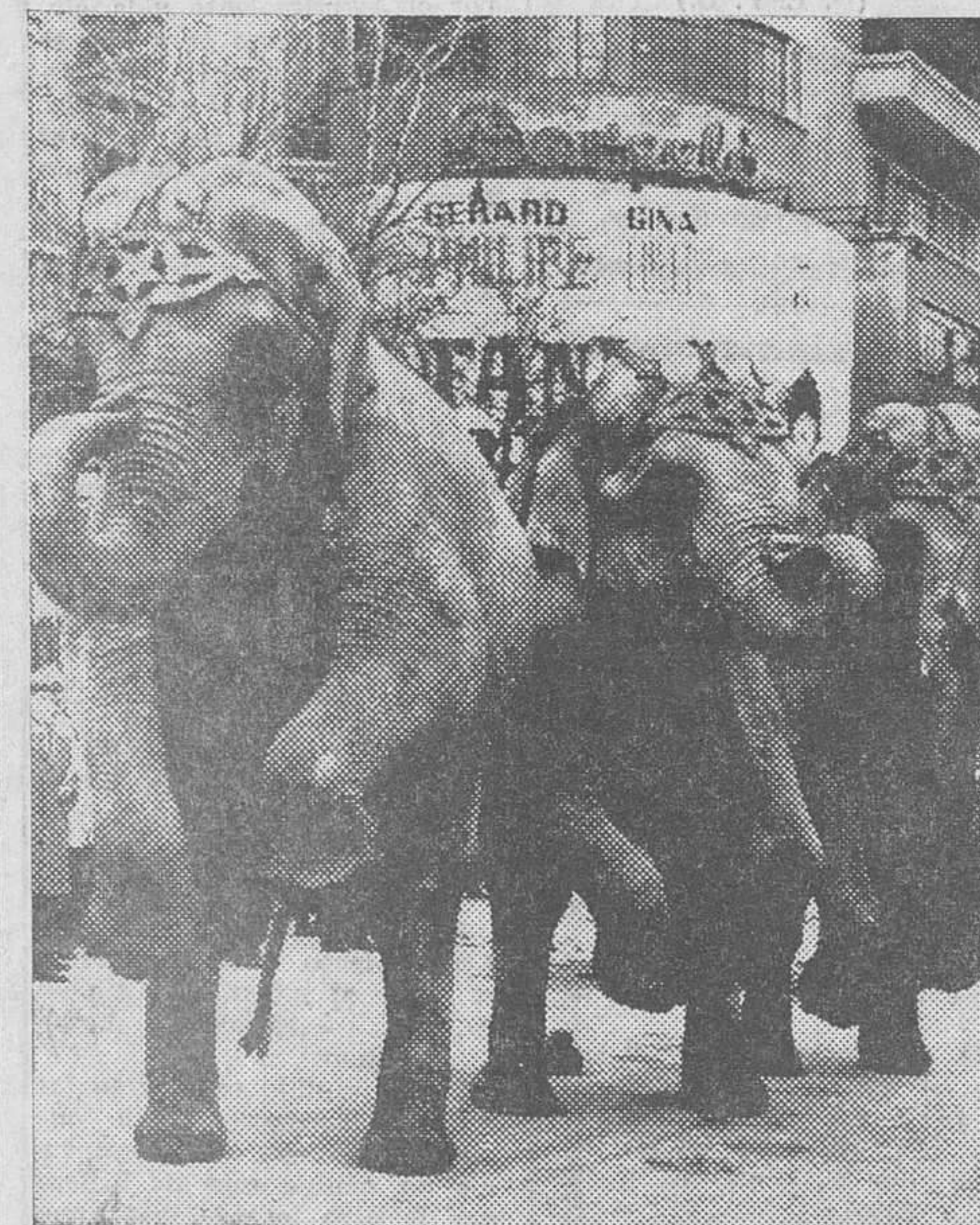
Madrid. — En el tradicional día de San Antón, se ha celebrado dentro de una gran animación el desfile y bendición de animales. Estos iban adornados y vestidos con gran lujo y simpatía, y los niños han disfrutado mucho con el paso de los animales. Elefantes, caballos, perros, gatos, pájaros, toda clase de animales han desfilar por el recorrido madrileño en este día dedicado al género irracional. En la foto, un momento del simpático acto.