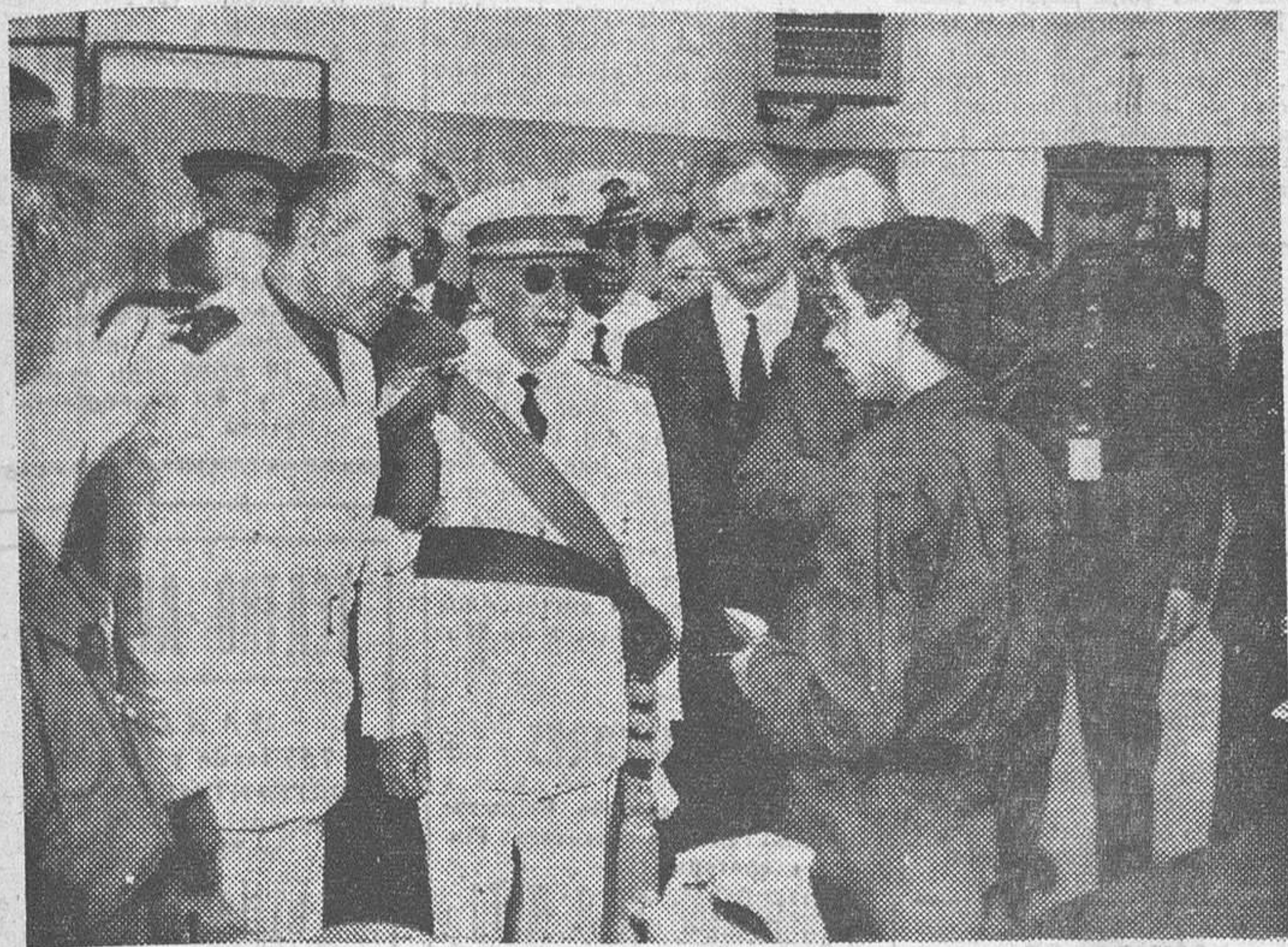
El Jefe del Estado, Generalísimo Franco, acompañado del Secretario General del Movimiento y delegado nacional de Sindicatos, don José Solís Ruiz, conversa con uno de los obreros del Centro de Formación Profesional Acelerada en los talleres del mismo, inaugurados el 18 de Julio, fiesta nacional española.

Franco inauguró varias emisoras de radio, un nuevo enlace de T. V., un centro de Formación Profesional Acelerada y la ciudad sanatorial "La Paz"