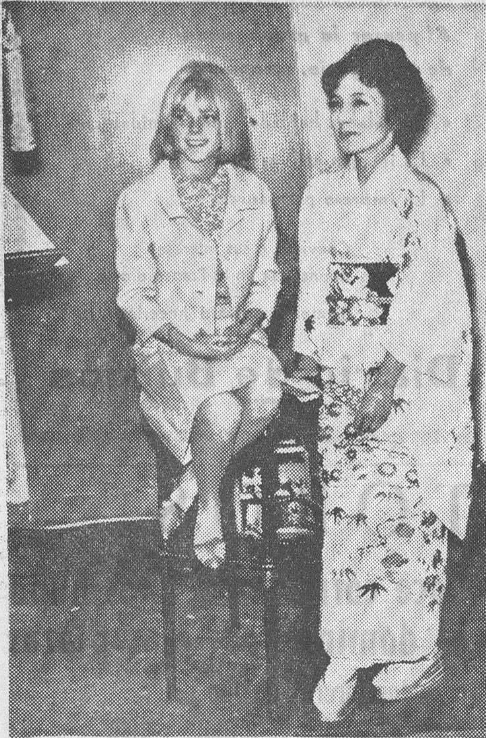
La famosa cantante francesa France Gall, ganadora con su «Muñeca de cera» del último concurso de la Eurovisión, ha cantado ahora en japonés para hacer una grabación del famoso disco...