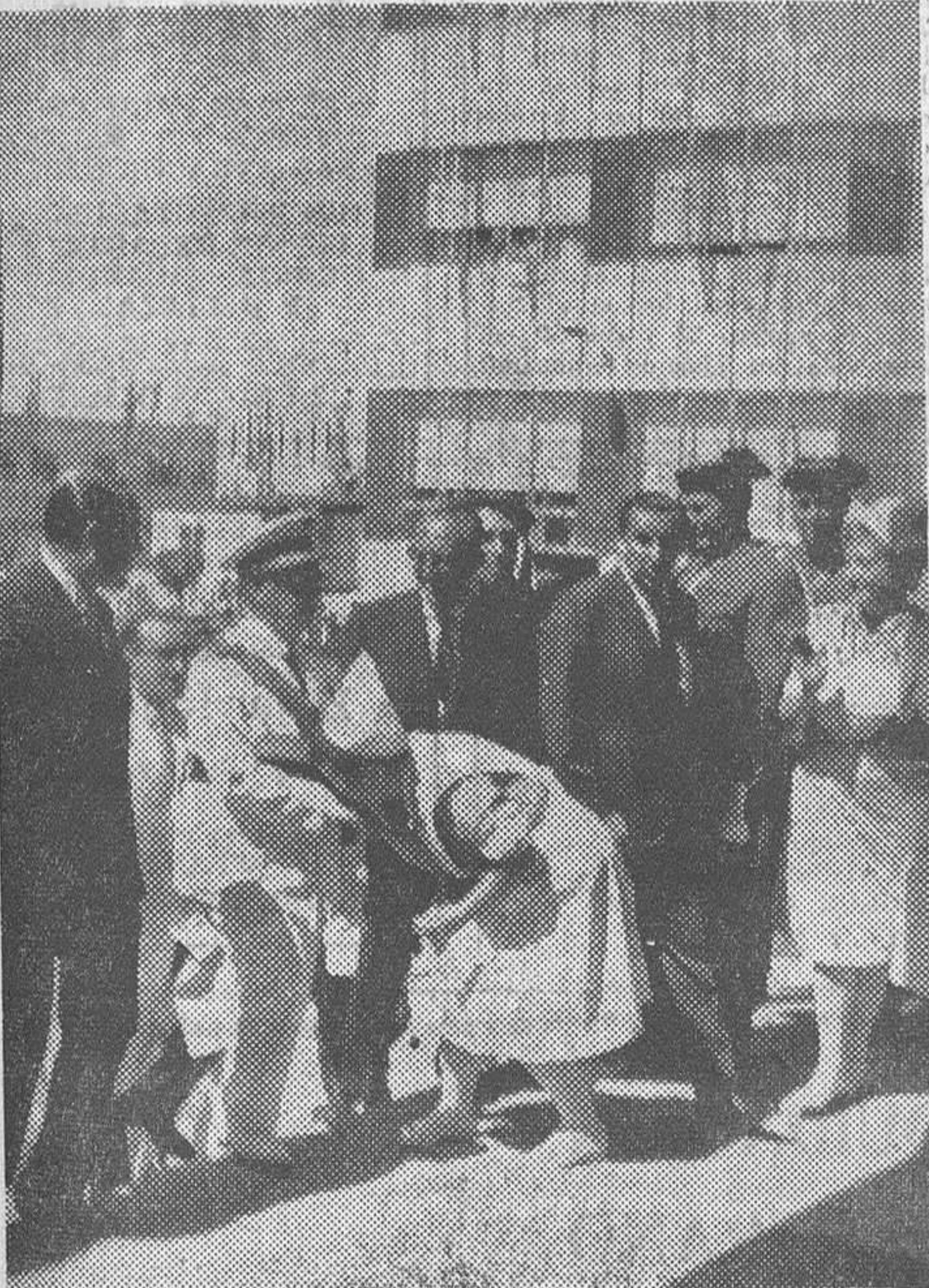
A su llegada a la Maternidad «La Paz» de la Seguridad Social, en Madrid, el Jefe del Estado, a quien acompañaban su esposa y el ministro de Trabajo, señor Romeo Gorria, fue sorprendido cuando una de las enfermeras del nuevo Centro, rompiendo todo protocolo, se dirigió hacia él y conmovida, le besó la mano, momento que recoge la fotografía.

Posteriormente los dos detenidos escaparon siendo vultuos a capturar sin lucha. Han sido puestos bajo custodia de las autoridades de Marina en espera de una investigación sobre el incidente.