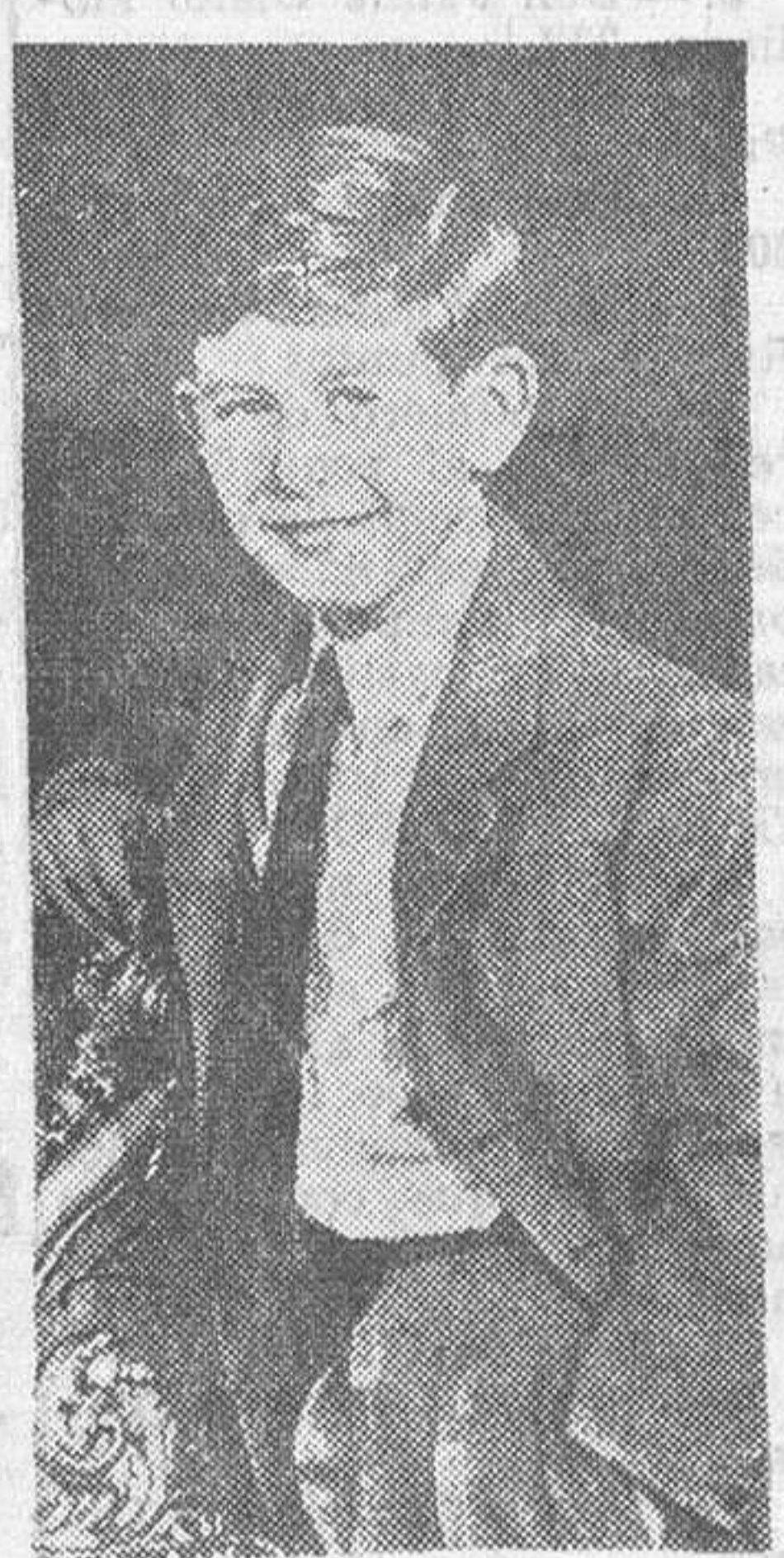
no han dejado de levantarse voces en el interior de Inglaterra contra semejante probabilidad. Se había hablado asimismo, de su ingreso en la academia militar...